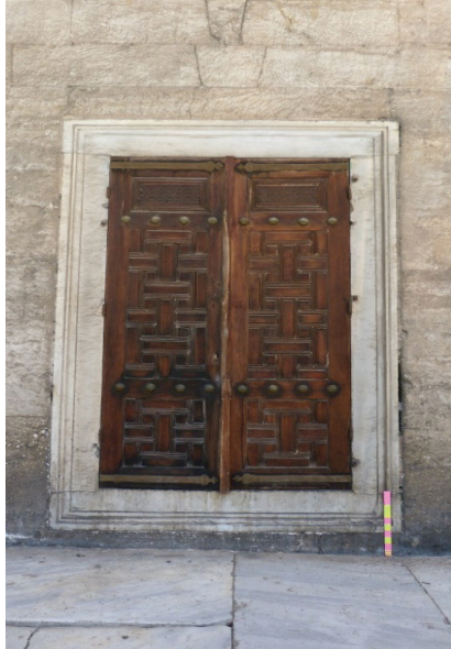
Ek 6: Sağdaki Sultan Ahmed Camii imam kapısı ve kanatları.