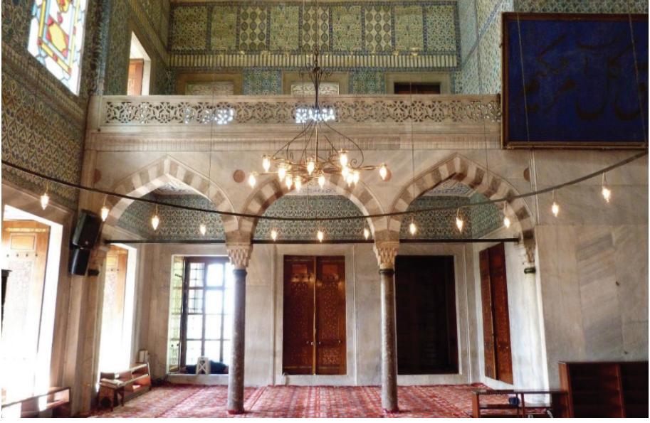
Ek 7: Sultan Ahmed Camii alt kat nizami pencereleri ve imam kapısının genel görünümü.