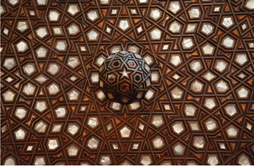
Ek 11: Sultan Ahmed Camii künde-kârî vaaz kürsüsü detayı.