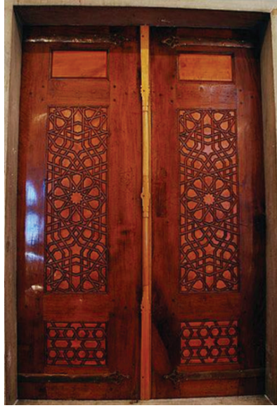
Ek 1: Sultan Ahmed Camii üst mahfel künde-kârî bir pencerenin kanatları