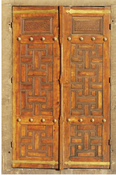
Ek 9: Sultan Ahmed Camii avlu pencerelerinden biri ve künde-kârî kanatları