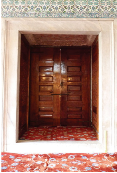
Ek 5: Sultan Ahmed Camii avlu pencerelerinden biri ve künde-kârî kanatları.