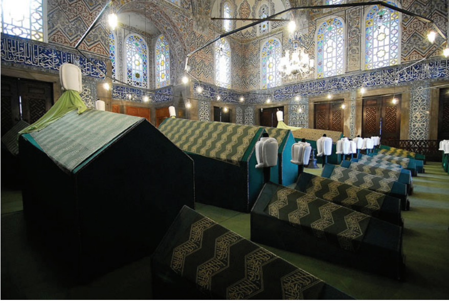
Ek 10: Sultan Ahmed Türbesi ve nizami pencereleri künde-kârî kanatları genel görünümü.