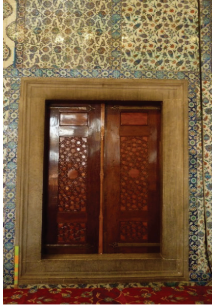
Ek 4: Üst mahfel kuzeybatı künkârî pencerelerinden biri