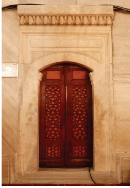
Ek 3: Üst mahfele çıkan künkârî bir kapı ve kanatları