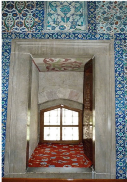
Ek 13: Sultan Ahmed Camii üst mahfel pencere kasaları.