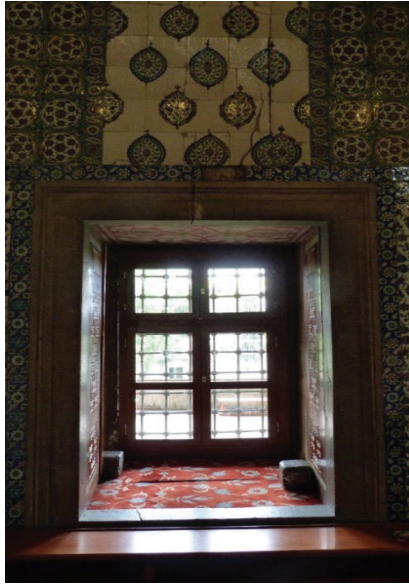
Ek 12: Sultan Ahmed Camii üst mahfel pencere kasaları.