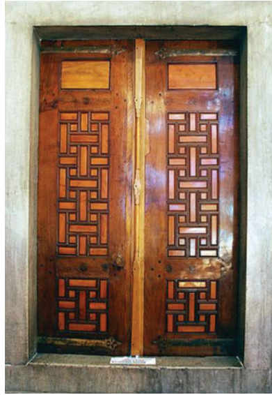
Ek 2: Sağdaki Sultan Ahmed Camii alt kat künde-kârî bir pencerenin kanatları