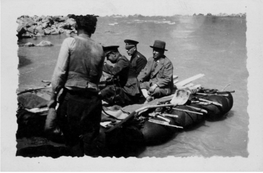
Resim 2: Diyarbakır'da Dicle Nehri üzerinde kelekle yolcu taşımacılığı (İBB Atatürk Kütüphanesi, Krt. 02440)

Kelek, Dicle nehir yolunun Diyarbakır-Musul arasının kayalık bir yapıda ve hızlı bir akıntıya sahip olması nedeniyle ilk çağlardan Osmanlı Devleti'nin tarih sahnesinden çekilmesine kadar nakliye ve ulaşımda kullanılan yegâne nehir taşıtı olmuştur 2 . Kelekle yapılan ulaşım ve nakliyat, kara yoluna oranla daha güvenli, hızlı, rahat ve ucuzdur. Öyle ki Diyarbakır'dan Mardin'e, oradan da Musul'a uzanan eski posta yolu, 19. yüzyılın ikinci yarısında bile aşılması zor geçitlerden ve taşlıklardan oluşmasının yanında aynı zamanda 3 saldırılara da açıktır. Kara yoluyla 20 günde kat edilen bir mesafe, nehir yolunda kelek vasıtasıyla 5-6 günde kat edilebilmektedir 4 . Öte yandan 19. yüzyılın sonu ile 20. yüzyılın başlarında, kelekle yapılan nakliyat, Musul'a deve ile yapılan nakliye ve taşıma ücretlerinin yarısına, katırla yapılanın ise yedide birine denk gelmektedir 5 .