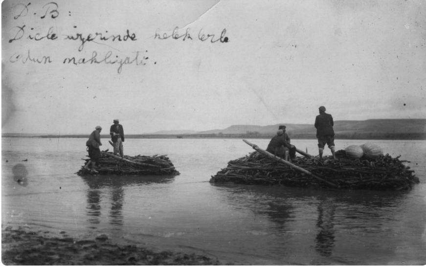
Resim 4: Dicle üzerinde hattâb (oduncu) kelekçileri gösteren bir fotoğraf

kelekçilerden de bahsedilir. Bu kelekçiler nehir yolunun rehberi olup bu anlamda uzman kişilerdir. Evliya Çelebi, Dicle Nehri'nde kelek süren kelekçileri zira anlar mellahân-ı Şatt u Furat'tır. Bu nehrey-ni azimeynin kuşe be kuşe umkunu resâyini ve kurb u bu'dunu cümle karât be-karât bilirler. ifadeleriyle tanımlamaktadır 60 . Bu kelekçiler, nehir yolunun en tehlikeli kısımlarında kelekleri ustaca ve hiçbir zayıata meydan vermeden geçirmeleriyle kayıtlara yansımışlardır. Bazıları da kelekle taşıdıkları yolculara nehir yolunun coğrafyası ve kimi konular hakkında hikâyeler anlatan kişiler olarak kayıtlara konu olmuşlardır 61 . Bu kayıtlardan hareketle, mübalağaya kaçmadan bu kelekçilerin iyi birer anlatı ustası olduğunu söylemek mümkündür.