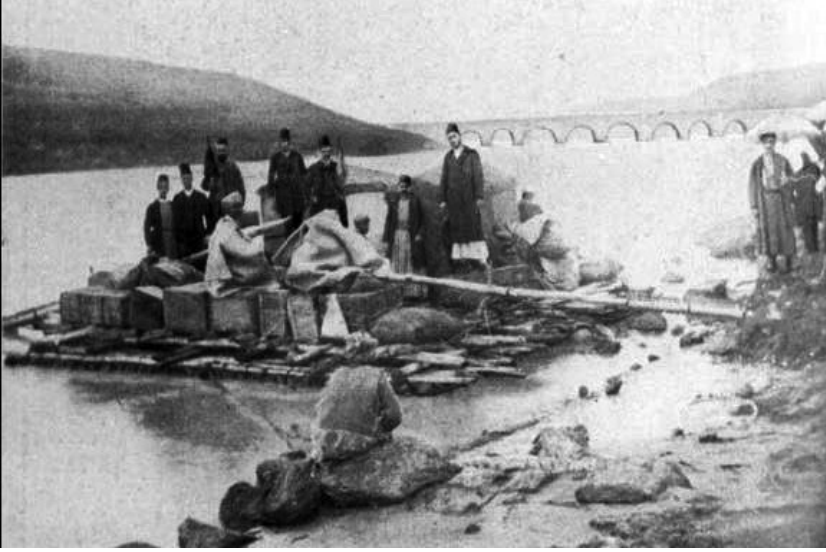
Resim 3: Dicle Nehri'ne açılan kelekçileri gösteren bir fotoğraf

1746'da açtığı davada söz konusu kişilerin eski vali Abdullah Paşa'ya kendisini şikâyet ederek lonca şeyhliğini bir başkasına vermek için vali üzerinden kendisine 514 kuruş ceza verdirdiğini iddia etmiştir 51 . Kayıtlara yansıyan bu örnekte kuyumcular loncasında gayrimüslim üyelerle yöneticiliği yürüten Müslüman şeyh arasında bir sorun olduğu ve bu sorundan kaynaklı olarak gayrimüslimlerin şeyhi değiştirmeye teşebbüs ettikleri anlaşılmaktadır.