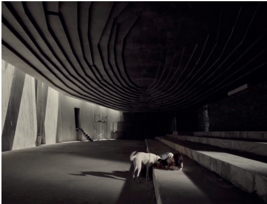
Görsel 5: Sine'nin tasarladığını düşündüğü camide bulunuşu (Zaim, Rüya, 2016)

Rüya, somut ve soyut arasında bulunan bir durumdan oluşmaktadır. Rüyası durumlar ne gerçeği ne de gerçek dışını simgelemektedir. Simgeleme, temsil etme ve hoş görülmeyen ifadeler arasında bir ihtimal dışı durum alanında bulunmaktadır (Botz-Bornstein, 2011, pp. 12). Rüya filminde bunun bir örneği olarak Sine karakteri kendi tasarladığı ve yapmanın hayalini kurduğu cami projesini rüyalarında görür ve bu rüyalarda bu caminin içinde yer almaktadır. Dışlandığı ve suçlandığı zamanlarda kendi sığınağı olarak bu mekânı ve uykuya yattığı deşarj odasını kullanır. Kendi gönüllü kapatılmasını bu mekânlarda gerçekleştirir. Filmde bu sahnenin geçtiği görsel aşağıda yer almaktadır.