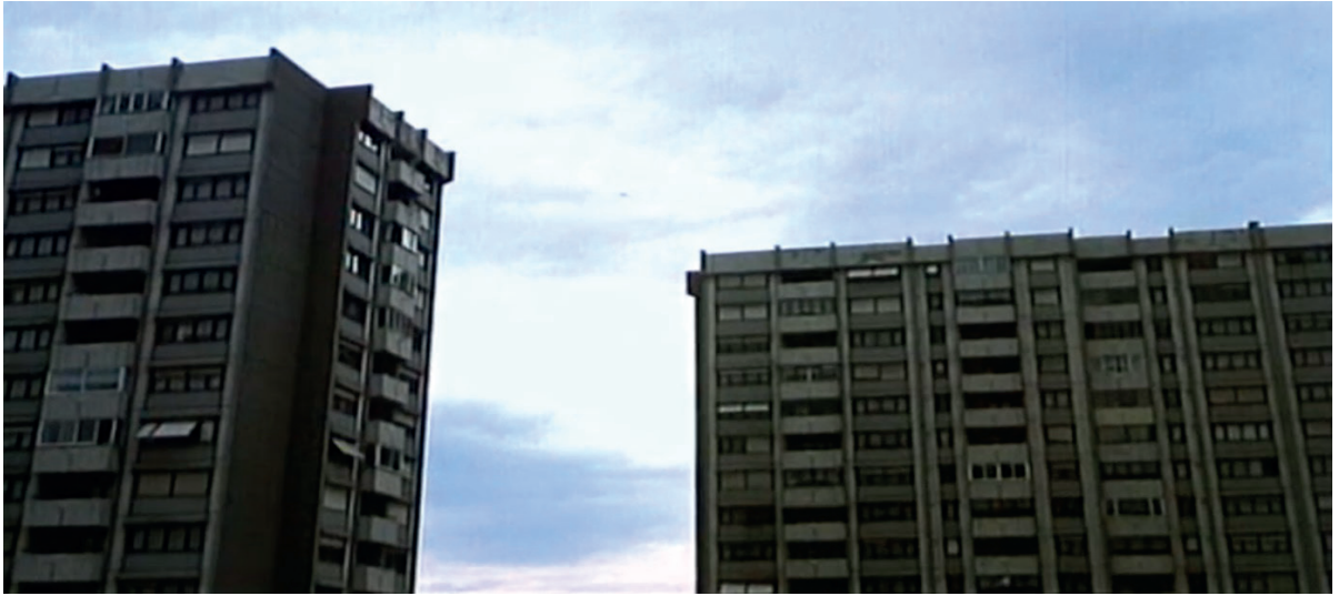
Görsel 3: Filmdeki bloklardan bir kare (Demirkubuz, C Blok, 1994)

Modernizmin eleştiriyeye açık bir kapı bıraktığı alan mimaridir. İnşa edilen sosyal konutlarda yaşayacak insanların buradaki hayat sürme pratiklerini önemsemeden dikilen bu beton yığınları modernizmin kötü yanlarından biri olarak okunmaktadır. Çalışma bağlamında bu konutların aynı zamanda bir tecrit mekânı olarak düşünülmesi de önerilmektedir. Aynı zamanda yapıların büyüklüğü belki de sistemin, iktidarın bir güç gösterisidir. Kaçınılmaz, yenilemez büyüklüğünü simgelemektedir. Film de bu anlatıyı C Blok'u başrol yaparak vermektedir.