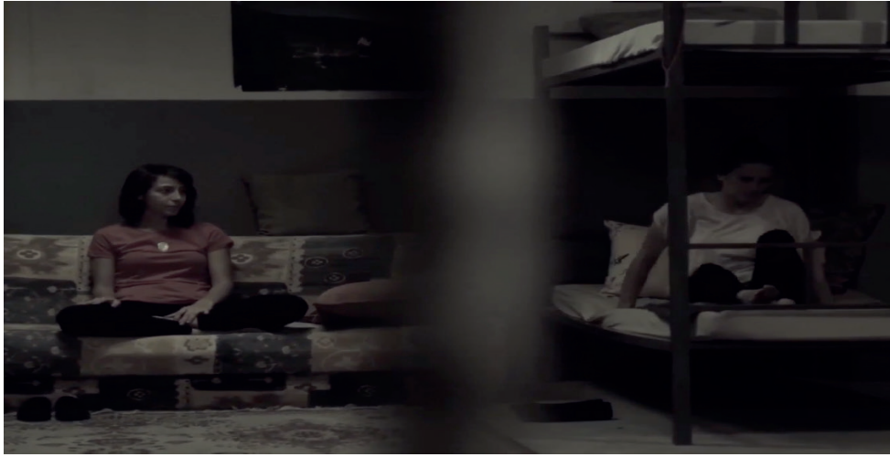
Görsel 6: Sine'nin hapisanede diğer bedeni ile birlikte bulunuşu (Zaim, Rüya, 2016)

Aynı zamanda filmin sonunda yaptığı itiraf ile dört farklı bedeni ve dört farklı suretiyle beraber hapisaneye kapatılmıştır.