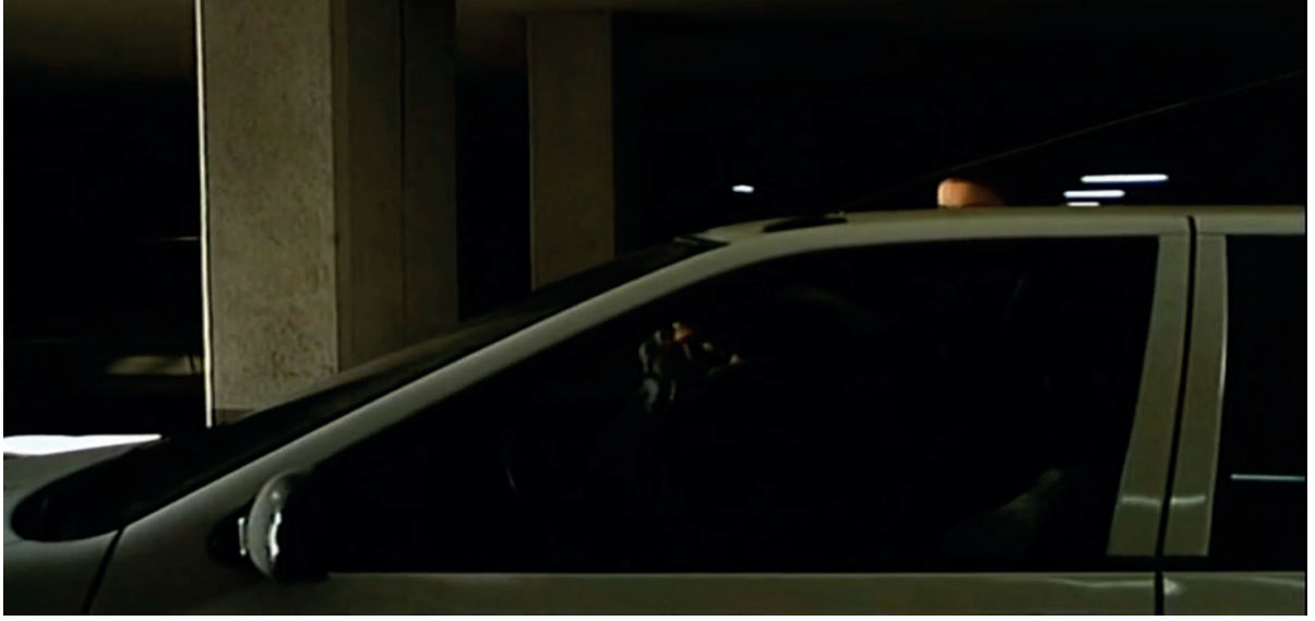
Görsel 2: Halet'in Tülay ile birlikte olmasından sonra arabaya sığındığı sahne (Demirkubuz, C Blok , 1994)

Modernizmin eleştiriyeye açık bir kapı bıraktığı alan mimaridir. İnşa edilen sosyal konutlarda yaşayacak insanların buradaki hayat sürme pratiklerini önemsemeden dikilen bu beton yığınları modernizmin kötü yanlarından biri olarak okunmaktadır. Çalışma bağlamında bu konutların aynı zamanda bir tecrit mekânı olarak düşünülmesi de önerilmektedir. Aynı zamanda yapıların büyüklüğü belki de sistemin, iktidarın bir güç gösterisidir. Kaçınılmaz, yenilemez büyüklüğünü simgelemektedir. Film de bu anlatıyı C Blok'u başrol yaparak vermektedir.