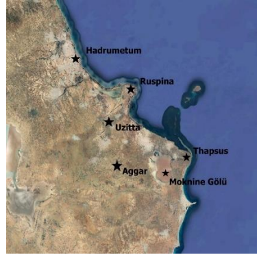
Görsel 2: Thapsus'taki mücadeleyle son bulan Afrika Seferinin belirli aşamalarında ön plana çıkan Kuzey Afrika yerleşimleri. (Görsel yazar tarafından Google Earth Pro kullanılarak hazırlanmıştır. Yerleşimlerin konumları, www.vici.org [Erişim Tarihi: 15.09.2020] platformu kullanılmak suretiyle saptanmıştır.)