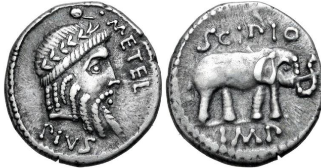
Görsel 3: MÖ 47-46 yıllarına tarihlendirilen ve Caesar karşısında Afrika'da gerçekleştirilen mücadelenin lideri Q. Metellus Pius Scipio'nun ordugâhıyla birlikte hareket eden askeri darphanede basılmış olan sikkeler üzerinde Afrikalı fil figürü.