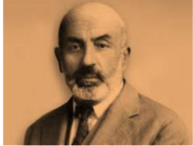
Mehmet Akif Ersoy