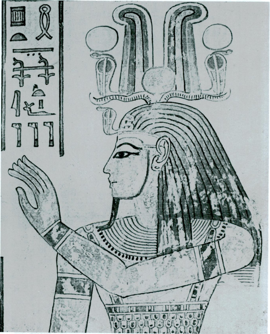
Res. 4 — Yeni İmparatorluk XIX. Hanedanından III. Ramses'in oğlu Amonhepief'in mezarındaki kraliyet tanrısı Ptah'ın alışılmışın dışında görüntüsü. Burada Ptah başının üzerindeki koç boynuzları, tanrı Amon'un iki deve kuşu tüyünden müteşekkil tacı, güneş diski ve kobra yılanları havi büyük bir taçla resmedilerek kraliyet tanrısı olarak gösterilmiştir. O halde tanrıların babası, yaratıcı tanrı olduğu vurgulanmıştır.