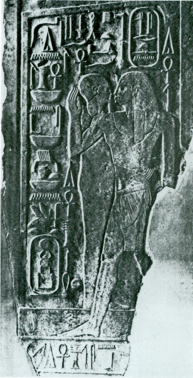
Res. 2 — Orta İmparatorluk devri XII. Hanedandan I. Sezostris (M.Ö. 1970 veya 1936-1928) kraliyetin koruyucusu tanrı Ptah'la birlikte.