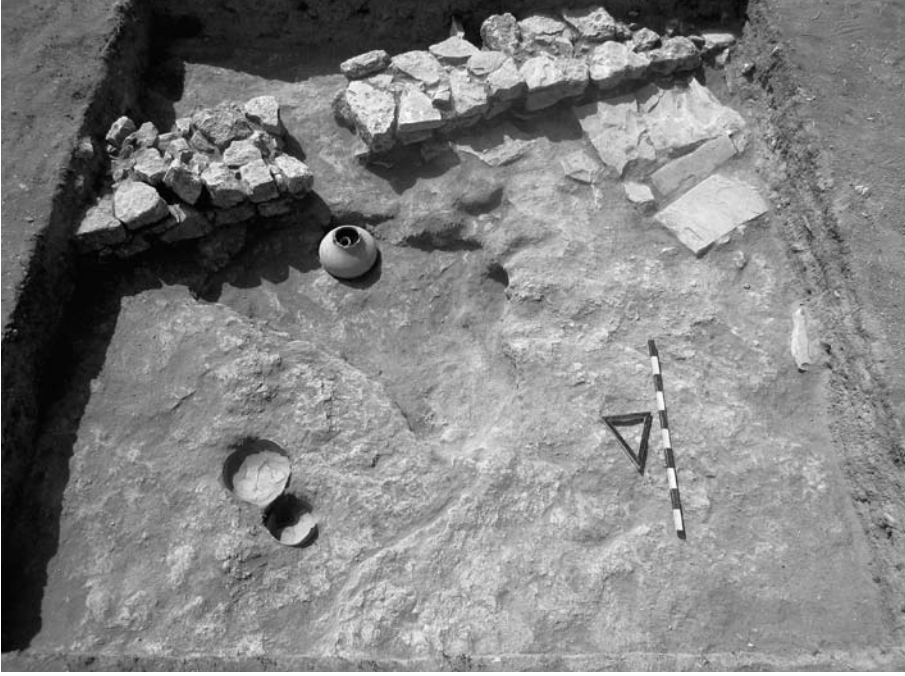
Res. 5 R21 açmasında ana kaya üzerindeki Roma Dönemi duvarı, in situ çanak çömlek ve mezar kapak taşları