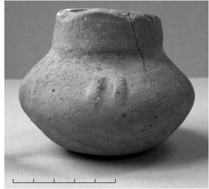
Res. 9 AY 1 açmasında ele geçirilen İTÇ II dönemine ait iki çömlek