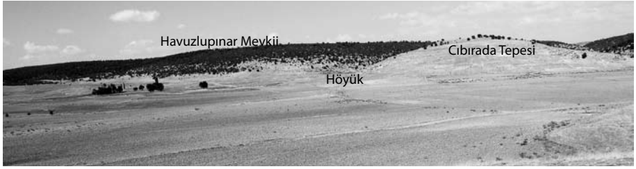
Res. 1 Havuzlupınar Mevkii, Höyük ve Cıbrada Tepesi, kuzeybatıdan