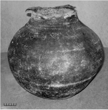
Res. 6 R21 açmasında ele geçirilen kap (bkz. Res. 5)