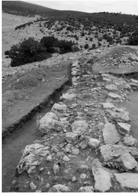
Res. 7 Kalede İTÇ II dönemine tarihlenen sur bedeni ve sura bitişik yapı, güneyden