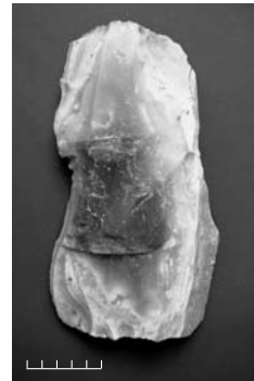
Res. 4 Çift vurma düzlemlı tablasal çekirdek (b 88 açması)