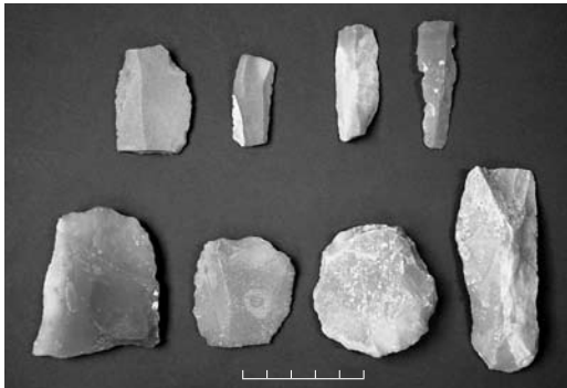
Res. 3 b 88 açmasında ele geçirilen dilgiler ve kazıyıcılardan örnekler