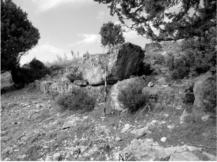
Res. 8 Kalenin güney tarafında büyük taşlardan inşa edilmiş surun dış yüzü