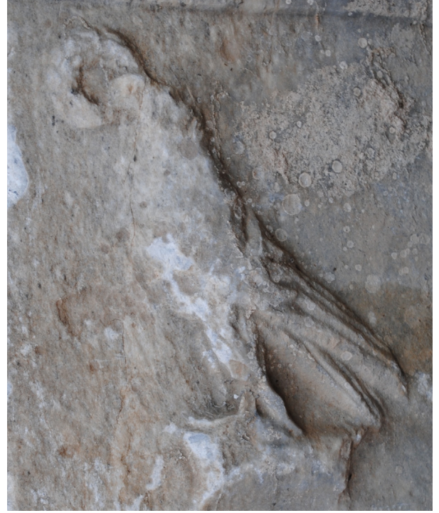
Fig. 8. Apollon altar adağı sağ yan yüzündeki betim detayı.

hangi tanrıya hizmet ettiği bilinmemektedir (Mitchell 1982 II: 49).