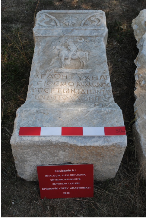
Fig. 2. Apollon altar adağı.