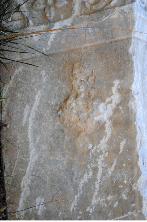
Fig. 6. Apollon altar adağı sol yan yüzündeki betim detayı.

2018a: 106). Bu adakta atlı bir figür dikkat çeker. Ancak yıpranmış olduğu için baş ve gövde detayları belirgin değildir. Bu iki adak yazıtı dışında camii avlusunda bucrania taşıyan bir altarın da bulunduğu gözlemlenmiştir (Güney 2018a: 108). Yine Kayı ile Aydınlar köyü arasındaki Oğuz Pınarı mevkiinde bulunarak Kayı köyüne getirilen iki adak yazıtı da Apollon ve Hosios Dikaios'a adanmıştır (Güney 2018a: 104-106). Bu adaklarda herhangi bir betim bulunmamaktadır. Adaklar imparatorluk kölesi Khryseros ve köy sakinleri tarafından adanmıştır (Güney 2018a: 104-106).