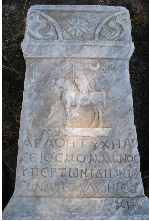
Fig. 3. Apollon altar adağı ön yüzündeki yazıt ve atlı figür betimi.

alınırsa bu figür tanrı Men olmalıdır. 2 Çünkü özellikle Phrygia bölgesinde, tanrı Men'in genellikle omuzlarında bir hilal, bir Phryg başlığı ve yaygın şekilde atlı olarak betimlendiği bilinmektedir (Erten 2018: 210). Yine tanrıya ait semboller olan çam kozalağı, palmiye dalı, uzun asa ve çifte balta da tanrı ile beraber sıklıkla resmedilmiştir (Akyürek-Şahin 2011: 130-132; Lane 1990: 2161-2174). Burada konumuz olan altardaki atlı figürün sağ eli yumruk şeklinde önünde durmaktadır. Sol el ve kolunun pozisyonu ise tahribattan dolayı tam belirgin değildir. Tanrı Men Phrygia'daki betimlerinde genellikle uzun bir tunica ya da khitoniskos giyer. Bu giysiler üzerine ise kısa bir manto (khlamys) giymektedir (Akyürek-Şahin 2011: 131). Burada tanıttığımız Men betiminde üzerinde bir khitoniskos ve arka tarafında muhtemelen onun üzerine giydiği kısa mantonun uç kısmı görülmektedir.