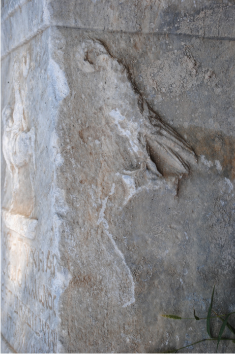
Fig. 7. Apollon altar adağı sağ yan yüzündeki betim.