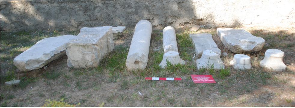
Fig. 4. Apollon altar adağıyla beraber kaçak kazı alanından getirildiği bildirilen eserler.