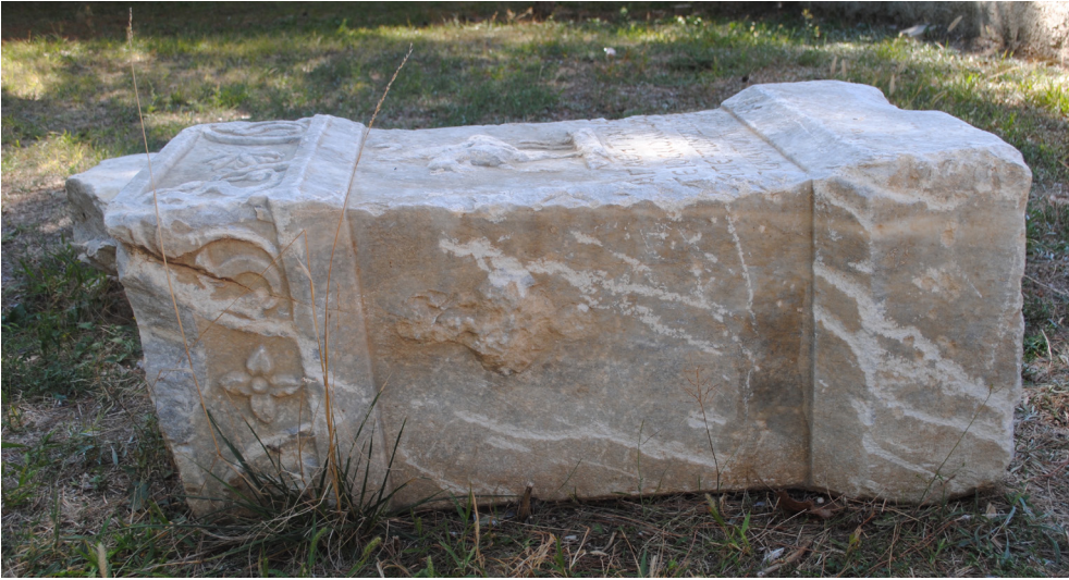
Fig. 5. Apollon altar adağı sol yan yüzündeki betim.

Figür detaylarındaki küçük tahribatlara rağmen büyük ölçüde korunarak gelen altarın ön yüzündeki alınlık kısmında, ortada, altı yapraklı bir rozet ve bu rozetin her iki tarafında sarmaşık yapraklarından süslemeler betimlenmiştir. Altarın sağ ve sol yan yüzlerindeki alınlıklarda ise bu defa dört yapraklı rozetler ve yine her iki taraflarında sarmaşık yapraklı süslemeler yer alır.