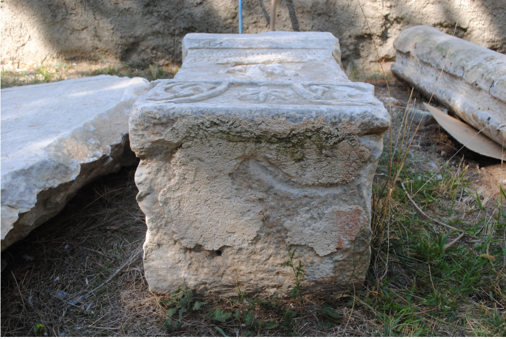
Fig. 9. Apollon altar adađı tepe kısmındaki sıva harcı ve kırmızı boya izleri.