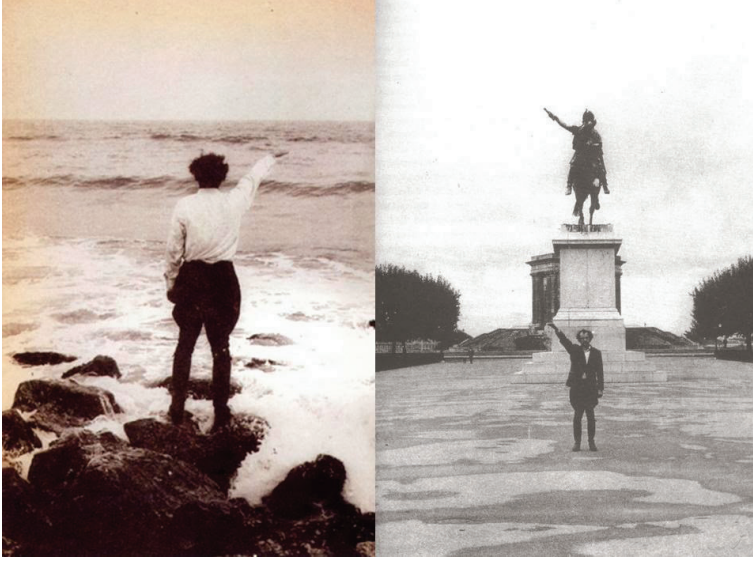
Görsel 2 - Anselm Kiefer, Besetzungen (İşgaller), Fotoğraflar/ 1969 .