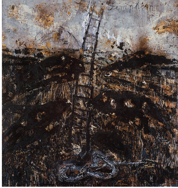
Görsel 4 - Anselm Kiefer, Seraphim, Oil, straw, emulsion, and shellac on canvas, 320.7 × 330.8 cm. / 1983.

belirten sanatçının şu sözleri dikkat çekicidir; “Sanat eseri ve onu izleyen arasında karşılıklı bir hareket vardır. Nehir sanat eserini değiştirir ve eleştiri de ayrıca sanatçıyı değiştirebilir. Su üzerinde yüzen birçok fikir vardır ve bunların hiçbirisi sanat eserini ateşlememiş olabilir. Eğer bir fikir, eleştirmeni tarafından tam olarak iletilmezse ya da eserin kendisi ürünü tam olarak betimleyemezse bunu tanımlamak mümkün değildir.” 26