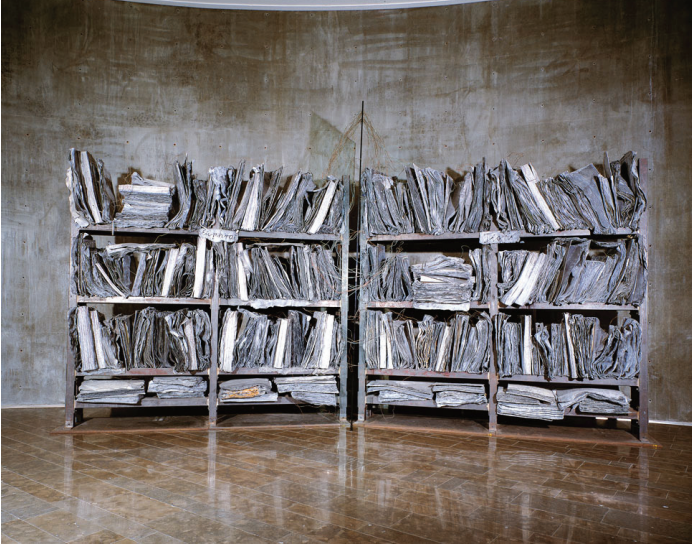
Görsel 6 - Anselm Kiefer, Books and Woodcuts Series / 2001