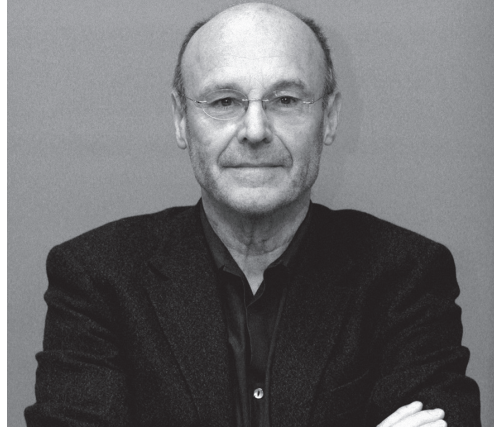
Görsel 1- Anselm Kiefer (1945-..)

Kiefer, II. Dünya savaşı yıllarında, evlerinin bulunduğu sokağın bombalandığı sırada dünyaya gelmiştir. Çocukluk yıllarını beton ve moloz yığınları arasında geçirmiş, modern savaşın sonuçlarını bizzat tecrübe etmiştir. Lise eğitimini tamamladıktan sonra 1965 yılında Freiburg Üniversitesi'nde hukuk ve Latin dilleri edebiyatı bölümlerine başlamış, ancak daha sonra sanat eğitimine yönelmiştir. 1966'da Freiburg'da Peter Dreher ile resim çalışmalarına başlamış, 1969'da Horst Antes'ten eğitim almak için Akademie der Bindenden Künste'a gitmiştir. Bir yıl sonra ise Joseph Beuys'la tanışmıştır. 2