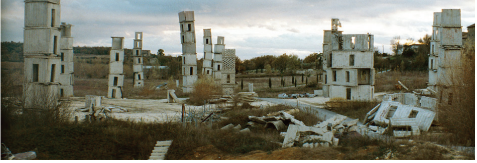
Görsel 5 - Anselm Kiefer Atölye, Barjac/ Fransa

ise “Barış Ödülü”ne değer görülmüştür. “ Sette Palazzi CeleSti ” başlıklı kalıcı enstalasyonu, 2004’den bu yana Milano Hangar Bi-cocca’da sergilenmektedir. Son yıllarda ise uygarlıkların merkezi olan Mezopotamya arkeolojisini, Mısır ve Babil uygarlıklarını incelemektedir. Killi çamurlu toprak, taş surlar ve arkeolojik kalıntılar üzerinden yaşamın anlamını kavramaya çabalamakta olduğunu belirtmiştir. Antik ve modern dünya arasında ayırım gözetmeyen sanatçı, sanatsal uğraşlarında yapıtların hiçbir zaman tamamlanamayacağını dile getirerek şöyle diyor; “Beni sonuca ulaştırmak değil, süreç ilgilendiriyor.” 31