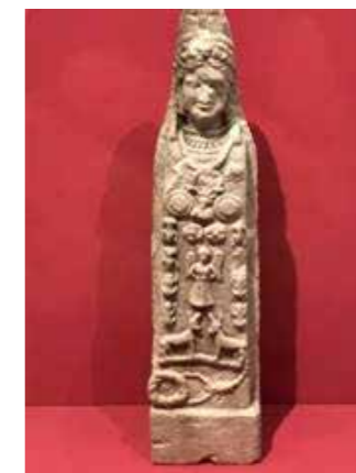
Fig. 13 Fethiye Müzesi'ndeki Artemis Eleuthera heykelciğinin göğsündeki şua taçlı büst için (bkz. Özen - Işık 2017, 86)