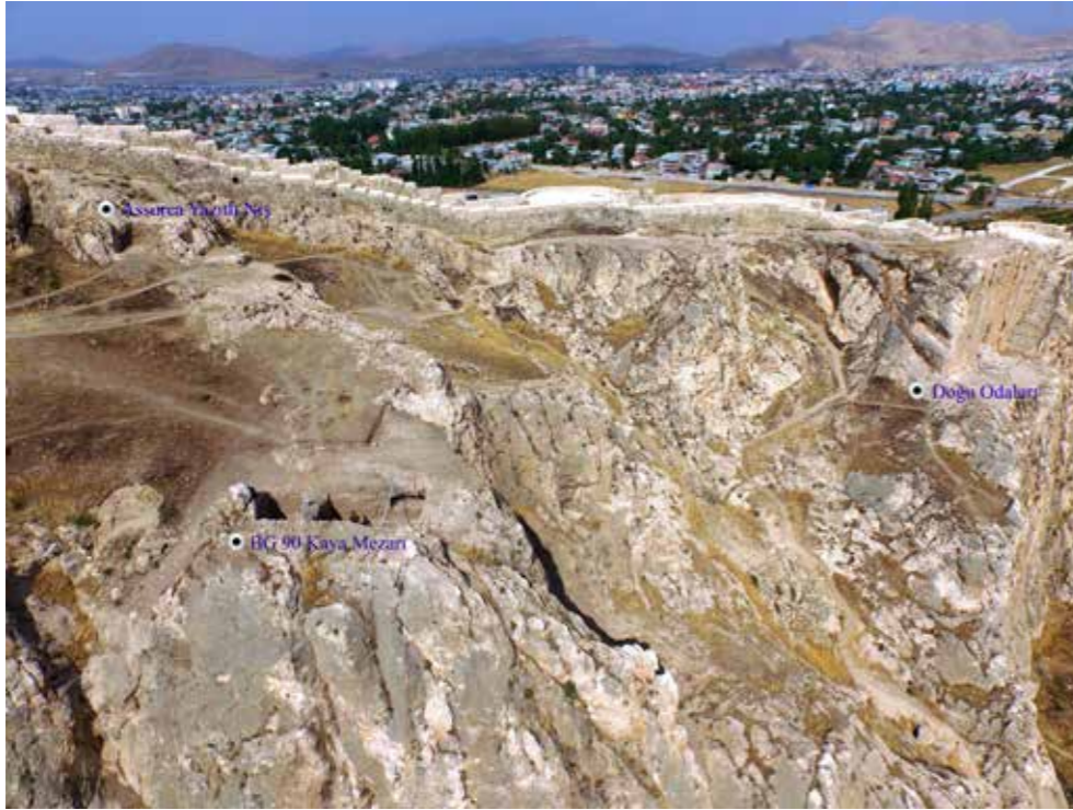
Fig. 1: Kuzeyinde Assurca yazıtlı niş ve doğusunda Doğu Odaları ile birlikte BG 90 Kaya Mezarı'nın konumu