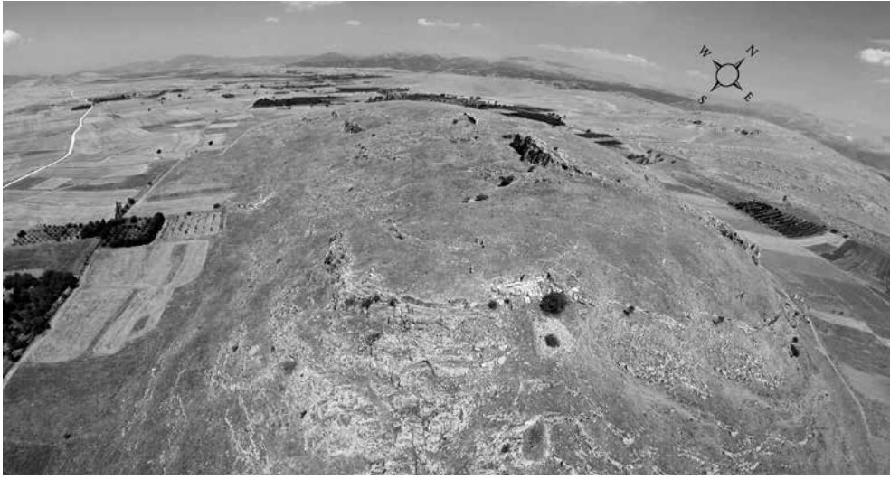
Fig. 4 Seleukeia (Akropolis ve Sur Duvarları, Fotoğraf: U. Hecebil, IAS Arşivi)