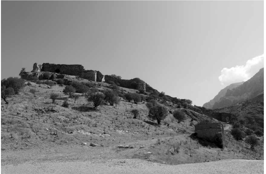
Fig. 3 Apollonia (Uuborlu Kalesi. Fotoğraf: Ç. Çelik, IAS Arşivi)