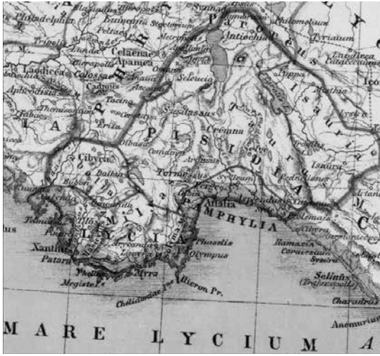
Fig. 1 Pisidia Bölgesinin Konumu (Kiepert 1902-1906)