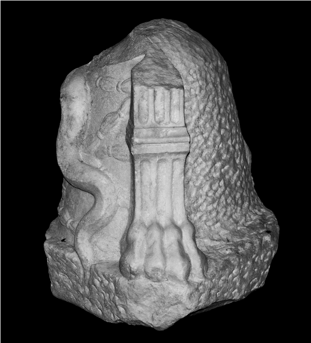
Fig. 2 Mermer Omphalos, Üç Ayak Detayı