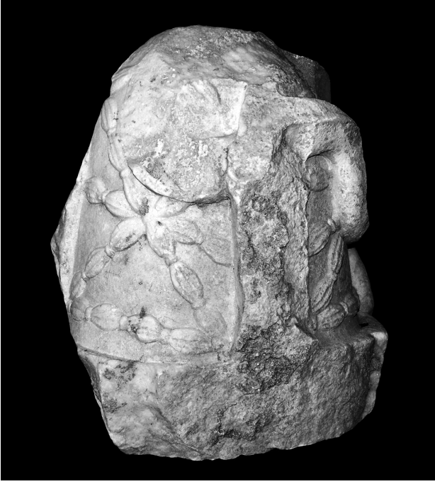
Fig. 3 Mermer Omphalos, Yün Örgü Bezemesi