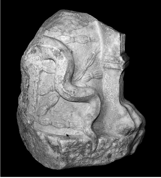
Fig. 1 Mermer Omphalos, Yılan Kabartması