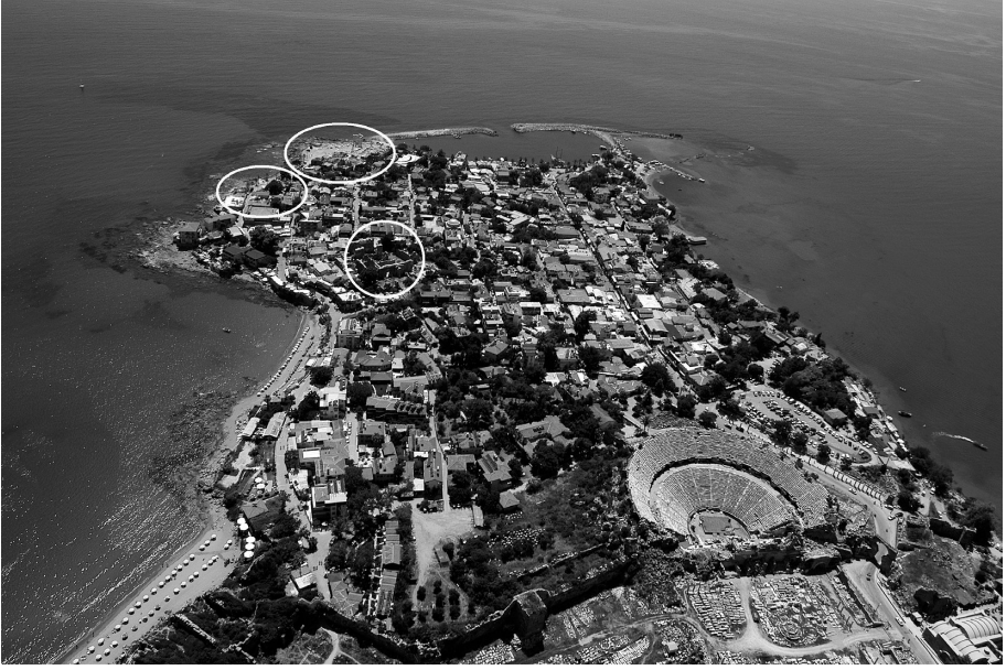
Fig. 5 Apollon Tapınađı, Athena Tapınađı, Yarım Yuvarlak Tapınak ve Büyük Hamam