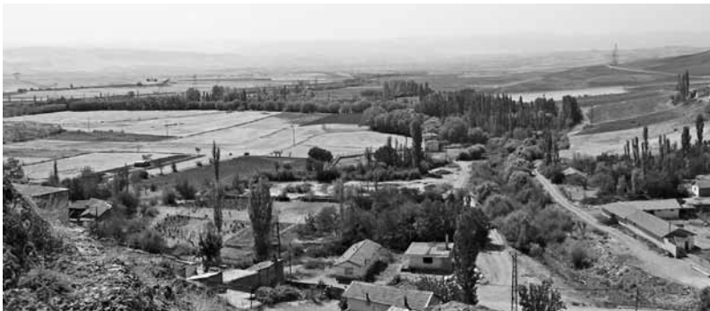
Abb. 3 Aussicht nach Süden von Doğantepe