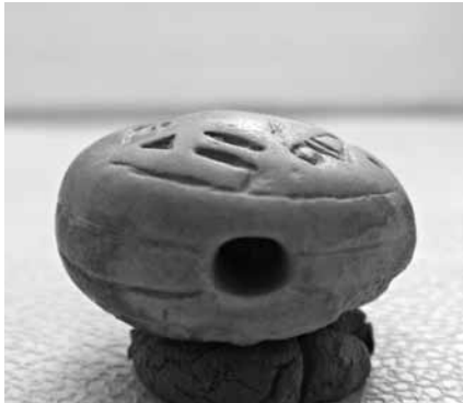
Abb. 6 Seitenansicht des Siegels