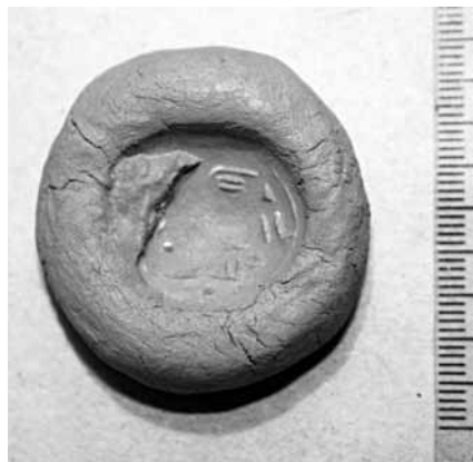
Abb. 8 Zeichnung des Siegelabdrucks (Seite A)