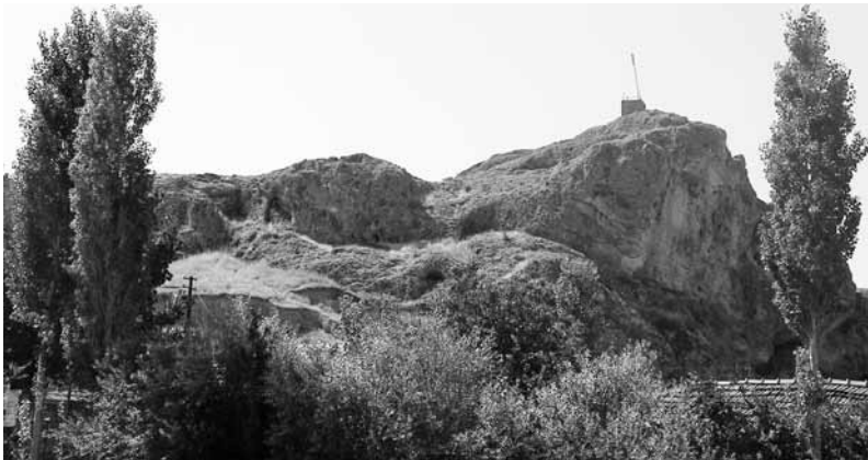
Abb. 2 Doğantepe aus nördlicher Richtung