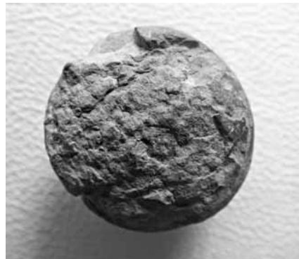
Abb. 7 Seite B des Siegels