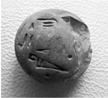
Abb. 4 Seite A des Siegels