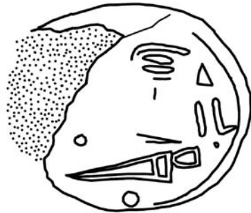
Abb. 5 Abdruck des Siegels (Seite A)