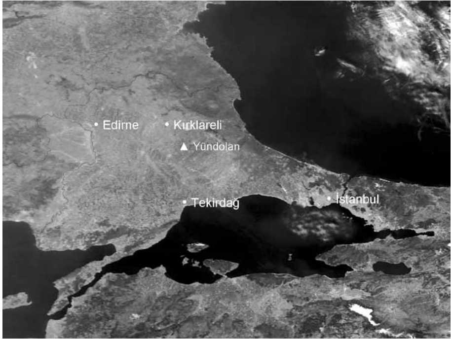
Res. 1 Kırklareli ve Çevresi