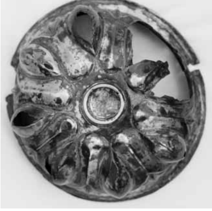
Res. 3 Gümüş Phiale, Yündolan C Tümülüsü