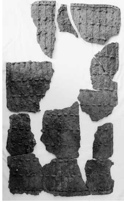
Res. 4 Demir Zırh Parçaları, Yündolan C Tümülüsü