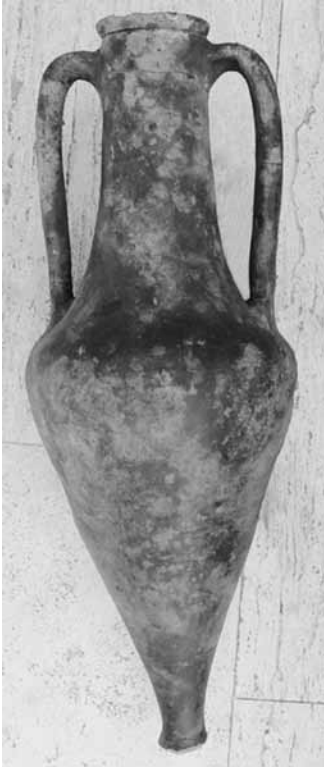
Res. 6 Herakleia Pontika Amphorası, Yündolan C Tümülsü