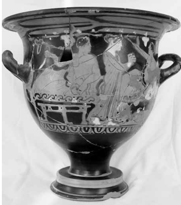
Res. 5 Kırmızı Figürlü Çan Krater, Yündolan C Tümülüsü