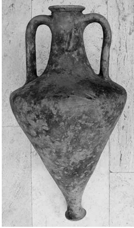
Res. 7 Mende(?) Amphorası, Yündolan C Tümülsü