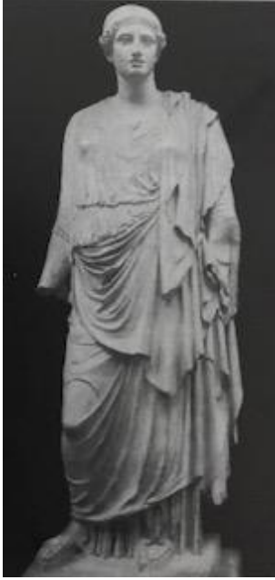
Resim 5: Sappho, Heykel (MÖ 430).