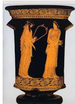
Resim 2: Kalathos, Sappho ile Alkaios (MÖ 480)