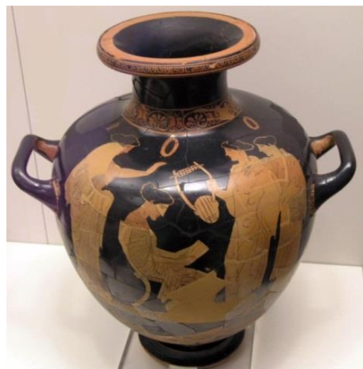
Resim 4: Hydria, Sappho ve Öğrencileri (MÖ 440-430).