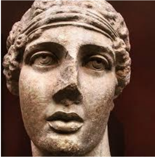
Resim 7: Sappho Heykel Başı (MS 2. Yüzyıl).