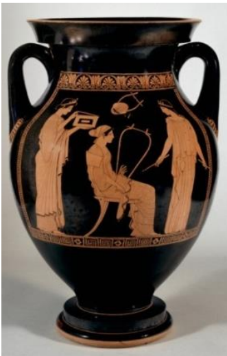
Resim 3: Amphora, Sappho ve Öğrencileri (MÖ 460-450).