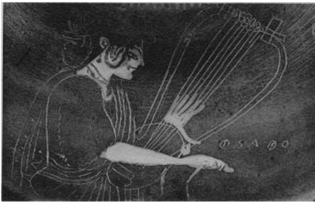
Resim 1: Hydria Ayrıntısı, Sappho (MÖ 510-500).

https://canvas.brown.edu/courses/957917/assignments/5657185