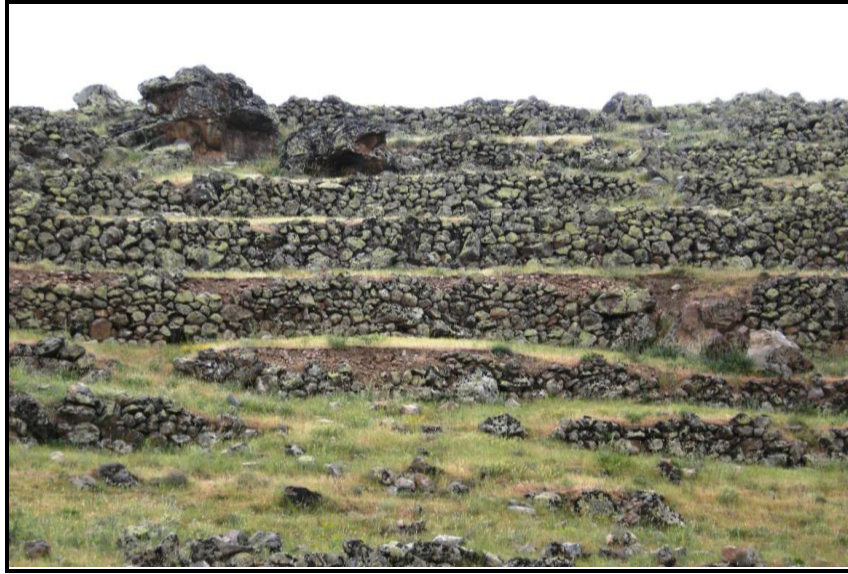
Foto 7. Tarım alanı olarak kullanılan taraçalar

Dikmen Köyü engebeli ve eğimli bir arazi üzerinde kurulmuştur. Bu nedenle tarım yapılabilecek alanları kısıtlıdır. Köyde tarımla uğraşan yaklaşık 30 çiftçi vardır. Bu çiftçilerin arazi büyüklükleri ise, 1 dekarı geçmemektedir. Araziler taşlık ve eğimli olduğu için makine ile tarım yapılamamakta; at ile tarlalar sürülmektedir. Hasat ise, orakla yapılmaktadır. Arazinin eğimli olması sebebi ile yer yer oluşturulan taraçalarda geçimlik düzeyde tahıl tarımı yapılmaktadır (Foto 7).