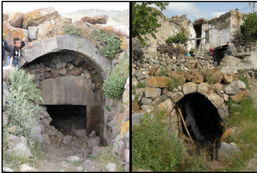
Foto 9-10. Köydeki mağaralardan görünüm

Dikmen Köyü'nün sahip olduğu bir başka turistik potansiyel ise yer altı mağaralarıdır. Daha çok İhlara Vadisi ve Kapadokya Bölgesi'nde görülen yer altı mağaralarından Dikmen Köyü'nde de çok sayıda bulunmaktadır. Bu mağaraların, Hristiyanlığın ilk dönemlerinde barınak olarak kullanıldığı düşünülmektedir. Bazılarının girişindeki işaretler de bunu doğrular niteliktedir. Ancak, köy muhtarı ve yerel halkın bu mağaraların değerinin farkında olmalarına rağmen bu mağaralar turistik ürün olarak kullanılamamaktadır (Fotoğraf 9-10).