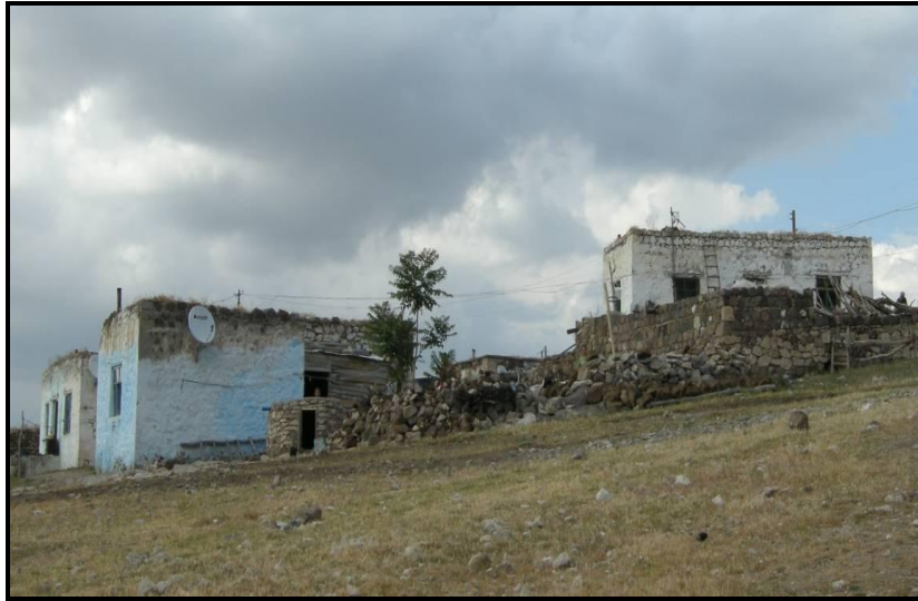
Foto 4. Dikmen Köyü'nün taş evleri

Dikmen Köyü'nde konutların yapı malzemesi olarak yörenin doğal malzemesi olan taş kullanılmaktadır. Konutlar yığma taş metodu ile inşa edilmiş olup, çatısızdır. Evler genellikle iki odalı ve tuvaletleri ev dışındadır (Fotoğraf 4-5).