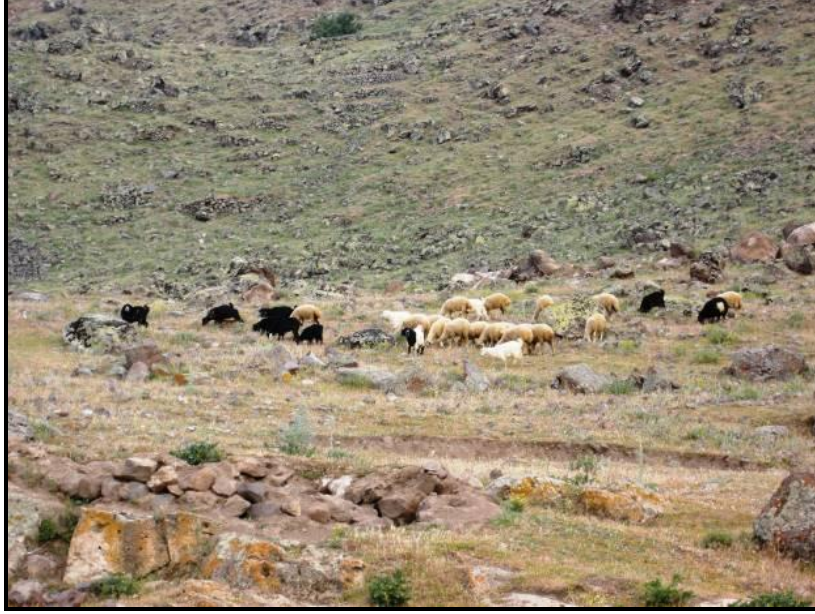
Foto 8. Taşlık alanlarda hayvancılık faaliyetleri

Dikmen Köyü'nün bulunduğu alan sebebi ile önemli gelir kaynaklarından olabilecek arıcılık da köyde denenmiş ancak tam başarıya ulaşılamamıştır. 1995 yılında; İl Özel İdare tarafından aile başına 20 kovan olacak şekilde toplamda 500 kovan arı, düşük kredi ile köylüye satılmıştır. Ancak; köylünün arıcılık konusunda eğitilmiş olmaması sebebi ile arıcılıktan yeterli verimi alamamışlardır ve yıllar içinde kovan sayısı azalmıştır. Bugün sadece 50'şer kovan ile iki kişi arıcılığa devam etmektedir.