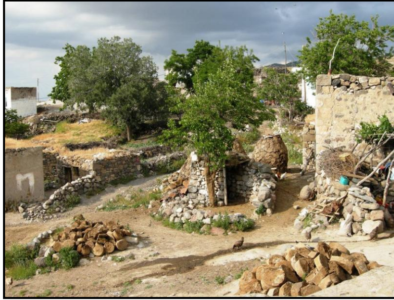
Foto 6. Yakacak olarak kullanılan tezek yığınları

Dikmen Köyü'nde yakacak olarak tezek ile birlikte Hasan Dağı'nın güneydoğu yamaçlarındaki ormanlardan kesilen odunlar kullanılmaktadır (Foto 6). Zaman zaman da devletin kömür yardımı olmaktadır.