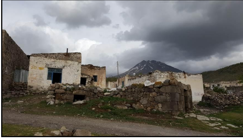
Foto 5. Dikmen Köyü'nde terk edilmiş taş konutlar

Dikmen Köyü'nde yakacak olarak tezek ile birlikte Hasan Dağı'nın güneydoğu yamaçlarındaki ormanlardan kesilen odunlar kullanılmaktadır (Foto 6). Zaman zaman da devletin kömür yardımı olmaktadır.