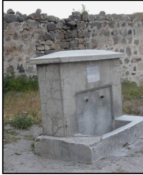
Foto 2. Köy meydanındaki eski çeşme

Dikmen Köyü'nün iki yıl öncesine kadar en önemli alt yapı sorunu su şebekesinin olmamasıdır. Evlere su dağıtımı olmadığı için meydan çeşmesinden taşınan su ile ihtiyaçlar giderilmekteydi (Foto 2).