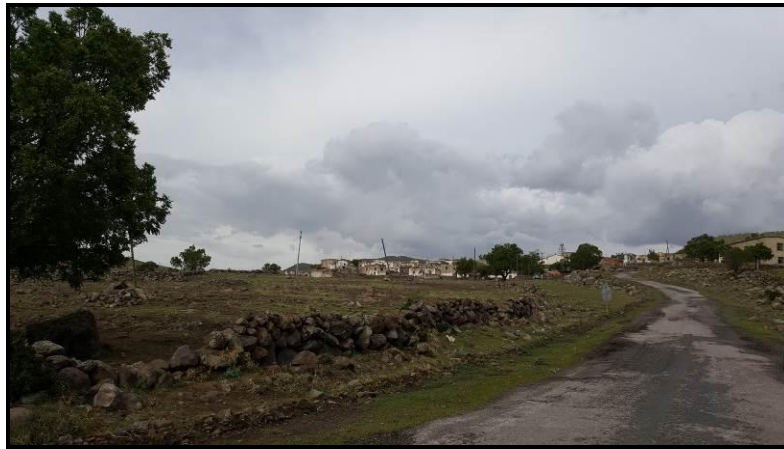
Foto 3. Köye ulaşan yol

Meydan çeşmesine gelen su, köye 15 km uzaklıktaki Helvadere Göleti'nden motorlu pompa ile ulaştırılmaktaydı. Evlere su dağıtan sistem de şu anda aynı şekilde işlemektedir. Bu nedenle, kış aylarında suların donduğu ya da gölde su seviyesinin düştüğü dönemlerde köye su verilememektedir.