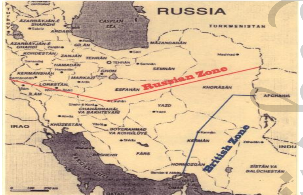
Harita 1: 1907 İngiliz-Rus Antantı'na göre İran'daki Nüfuz Alanları

V. Bu anlaşmanın imza tarihine kadar Banque d'escompte et des Prits de Perse ile Imperial Bank of Persia tarafından belirlenen borç faizinin ve aşınma payının ödenmesinde meydana gelebilecek herhangi bir sorun durumunda, Rusya'nın birinci sırada bahsi geçen bankanın şartları dâhilinde ve ikinci maddede belirtilen bölgelerde kredilerin düzenini garanti eden gelir kaynakları üzerinde kontrol sahibi olması gerekliliği ortaya çıkarsa, ya da Büyük Britanya'nın ikinci sırada bahsi geçen bankanın şartları dâhilinde ve birinci maddede belirtilen bölgelerde kredilerin düzenini garanti eden gelir kaynakları üzerinde kontrol sahibi olması gerekliliği söz konusu olduğunda, Rus ve Britanya Hükümetleri birbirleriyle fikir alışverişinde bulunarak ortak bir çözüm arama yoluna gidecek, kontrol ilkelerini ortaklaşa belirleyecek ve mümkün olduğunca dışarıdan gelen müdahalelerden kaçınarak bu antlaşmanın ilkelerini güvence altına alacaktır.