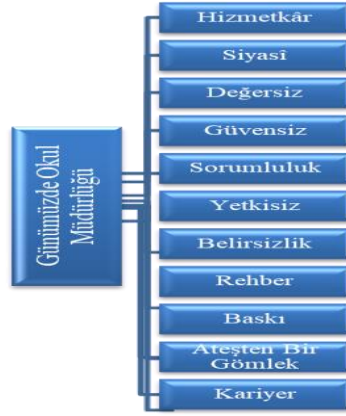
Şekil 2. Günümüzde okul müdürlüğüne ilişkin kavramsal kategoriler

Şekil 2’de görüldüğü gibi, okul müdürlerinin günümüzde “okul müdürlüğü” kavramına yönelik ürettikleri metaforlar 11 kavramsal kategori altında toplanmıştır. Bu kavramsal kategorilerin ve metaforların genellikle olumsuz olduğu dikkat çekmektedir. Katılımcıların kavramsal kategoriler altında üretmiş oldukları metafor örnekleri aşağıda sunulmuştur.