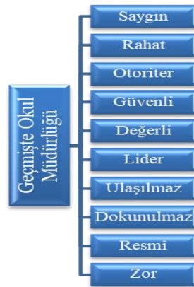
Şekil 1. Geçmişteki okul müdürlüğüne ilişkin kavramsal kategoriler

Tablo 2’de görüldüğü gibi, okul müdürleri “okul müdürlüğü” ile ilgili olarak geçmişteki algılamalarına bağlı olarak 10 kavramsal kategori altında 53 geçerli metafor üretmiştir. Bu kavramsal kategoriler, üretilen metafor sayısına göre sırasıyla “saygın, rahat, otoriter, güvenli, değerli, lider, ulaşılmaz, dokunulmaz, resmî ve zor” olarak belirlenmiştir. Aynı metaforu birden fazla katılımcının ifade ettiği, bazı katılımcıların ise birden fazla metafor ürettikleri görülmektedir. Görüldüğü gibi, “saygın” kategorisinde daha fazla metafor üretilmiştir. Okul müdürlerinin geçmişteki okul müdürlüğüne ilişkin ürettiği metaforların sıralaması Şekil 1’de sunulmuştur.