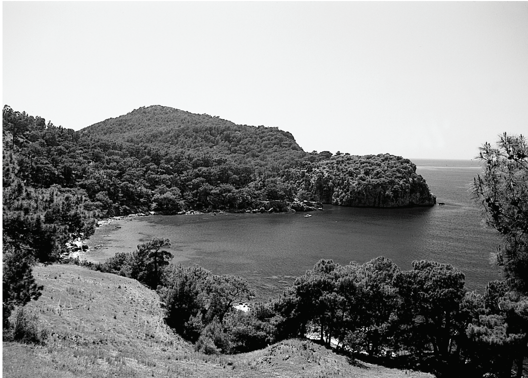
Abb. 1: Karaöz Limanı mit dem Wohnhügel Melanippē