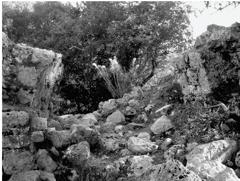
Abb. 3: Melanippē, Tordurchlaß der Ostmauer