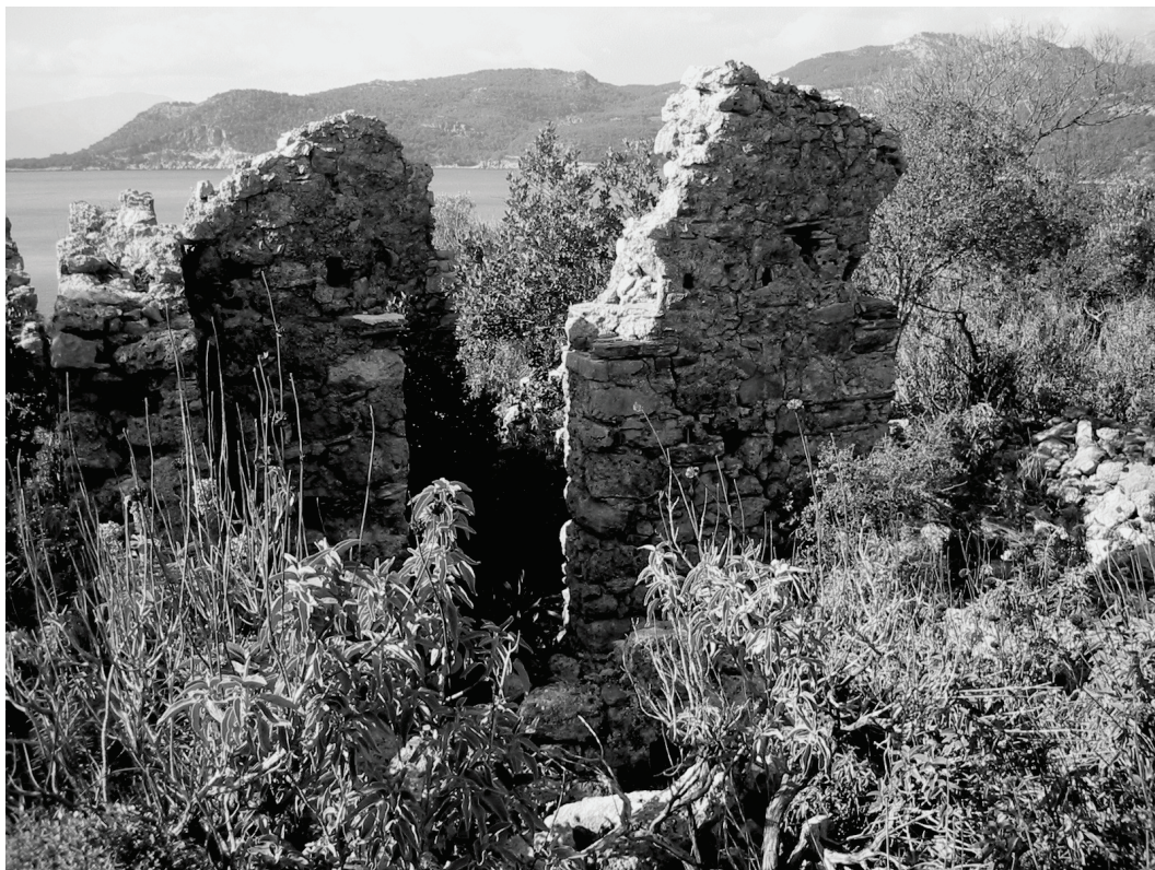
Abb. 2: Melanippē, Wohnbauten