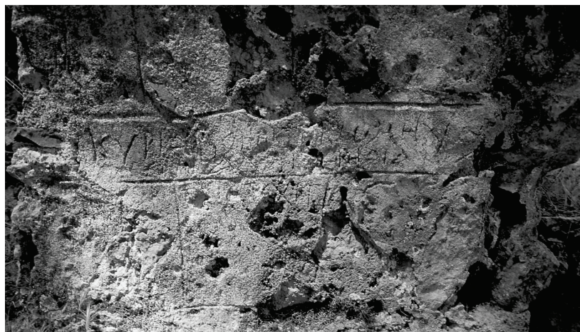
Abb. 4: Melanippē, frühbyzantinische Ritzinschrift