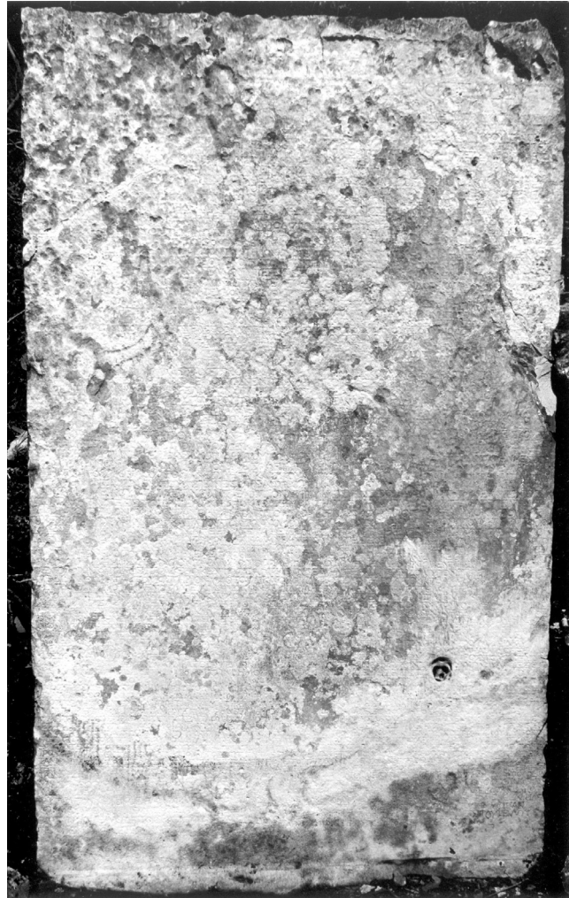
Abb. 2: Der Schrifträger

weitere Steinkopie des Zollgesetzes, dessen Geltungsbereich das vom lykischen Koinon kontrollierte Gebiet war, dürfte sich zumindest in Patara, der Hauptstadt der Provinz Lycia, 4 befinden haben, bei dessen Hafen sich ein weiteres Granarium 5 befand.