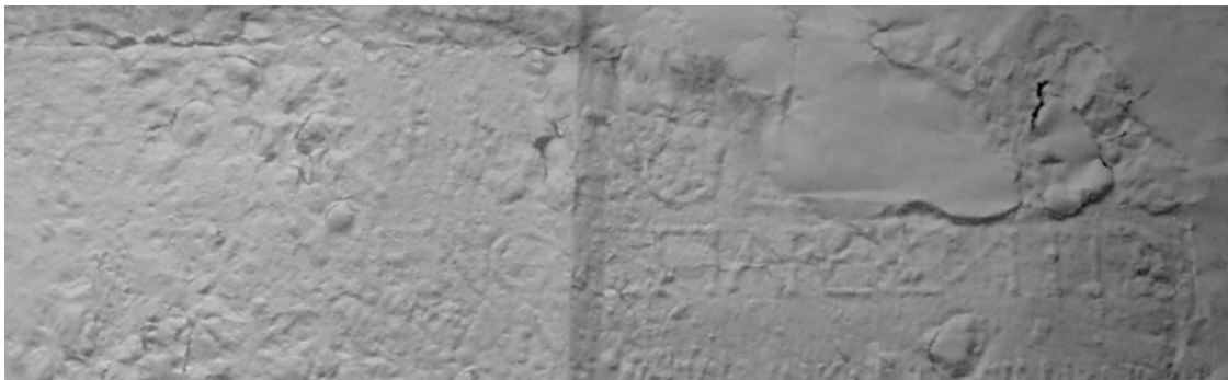
Abb. 3: Ausschnitt aus dem Präskript (Zeile 1–3)

Die zeitliche Einordnung des Dokuments ergibt sich aus dem teilweise lesbaren Präskript, das in Zeile 1 Claudius (Nero) und in Zeile 3 C. Licinius Mucianus nennt, der aus anderen Zeugnissen als lykischer Statthalter bekannt ist. 6 Es muss sich bei diesen Zeilen um das Präskript handeln, da sie unmittelbar unter dem oberen Profil stehen und zudem durch größere Schrift (4,5–4,0 cm) von den restlichen Zeilen, in denen die Buchstabenhöhe 1,5 cm beträgt, hervorgehoben sind. Dass mit Claudius nur Nero gemeint sein kann, wird zudem durch Zeile 71 bestätigt, wo das cognomen des Kaisers vollständig erhalten ist: ὡς ὁ Σεβαστὸς Νέρων διατέτακται. Darüber hinaus enthält der Text eine Reihe von Bestimmungen zum Schutz der Emporoi und Naukleroi , die beinahe wörtlich mit dem von Tacitus (Ann. 13, 51) zum Jahr 58 überlieferten Reformedikt Neros, auf das unten noch näher einzugehen ist, übereinstimmen. Hier wird also die Datierung des Zollgesetzes in die mittelneronische Zeit durch die literarische Überlieferung gestützt.