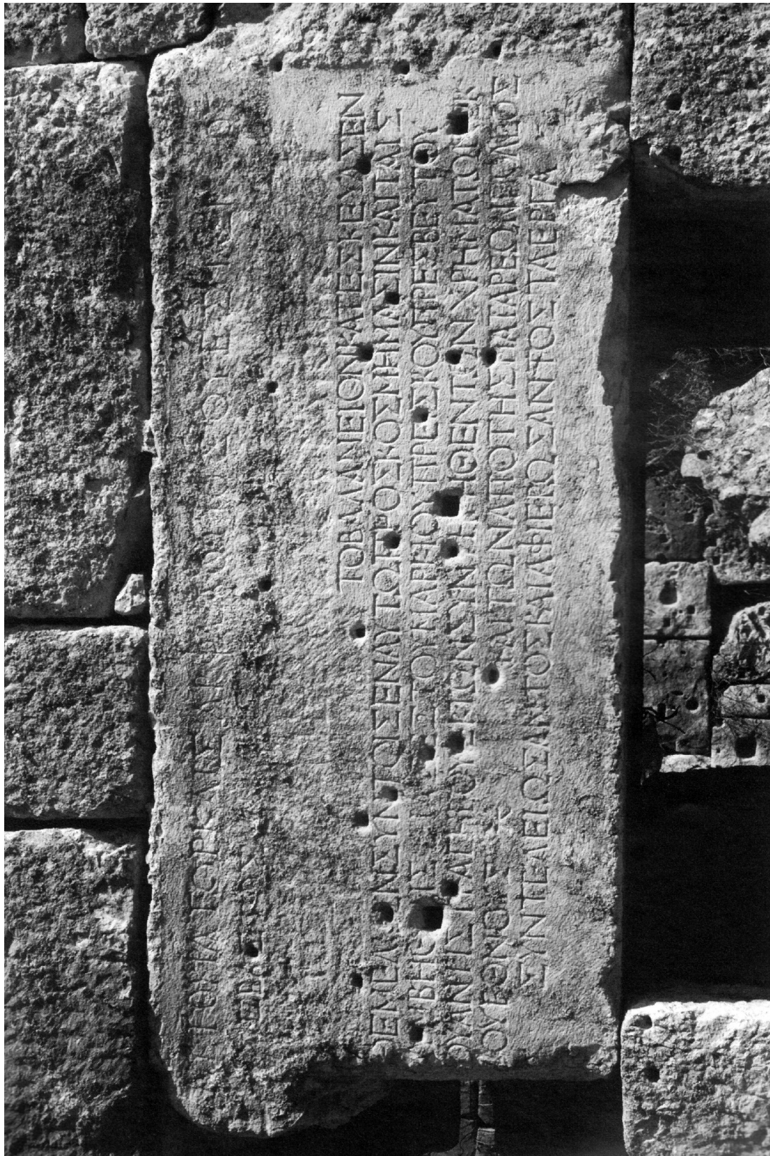
Abb. 2: Schriftträger der Bauinschrift der Therme in Patara (ZPE 166, 2008, 274).