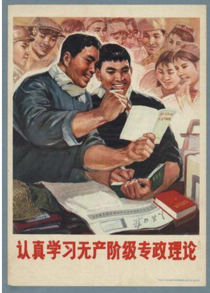
Poster 6. Altıncı Poster (IISH, 2021f)

Altıncı poster, Li Naizhou tarafından 1976 yılında hazırlanmıştır. Duygusal işlev açısından ele alındığında posterde iki erkeğin bir masanın önünde olduğu yansıtılmaktadır. Masanın etrafındaki her iki erkeğin de elinde kitap bulunmakta, erkeklerden biri elindeki kitapta bir yeri işaret etmektedir. Masanın üstünde de başka bir kitap bulunmaktadır. Posterin arka planında da tebessüm eden ve iki erkeğin elindeki kitaba bakan başka insanlara yer verilmektedir. Posterde “Proletarya diktatörlüğü teorisini ciddiyetle inceleyin” yazısı bulunmaktadır.