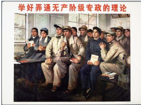
Poster 3. Üçüncü Poster (IISH, 2021c)

Üçüncü poster, 1975 yılında Lu Juding tarafından hazırlanmıştır. Duygusal işlev boyutunda incelendiğinde posterde işçi tulumları içerisinde bir grup insanın bir odada ya da bir salonda olduğu yansıtılmaktadır. Posterde yer alan kişilerin etrafında kitaplar bulunmakta, bazıları da ellerinde kitaplar tutmaktadır. Posterdeki kişilerin çoğu benzer yöne bakmakta ve bir şeyi izlediklerine yönelik algı oluşturulmaktadır. Posterde “Proletarya diktatörlüğü teorisine hâkim olmayı öğrenin” yazısına yer verilmektedir.