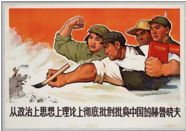
Poster 1. Birinci Poster (IISH, 2021a)

Birinci poster, 1967 yılında hazırlanmış fakat kim tarafından hazırlandığına yönelik bilgiye yer verilmemiştir. Duygusal işlev boyutunda incelendiğinde posterde biri kadın dört kişiye yer verilmektedir. Posterde yer alan kadın ve bir erkeğin üzerinde ÇHC'nin silahlı kuvvetleri olan Çin Halk Kurtuluş Ordusu'na ait üniforma bulunmakta, diğer erkeklerden birinin üzerinde işçi tulumu diğerinin başında ise hasır şapkanın olduğu görülmektedir. Posterin solunda ise yıkık, küçük bir kale burcunun üstünden bir elin sarkmakta ve etrafa kâğıtlar dağılmaktadır. Posterdeki dört kişi, burçtaki kişiyi hedef almaktadır. Asker üniforması içerisindeki kişinin yanında kırmızı bir kitap, işçi tulumu içerisindeki kişinin de bir elinde kırmızı kitap, diğer elinde ise fırça bulunmaktadır. Asker üniforması içerisindeki kadın ise sağ elini yumruk yaparak havaya kaldırmaktadır. Posterde "Çinli, Kruşçev'i siyasi, ideolojik ve teorik açıdan tamamen eleştirir" yazısı bulunmaktadır.