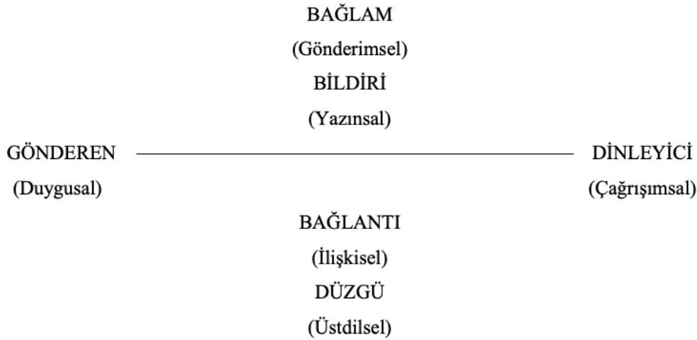
Şekil 1. Jakobson'un Modeli (1980, s. 81)

Jakobson'a (1980, s. 81) göre dil tüm işlevleri ile incelenmelidir. Bu işlevlerin ana hatları, herhangi bir konuşma olayında veya herhangi bir iletişim eyleminde görülebilmektedir. Jakobson'un iletişim modelinde altı sözlü iletişim etkeni (gönderen, bağlam, dinleyici, bildiri, bağlantı ve düzgü) bulunmaktadır. Konuşucu (verici/gönderen) olan dinleyiciye (alıcı/gönderilen) belirli bir koddan (kurallar bütününden) faydalanarak belirli bir bağlamda (dış gerçek/dil dışı bağlam) ve bağlantıyı sağlayan bir kanal (fiziksel destek) vasıtasıyla karşılıklı veya tek yönlü bir bildiri (ileti/mesaj) göndermektedir. Bu altı iletişim etkeni doğrultusunda ortaya çıkan altı temel işlevi (duygusal, gönderimsel, çağrışımsal, yazınsal, ilişkisel ve üstdilsel) bulunmaktadır.