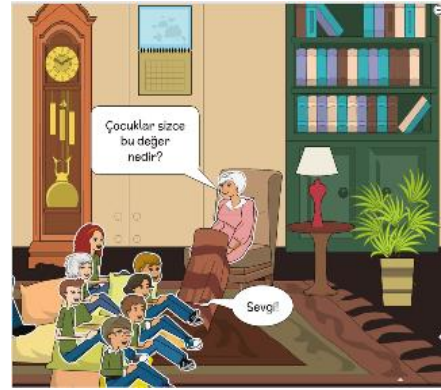
Görsel 8. ve 9.

Yine okuyucuya yakın gelmesi adına çizgi romanda yer alan karakterlerden birisi Sevgi Nine'dir. Bu karakterin labirent gezisinin sonunda öğrencilerle karşılaşarak onlara kısa bir öykü anlatması ve öykünün sonunda sormuş olduğu soruya verilen yanıtla beraber gizemli labirentin çıkış kapısının açılması ile gezi sona ermektedir. Ayrıca buradaki ve birkaç sahnede ki yansıma sesleri karelerde yer almıştır. Bu sayede karelerde yer alan kuş sesi, su sesi gibi efektler okuyuculara baloncuklar dışında da çizgi roman içerisinde bulunabileceğini göstermektedir.