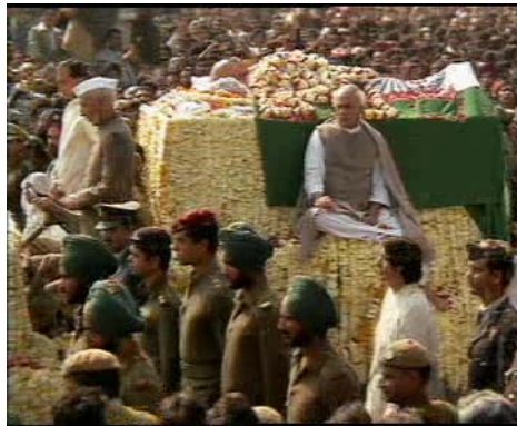
Resimler 7, 8. Cenaze Töreni'nin Filmin Başlangıçta Verilmesi İle Karizma Oluşturulması