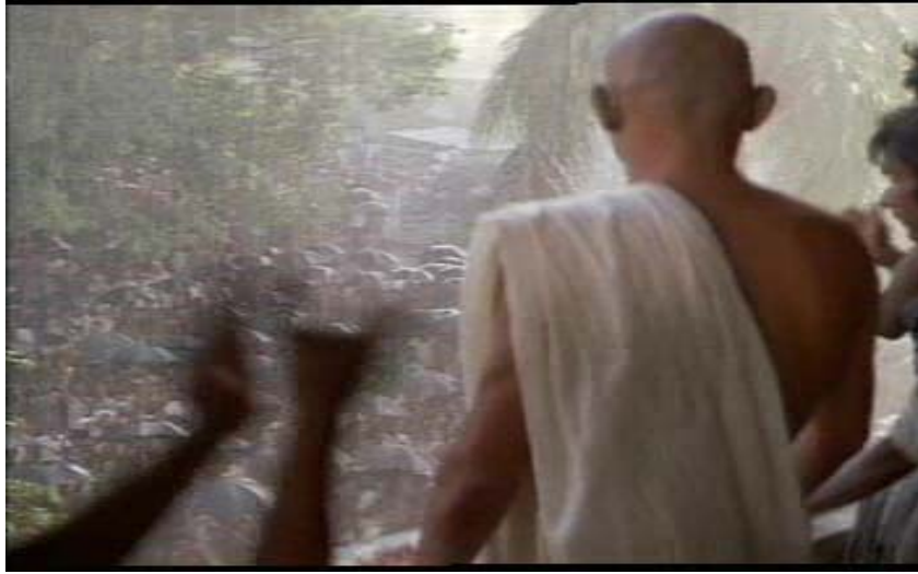
Resim 16. Kitle-Lider Özdeşleşmesi: Mahkeme Sonrası Yağmur Altında Gandhi'yi Bekleyen İnsanlar

ilginin giderek artmasının gösterildiği sahne) arka plan yansıtırken konuşmanın başlarında kişilerin ilgisizliği ve daha sonra bu ilgide meydana gelen olumlu artış yansıtılırken, insanların gözlerindeki ışıltı az da olsa yansıtılabilmektedir. Konuşma kısadır, Gandhi'ye has sakinlik üslubunun temelidir ve sadece işaret parmağını vücut dili olarak kullanması ile Gandhi, kitlenin tüm dikkatini sözlerine çeker. Diğer önemli bir husus ise giymiş olduğu kıyafetidir. Görüntüsünde bir ciddiyet vardır. Elbisesi ile bu ahengi tamamlar. Bu sahnedeki kıyafeti önemlidir, çünkü karşısında kendi kültürünü yansıtan bir kişiyi gören topluluk Gandhi'ye daha yakın bir ilgi gösterir. Filmin bir başka sahnesinde Hıristiyan rahip ile konuşurken, “Eğer onlarla beraber olmak istiyorsam, onlar gibi yaşamalıyım” (CD II, 9:53) demesiyle netleşen kitleyle özdeşleşme yaklaşımı burada ve daha sonraları iyice öne çıkar. Bu içten, ülkesinin belki de en fakir bir üyesi gibi yaşamaya çalışması topluluklara hitap ettiğinde etkili olmasının ana sebebidir. Bir fakir gibi yaşamayı tercih ettiğinden, hücrelerde ya da hapisanelerde dört duvar arasında kalmaktan asla korkmaz (CD II, 10:07). Retorik gücü ve hitabeti onu kısa sürede karizmatik lider pozisyonuna taşıdığından, ilk mahkemesinden sonra Gandhi'yi binlerce insan yağmur altında beklemektedir. Bu dokunaklı dramatik sahnede lider-kitle özdeşleşmesi onun yarı çıplak bedenine kıyafet olarak aldığı sade bir beyaz şalla ifade edilir (resim 16: CD II, 14:04).