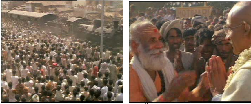
Resimler 14,15. Kitlenin Krizi Çözmek Üzere Davet Ettikleri Gandî'yi Kucaklaması

Ayrıca anadilini, Hindistan Bölgesinde konuşulan lehçelerin çoğunu ve birkaç yabancı dili akıcı ve etkili bir tarzda kullanıyor olması muhataplarının onun sorularına kısa bir süre içinde cevap vermesini zorlaştırmaktadır. Beyaz olmayan bir avukatın Güney Afrika topraklarında barınamayacağını söyleyen tren görevlilerine karşı o her zaman koruduğu duruşundaki sakinlik gibi ses tonunu değiştirmeden tepkisini büyük bir olgunlukla göstermiş olsa da o bunun karşılığını trenden atılmakla ödemiştir. Ürünlerini satamadıkları için aç kalma tehlikesi ile karşı karşıya olduklarını söyleyen yaşlı Hintlinin yardım çağrısı üzerine Gandî'nin harekete geçmesi, tipik bir kriz, ve kitlenin liderden yardım istemesi sahnesidir. Bu sahneler içinde özellikle istasyon sahnesi ile kitlenin liderle bütünleşmesi göz önüne serilmektedir (resimler 14,15: CD II, 04-31,06-07).