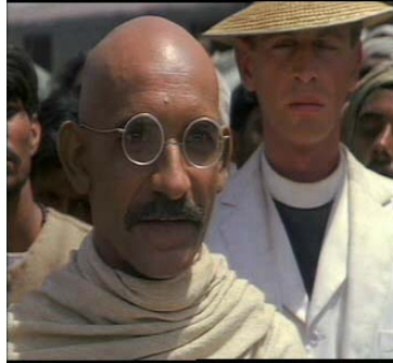
Resimler 4, 5, 6. Gandhi : Kitlenin İçinde Daima Kitleyle Beraber Bir Lider

Alışılmış Hintli liderlere kıyasla, konuşmalarında, tepkilerinde, duygu ve düşüncelerinde sürekli farklılıklar sergilemiş olan Gandhi'nin hayat felsefesinin en temel yapıtaşlarından birisi farklı düşünmeye karşı ortaya koyduğu barışçıl ve demokratik yaklaşımdır. Bu çok önemli karizmatik liderlik vasfını filmin birçok sahnesinde görmek mümkündür.