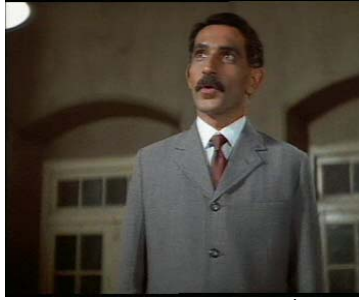
Resimler 1, 2, 3. Gandhi Retoriğinin Esası: İlkelere Sıkıca Yaslanmış Kelimelerinin Gücü

O'nun bazen tam tersine olarak harekete geçen Hintlileri sakinleştirmede de söz ve ifadelerinin gücünü kullanmasını, onun iyice hazmettiği inanca yönelik kaynakları uygulamaya koyması olarak ta algılamak mümkündür: “Bize ne yaparlarsa yapsınlar hiç kimseye saldırmayacağız, hiç kimseyi öldürmeyeceğiz fakat hiç kimseye parmak izi verilmeyeceğiz, bizi hapse atacaklar, para cezası verecekler, mallarımıza el koyacaklar ama biz izin vermedikçe kendimize olan saygımızı yok edemeyecekler.”