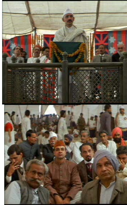
Resimler 12, 13. Kitlenin Dinledikçe Gandhi'nin Konuşmasından Etkilenmeleri