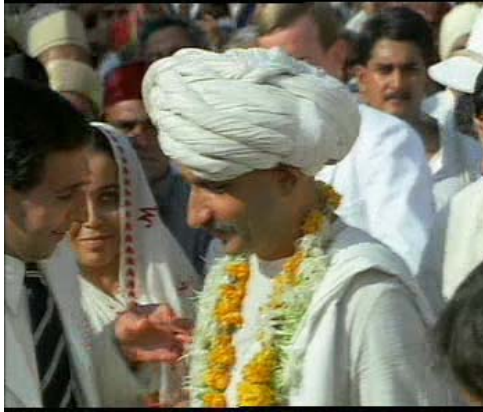
Resimler 10, 11. Gandhi'nin G.Afrika'dan Hindistan'a Gelişinde Bir Kurtarıcı Gibi Karşlanması

Gandhi Hindistan'a ayak basar basmaz Güney Afrika'daki İngilizlere karşı başarısından dolayı büyük bir topluluk tarafından karşılandıktan sonra, arkadaşı Bay Paten ile faytonla giderken bakışlarını çevresinde kendisini alkışlayanlardan daha çok yoksul halka çevirmiştir. Caddeler insan yığınları ile doludur. Fondan ağlayan bir bebek sesi duyulur, ve bu ağlayışta bir hüznün vardır (CD I, 52:30). Gandhi yanında konuşan Bay Paten'i dinler gözükmemektedir; bir ara başını eğerek, bakışları üzerinde doğru dürüst bir kıyafeti dahi olmayan bir çocuğu emzirmekte olan bir yoksul kadına kayar. Kadının arkasındaki çocuğun da elbisesi yoktur (CD I, 52:47). Böylelikle lider halk özdeşleşmesi bu sahnenin sonunda netlik kazanmaktadır.