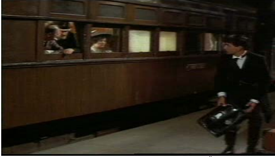
Resim 9. Gandhi'nin I. Sınıfta Yolculuk Etmekte Israrı Üzerine Trenden Atılması

Toplumsal krizin örneklenmesi adına sahnelere bir göz atıldığında, Gandhi ile Rahip Endurus'un ilk karşılaşma sahnesinde sokak aralarında yürürken önlerinin üç genç tarafından kesildiği sekanslar dikkat çekmektedirler. Bu kısacık sahnede Güney Afrika'daki bu şehrin panoraması – özellikle yerlilerin içinde bulunduğu sefalet ve perişanlığın resmedilmesi adına - bütün detaylarıyla verilmektedir; görüntü sadece iki saniye sürse de perdeye yansıtılan şey yerli nüfusun köleleştirilmesi olduğundan, sahne toplumsal kriz perspektifi açısından son derece vurgulu bir hal arz etmektedir: Önde arabayla giden şemsiyeli bir kadınla onun peşinde koca sandıkları taşıyan iki zenci görülmektedir. Yine bu sahnenin devamında (CD I: 28.24) rahip ve Gandhi şehrin ana caddesinde yürürken, toplumdaki sınıf ayrımı ve eşitsizliğin iyice ön plana çıktığı bir tezatlık görüntüsü net olarak ifade edilir: çuval taşıyan zenciler, ve güzel giyimleri ile güneşten korunmak için şemsiyesiz sokağa çıkamayan beyazlar. O şehrin güvenlik güçleri oldukları belli olan kişilerin Gandhi'nin üzerine doğru at sürmeleri ise bir yerli halka karşı beslenen küçümseyici duygularla horlamanın çok net bir ifadesi olarak göze çarpmaktadır.