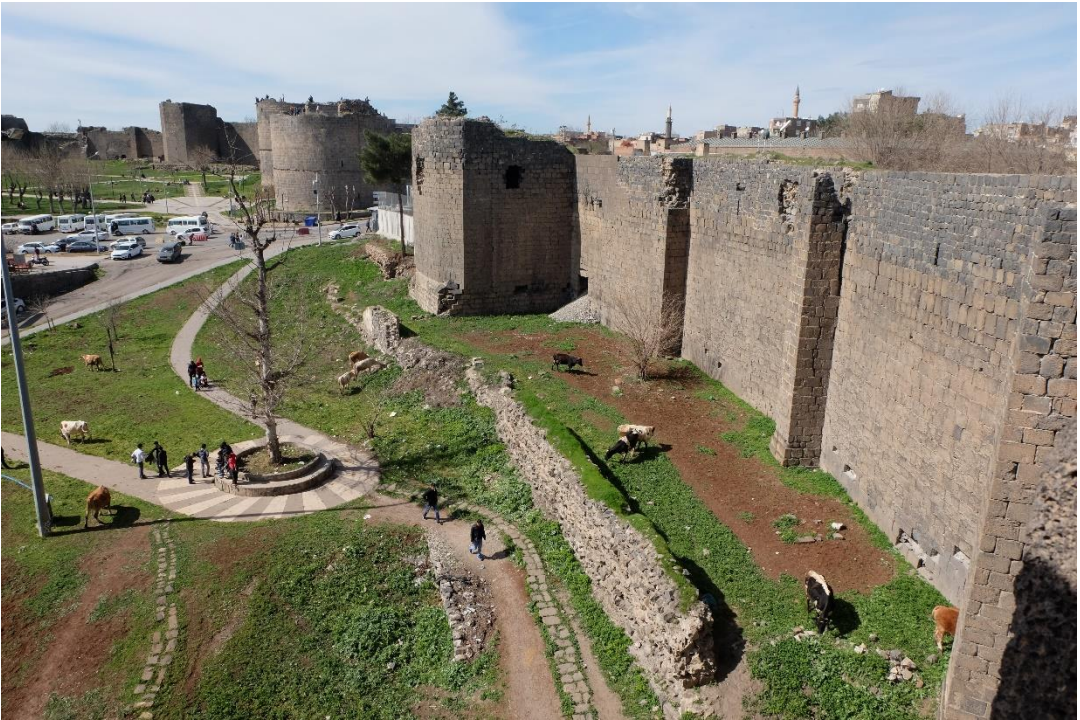
Fot.7- Mardin Kapıdan Evli Beden Burcu Arasındaki Surlar