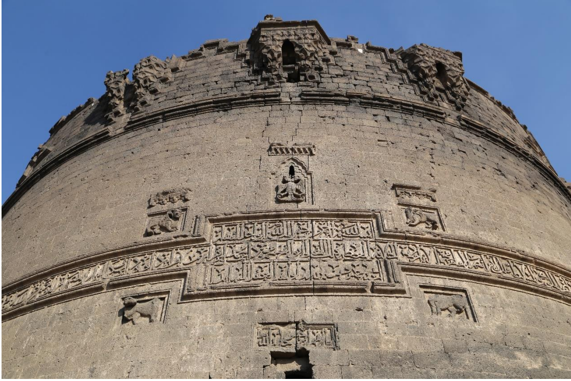
Fot.4- Ulu Beden Burcundaki Kitabeler