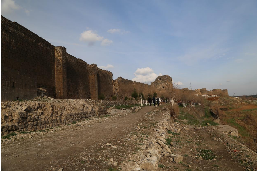
Fot.5- Diyarbakır Surlarının Dicle Nehri Tarafı Surları