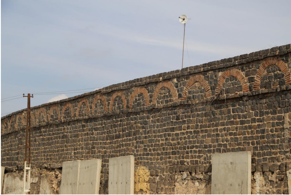
Fot.3- Diyarbakır Surları Bizans Dönemi Kalıntıları