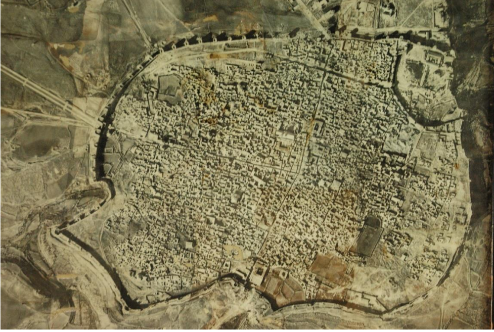
Fot.2- Diyarbakır Kalesinin Hava Fotoęrafı