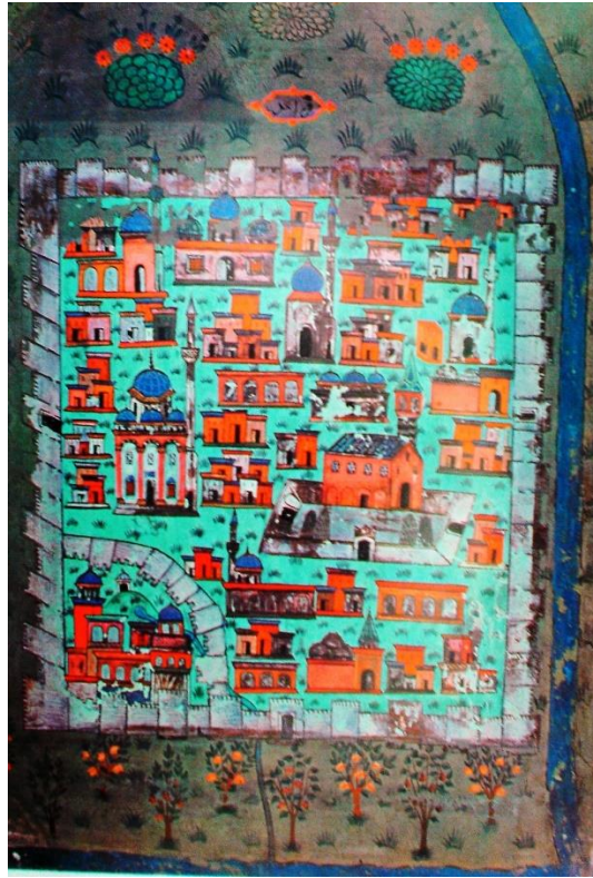
Fot.1- Diyarbakir Şehri ve Surları (Matrakçı Nasuh'dan)