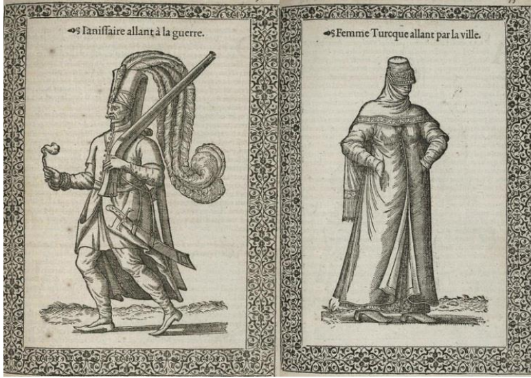
Resim:2 Şehirli Türk Kadını