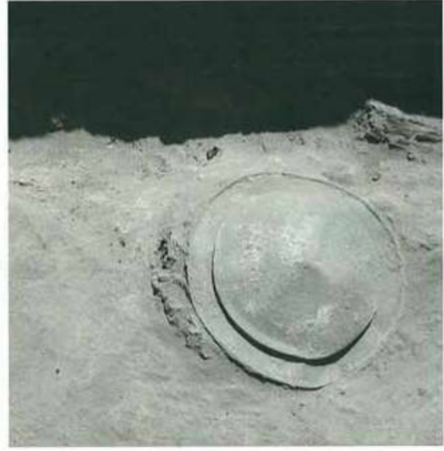
Res. 11: Ayanis tapınak deposunda adak kalkanı.