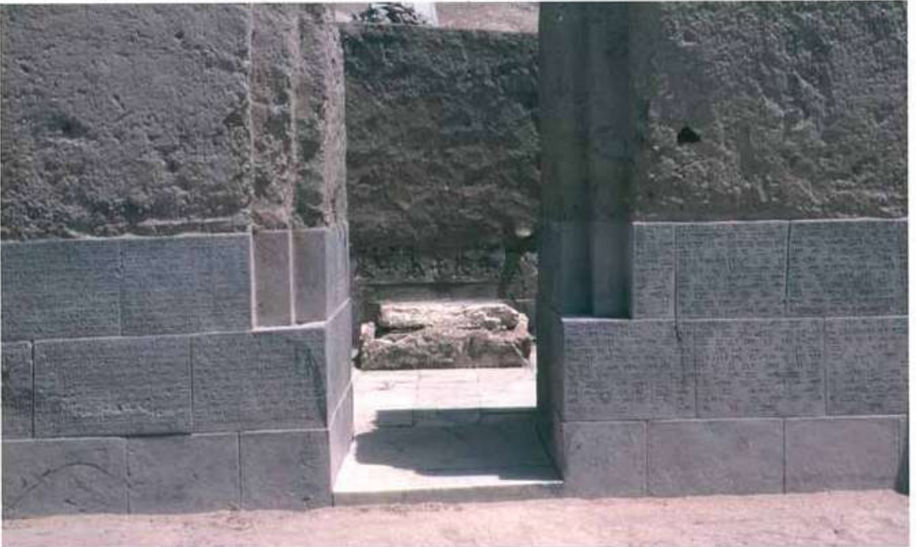
Res. 5: Ayanis tapınak ön cephe ve yazıt.