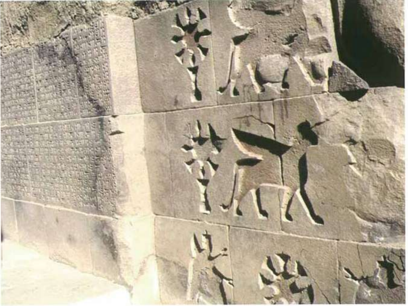
Res. 4: Ayanis tapınak bezeme ve yazıtı.