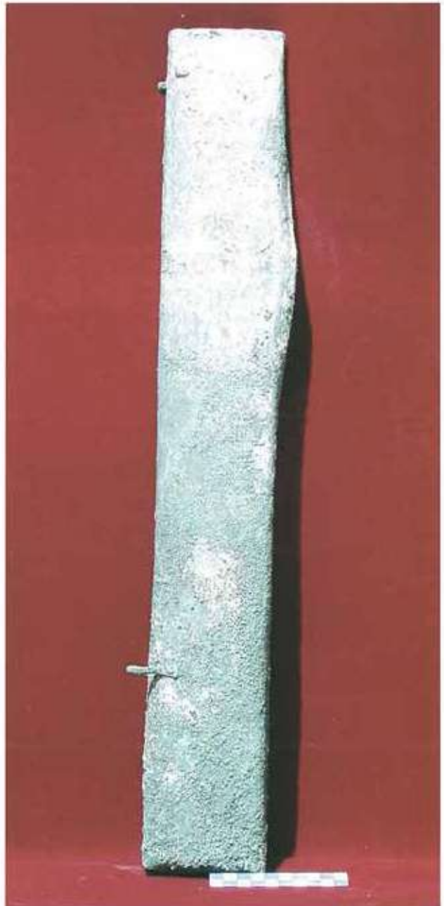
Res. 15: Ayanis tun sadak.