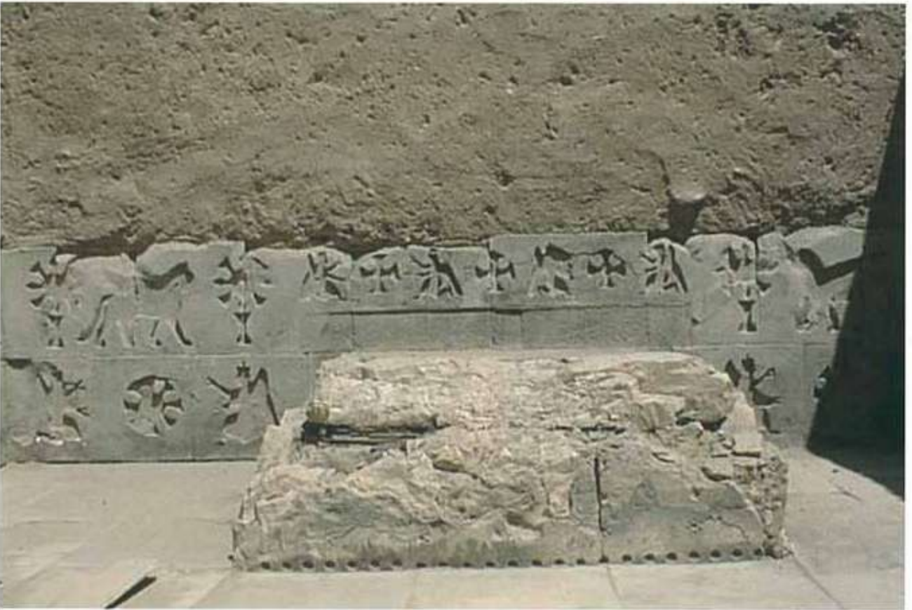
Res. 3: Ayanis cella içerisindeki podyum.