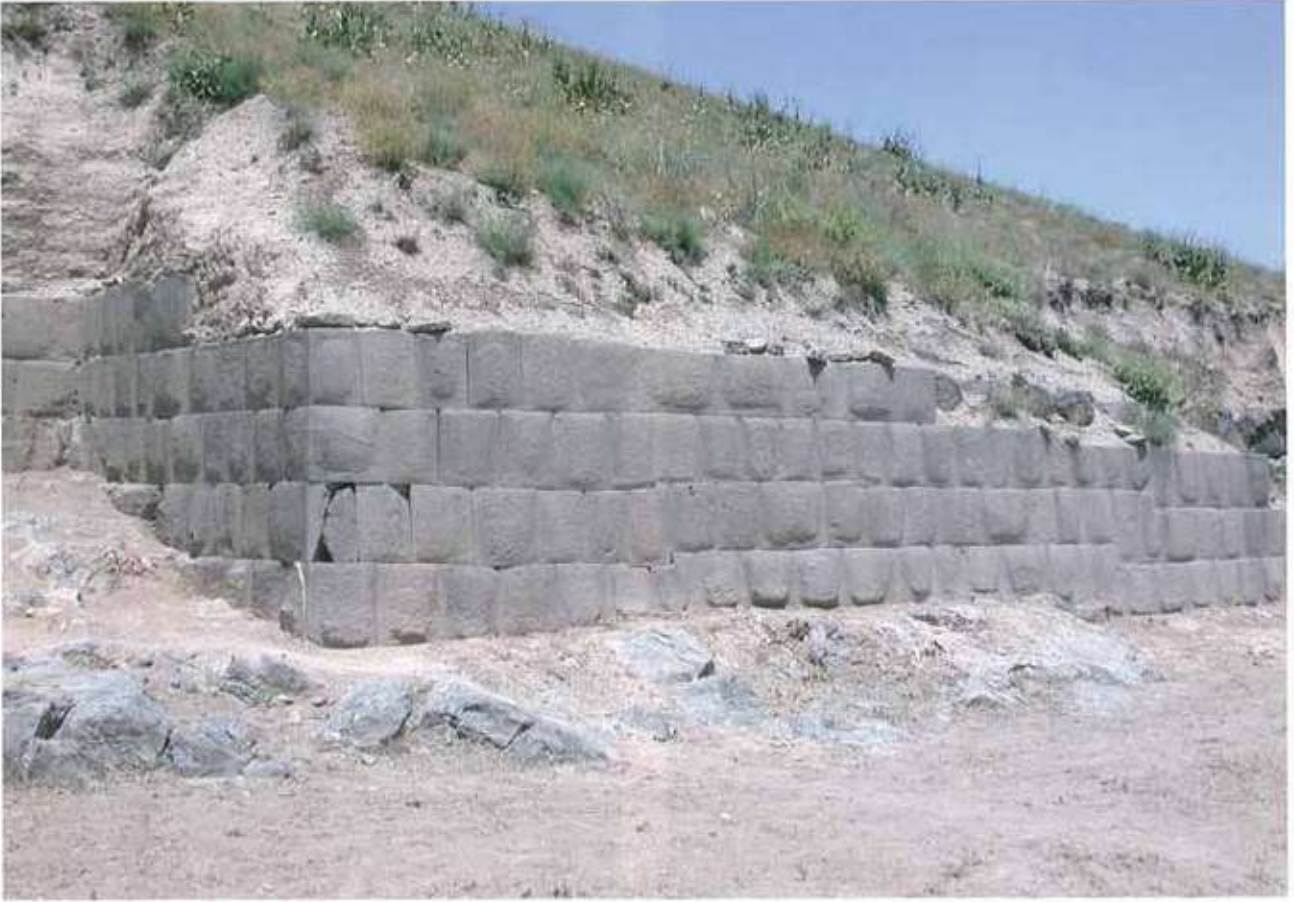
Res. 6: Ayanis gúney sur duvar temelleri.