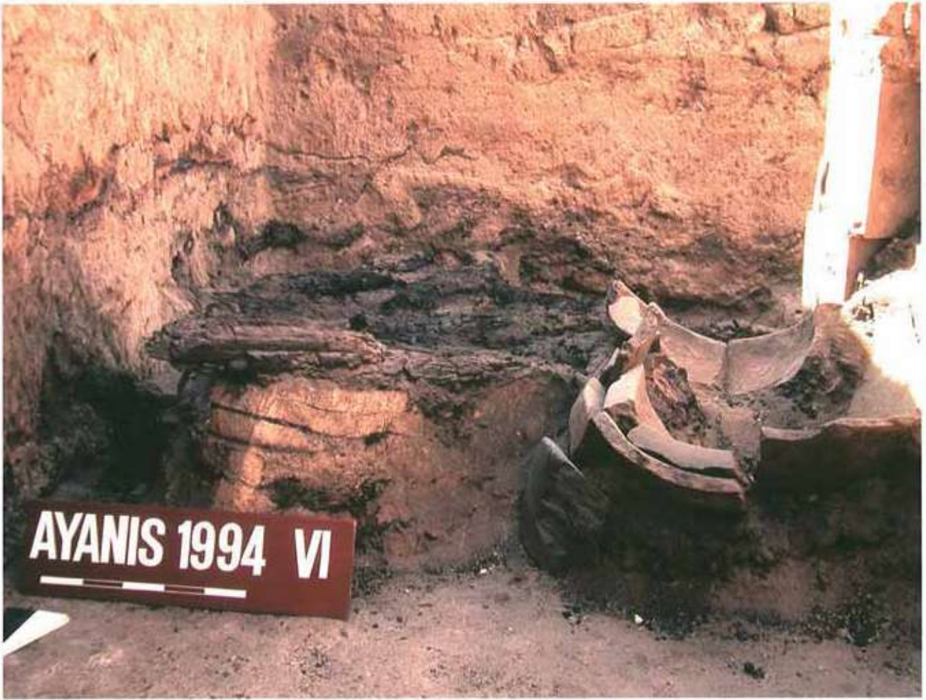
Res. 20: Ayanis dini temizlik kuveti.