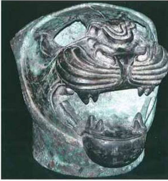
Res. 13: Ayanis arslan baſı.