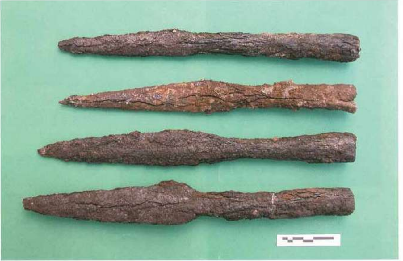
Res. 18: Ayanis demir mızrak uçları.