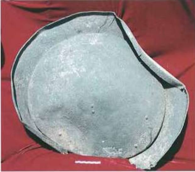
Res. 8: Ayanis tunç kalkan.