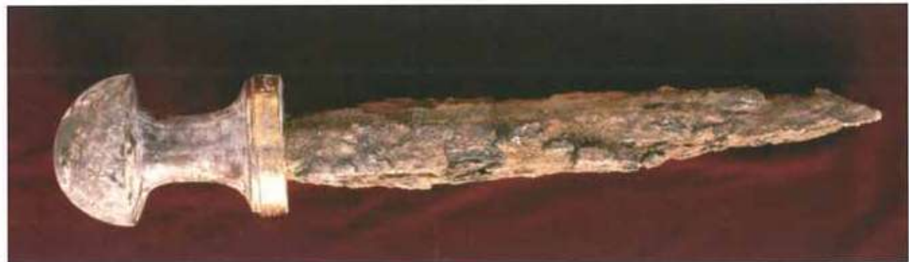
Res. 12: Ayanis yazıtlı tunç çivi.