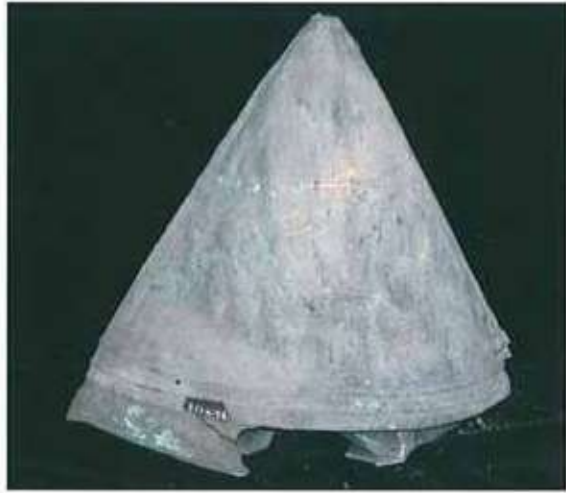
Res. 16: Ayanis tun miđfer.