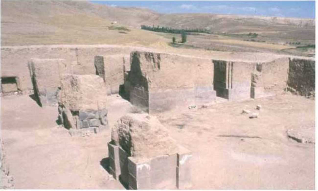
Res. 2: Ayanis Tapınak alanı.