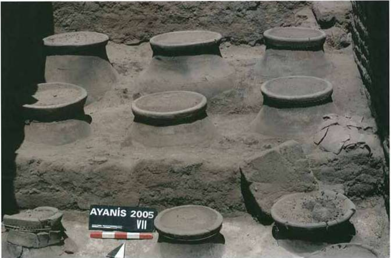
Res. 7: Ayanis batı depo odası.