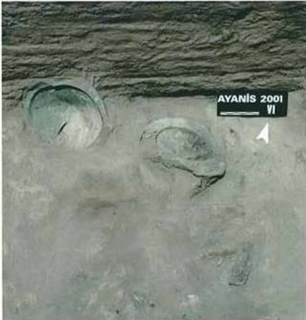
Res. 10: Ayanis tapınak deposu.