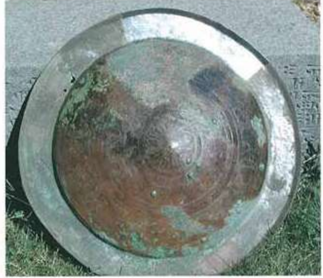
Res. 9: Ayanis kalay kaplı kalkan.