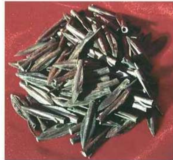
Res. 17: Ayanis iskit tipi okuları.