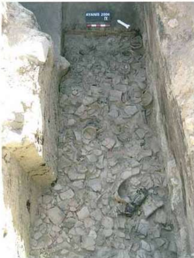
Res. 21: Ayanis dođu depo odası.