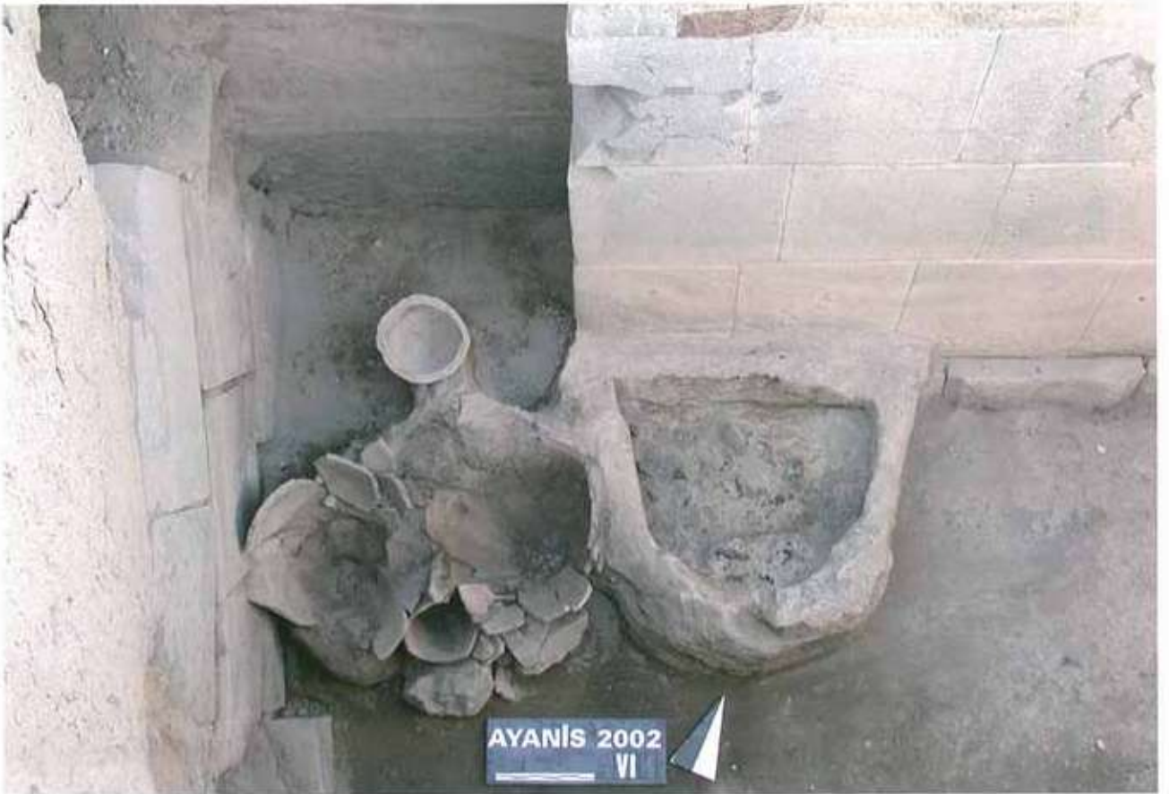
Res. 19: Ayanis tapınak güney ocağı.