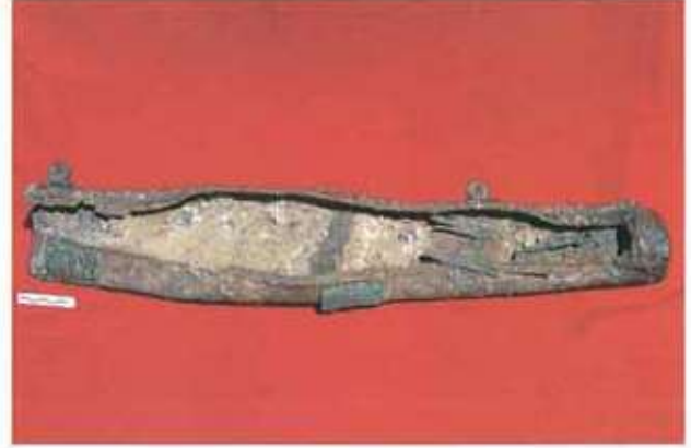
Res. 14: Ayanis demir sadak.