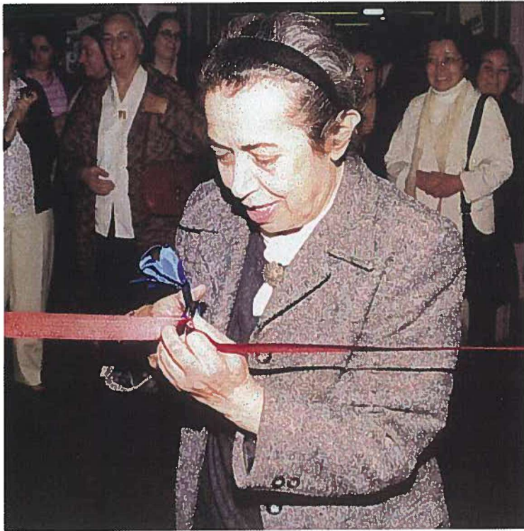
Prehistorya Anabilim Dalı'nın 40. yılı töreninde.