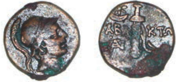
Res. 8 - Ares Betimli Sikke

Ares, Anaires (yok edici), Mainomenos (deli) ve Polydakrys (gözyaşı döktüren) gibi olumsuz sıfatlarla anılmaktadır. Ares, insanın yapısında var olan ve zaman zaman ortaya çıkan kan dökücülüğün ve savaşın tanrısıdır. Kan dökmekten hoşlanan bir tanrı olduğu için Olympos tanrıları ve insanlar arasında itibar görmemiştir. 36 (Resim 8-9-10-11)