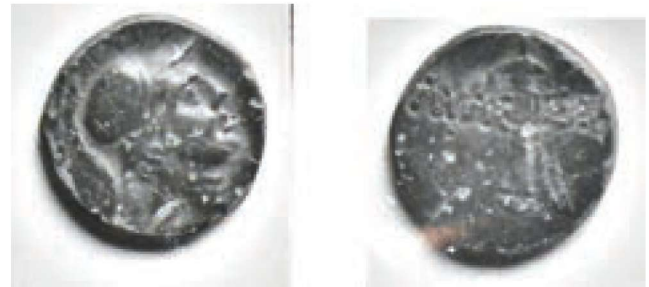
Res. 10 - Ares Betimli Sikke (Tokat Müzesi Arşivi)