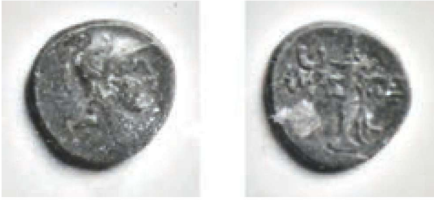
Res. 11 - Ares Betimli Sikke

Homeros'un İliada'sında kaleler yıkan, kan dökmekten hoşlanan ve akıldan çok kaba kuvvet ile ünlü bir tanrı olarak tanımlanmaktadır. Deimos (dehset), Phobos (koruk), Eris (kavga, arabozucu) ve Enyo'nun (öldürme) her zaman Ares'in yanında yer aldığı da görülmektedir. 37