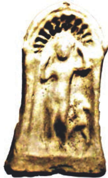
Res. 1 - Aphrodite

"Şimdi Komana kalabalık bir kenttir ve Armenia'dan gelen halk için önemli bir ticaret merkezidir; ve tanrıçanın "eksodos'u zamanında festivale katılmak için kentlerden, kasabalardan, her yerden gelen kadınlar ve erkekler hep birlikte burada toplanırlar. Belirli bazı kişiler daha vardır ki bir yemine uyararak daima orada yaşarlar, tanrıça onuruna kurban keserler. Yerli halk lüks içinde yaşar ve toprakları bağlarla doludur ve çoğu, kendini tanrıçaya vakfetmiş olan vücutlarından kazanç sağlayan kadınlardır. Bu nedenle bir bakıma kent küçük Korinthos gibidir. Çünkü orada da Aphrodite için kutsal olan kurt insanlar çok olduğundan pek çok yabancı buraya gelerek tatil yapar. Buraya giden tüccarlar ve askerler bütün paralarını harcadıklarından, bunlar için şu atasözü söylenir: "Korinthos'a seyahat etmek her adamın harcı değildir" İşte benim Komana hakkında söyleyeceklerim." 6