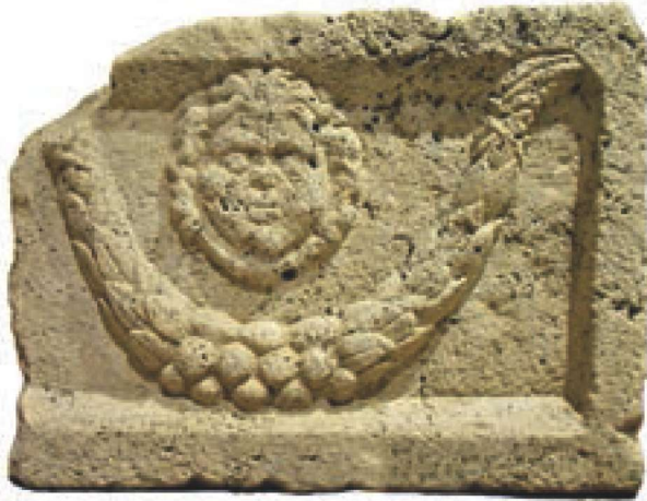
Res. 15 - Medusa Betimli Lahit Parçası (Tokat Müzesi Arşivi)

Medusa kabartması bulunan kireç taşından yapılmış bir lahit parçasıdır. Dikdörtgen formu olan blokun alt kısmı bir kaideye oturmaktadır. (Resim 15) Lahitin ön yüzünde ortada bir Medusa başı ile bunu bir yarım ay şeklinde çeviren gırlantılar kabartma olarak işlenmiştir. Birkaç yerinden kırılmış olan parçanın arka kısmında herhangi bir işlem yapılmamıştır. 76