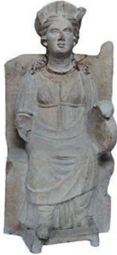
Res. 14 - Kybele

Ana tanrıçanın Anadolu'daki merkezi Phrygia'dır. Çalışma sahamızın içinde bulunan Komana Pontika ve Komana Kappadokia şehirleri tapınım merkezleri olarak karşımıza çıkmaktadır. Kybele'ye ait en eski tasvirler Hacılar ve Çatalhöyük'ten çıkarılmıştır. Bunlarda Kybele, genç ve yaşlı olarak, doğum yapmakta olan bir anne ve bir av kuşu ile beraber şekilde betimlenmiştir. Ayrıca yanında oğlu veya sevgilisi olarak nitelendirilen bir delikanlı da vardır. Ayrıca tanrıçanın bir veya iki leoparın üzerinde otururken, ayakta bir leopar yavrusu tutarken veya iki leoparın arasında tahta otururken betimlenmiş heykelleri de vardır.