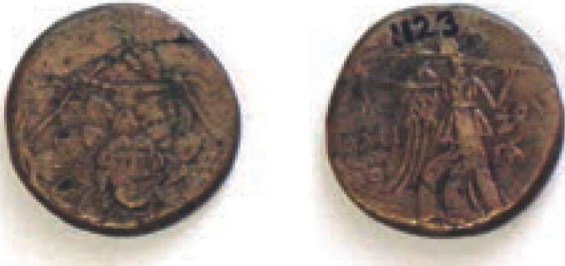
Res. 7 - Nike Betimli Sikke (Giresun Müzesi Arşivi)

Giresun müzesinden elde edilen M.Ö. 85-65 yıllarına tarihlenen bakır bir sikkenin ön yüzünde cepheaden betimlenmiş Gorgo başı, arka yüzünde ise profilden Nike yürür tarzında ve elinde bir palmiye dalı tutarken betimlenmiştir. 33 Müzede Nike'ye ait iki adet bronz sikkenin ön yüzünde Gorgo başı, arka yüzünde ise Nike'nin yürür durumda ve sol omzunda palmiyeli betimlemesi yapılmıştır. 34