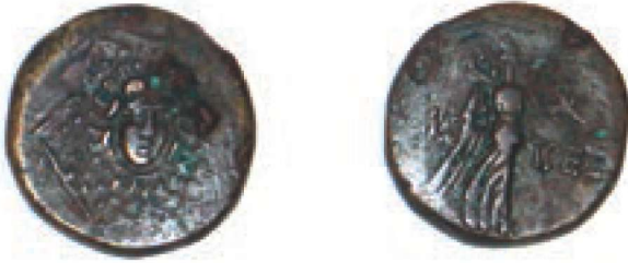
Res. 6 - Nike Betimli Sikke

Tokat müzesinden elde edilen bir sikkenin ön yüzünde Ageis Gorgo başı, arka yüzünde üzerinde Nike sağa yürürken ve omuzunda palmiye dalı betimlenmiştir. 30 Müzeye Niksar ilçesinden gelen bir başka sikkenin ön yüzünde yine aynı şekilde Gorgo başı, arka yüzünde ise Nike ayakta ve sağa doğru yürürken, omuzunda palmiye dalı ile betimlenmiştir. 31 Aynı zamanda farklı bir sikkenin ön yüzünde Aphrodite tahta oturur biçimde ve elinde küçük Eros, arka yüzünde ise Nike, sağa yürür durumda ve sol omzunda palmiye dalı ile betimlidir. 32 (Resim 6-7)