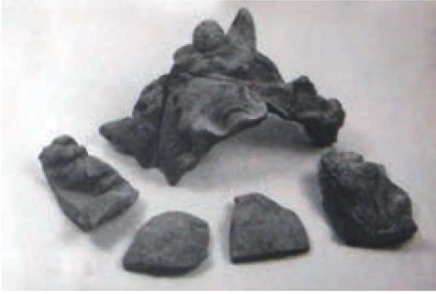
Res. 17 - Satyr (Tokat Müzesi Arşivi)

Tokat müzesinde yaptığımız çalışmalarda devetüyü renkli kilden yapılmış bir Satyr maskı tespit edilmiştir. Yüz kısmı gözlerinden itibaren kırık olan bu maskta alnın ortasından itibaren ayrılan dalgali saçlar başı çevrelemiştir. Başın iki yanında boynuzlu betimlenmiş olup boynuzun birinin yanında çam kozağı bulunmaktadır. 86 (Resim 17)