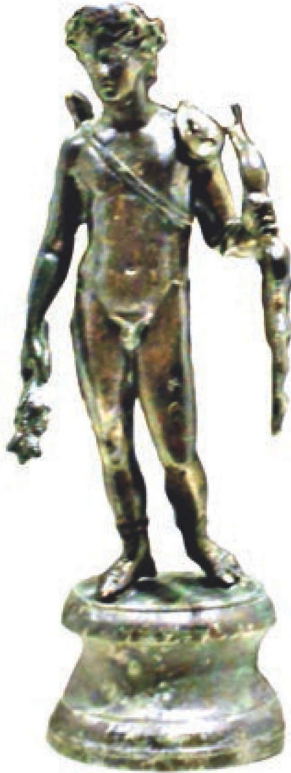
Res. 4 - Apollon

Apollon 13 kelimesinin Yunan etimolojisinde belirgin bir açıklaması yoktur. Apollon, cezalandırmak ya da apello yani defetmek, kötülüğü önleyip korumak anlamına gelen fiillerden ya da başka kökenlerden türemiş olduğu ileri sürülmektedir. (Resim 4) Yunanlılar'da tanrının özünü belirtmek için Phoibos ek adını takmışlardır. Phoibos, "belli, parlak" demektir. Bu isimle tanrının ışık saçan aydınlık varlığını dile getirmektedirler. 14