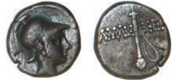
Res. 9 - Ares Betimli Sikke