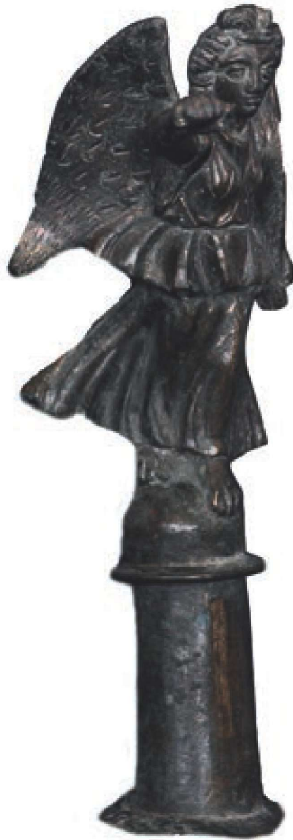
Res. 5 - Nike

Nike, zaferi simgeleyen bir tanrıça olup Pontoslular soyundan gelen Titan Pallas ile Okeanos kızı Styks’ten doğmuştur. 26 İlk tanrılar kuşağındandır. Nike adı yunanca Niki / Zafer kelimesinden türetilmiştir. Roma’da Nike, Palans tarafından büyütülmüş ve Palans ona adını verdiği kendi tepesi olan Palatinus üzerinde Clivus Victoriae’nin / Zafer yokuşu kenarında bir tapınak inşa ettirmiştir. Bu efsane Atina’da Athena ile Nike’yi birleştiren ilişkilerden doğmuş olup Nike, Atina’da Athena’nın sıfatından başka bir şey değildir. (Resim 5) Önceleri tanrıların hizmetçisi olarak kabul edilen Nike daha sonra Zeus ile Athena’nın habercisi olmuştur. 27