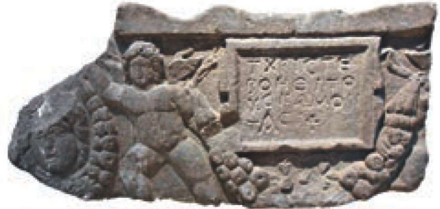
Res. 16 - Medusa

Sivas müzesinde bulunan bir lahit parçasında, çıplak bir tanrı yana hamle yapmış vaziyette kabartma olarak yapılmış, sol elinde bir çelenk, ortasında çerçeve içerisine alınmış bir kitabe tutmaktadır. Kitabe Roma harfleri ile 4 satır yazılmıştır. Sağ tarafta ise yine çelenk içinde bir Medusa başı vardır. Roma Dönemine aittir. 81 (Resim 16)