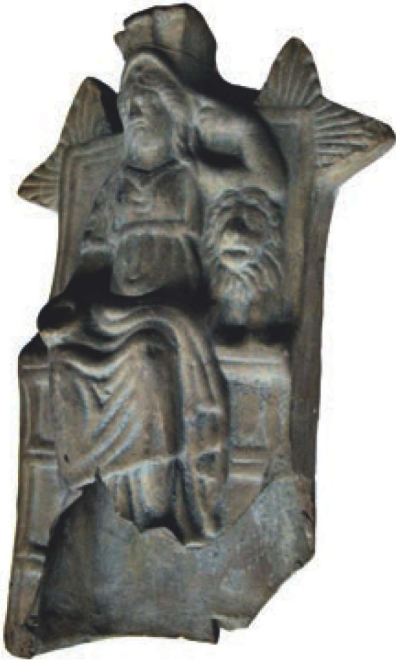
Res. 13 - Kybele

Kybele, Anadolu'nun en önemli tanrıçasıdır. Doğanın doğurucu ve besleyici niteliği onunla eşleştirilmiş, zamanla doğurganlıktan bolluk, verimlilik ve ürün kaynağı olma niteliği kazanmış ve daha sonraları karşılaşılan tanrıçaların da öncüsü olmuştur. (Resim 13-14) Mitolojide Kybele'yi farklı isimlerle görmekteyiz. Kültepe tabletlerinde adı Kubaba, Lydia'da Kybebe, Phrygia'da Kybele olarak geçmektedir. Hitit kaynaklarında ise Hepat olarak adlandırılmıştır. 61