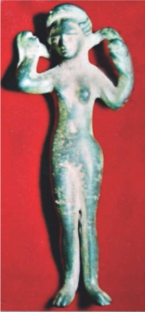
Res. 2 - Aphrodite