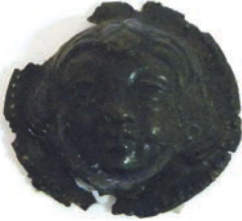
Res. 12 - Eros

Romalılar tarafından Cupid olarak adlandırılan Eros, 47 aşk tanrısı olarak bilinmektedir. Theogoniası hakkında değişik rivayetler vardır. Hesiodos'a göre o Khaos'tan sonraki Gaia'dan sonra var olmuştur. Eros'un doğumu ile ilgili olarak bundan başka anlatımlar da vardır. Bunlara göre Eros, Hermes ile Aphrodite'nin, Eilithyia ile İris'in, Aphrodite ile Ares'in oğlu olarak verilmiştir. (Resim 12)