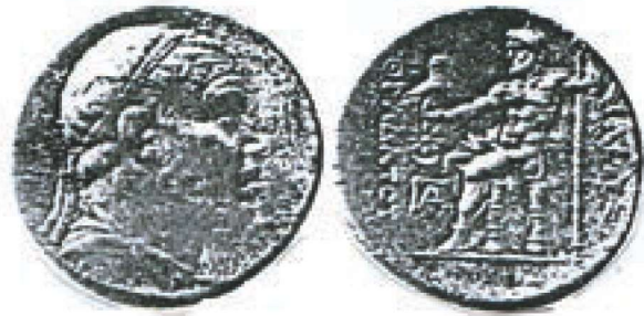
Res. 19 - Zeus Betimli Sikke (Işık 2004)

Zeus'un sembolleri arasında ön Hellenistik Çağ'da öncelikle kartal olmak üzere, asa, yıldırım demeti, çift balta, mızrak, kılıç ve yıldırım demeti sayılabilir. Yıldırım düşen yerler bu nedenle kutsal olarak kabul edilmiştir.