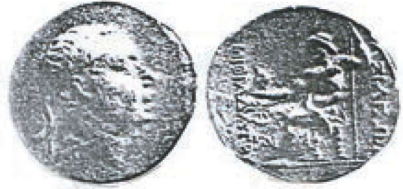
Res. 18 - Zeus Betimli Sikke (Işık 2004)

Zeus destanlarda tanrıların ve insanların babası olarak kabul görmüştür. 90 Ayrıca yağmuru yağdırdığı düşünüldüğü için bir "bereket tanrısı", "kefaret tanrısı", "ahlakın, ulusal düzenin ve devlet düzeninin koruyucusu", "Zeus Pater" epitheti ile "ev tanrısı" yani "evin babası" olarak da tapınılmıştır. (Resim 18-19)