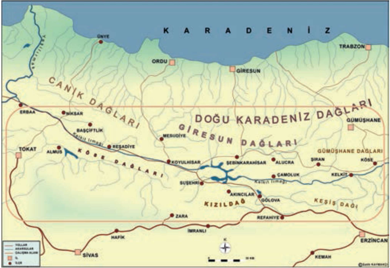
Şek. 1 - Kelkit Vadisi