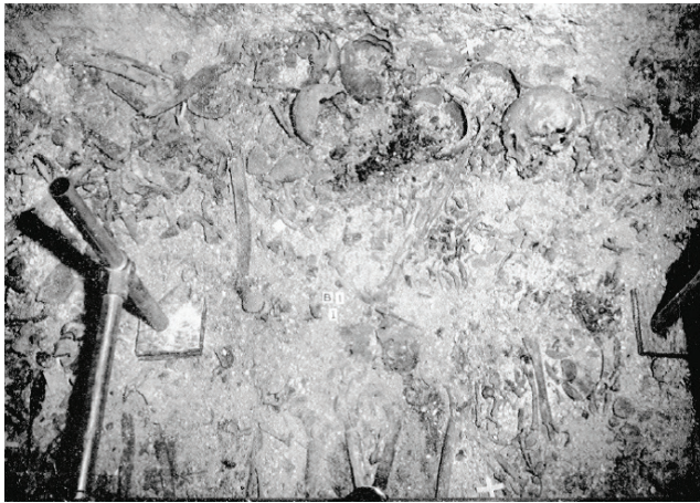
Resim 2: Erken Dönemde Mezar Odasında Gerçekleştirilen Çalışma Örneği / Practice Example Conducted in the Burial Chamber During Early Period (Leroi-Gourhan / Bailloud, Brezillon / Monmignaut 1962: 86, Fig. 52).

(Res. 2) 24 . Erken dönemlerde antik zamanlara dayanan din, inanç ve ölüm uygulamalarının aynı zamanda geniş tabana sahip sosyal kitlenin, toplulukların dinsel inanç pratiğinin yansıması olduğu düşünülmüştür. Ölüm durumunun yaşanmasıyla ortaya çıkan halkların ruhani, dini uygulamaları bir nevi tanrı ile iletişim aracı olarak kullanılmıştır 25 . Van Gennep'in çağdaş düşünürü olan R. Hertz, cenaze ritüelleri hakkında önemli bilgiler sunan bir makale kaleme almıştır. Çalışmalarını özetlediği makalesinde toplum üzerinde ölümün önemi, dünyada ölüm ile ilgili yorumlar ve ölümün dini inanışların yapısındaki bağlantıları üzerinde durmuştur. Hertz, ölüm ile ilişkili olarak öbür dünya inanışıyla bağlantılı birtakım argümanlar geliştirmiştir. Ona göre ölüm durumunda insanların yas tutması bir süre devam eder. Ölüm sosyal bir olgu olarak acı verici olur, kişide zihni parçalayıcı bir durum oluşturur 26 .