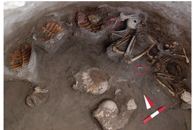
Resim 3: Geç Dönemde Mezarda Gerçekleştirilen Çalışma Örneği / Practice Example of a Work in the Grave During Late Period (Berthon/Erdal/Mashkour/Kozbe 2016: Figure 4).

Ölüm olgusu ve ritüellere bağlı belirli bir arkeolojik teorinin oluşması için ölü gömme geleneklerinden elde edilen sonuçların çeşitliliğe sahip olması gerekmektedir. Bu çeşitlilik sadece mezar/mezarlardan ve ritüellerden elde edilen tanımlamalarla sınırlı kalmaz, aynı zamanda arkeolojik katmanlardan elde edilen verilerle desteklenerek belirli bir anlam kazanabilir. Ölüm olgusuna bakışta ve ritüellerdeki çeşitliliği bilimsel arkeolojik veriler olarak değerlendirebilmek için üç önemli kıstas temelde ele alınmıştır. Bunlardan ilki ölü gömme çeşitliliklerindeki farklılıklar toplumsal yaşamın sosyal ayrımlarını ifade ettiğinin kabul edilmesi, ikincisi toplumun ölü gömme geleneklerinde uyguladıkları davranışların zaman boyunca varyasyonlarının açığa çıktığının kabul edilmesi ve