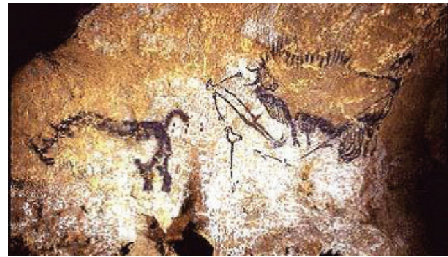
Resim 1: Fransa Lascaux Mağarası, Ölü Adam Sahnesi / Dead Man Scene, Lascaux Cave, France (Önuçak 2009: 9, Resim. 2)

olduğunu bilmemiz gerekmektedir. Bu açıdan yaklaştığımızda ölüm kavramının tanımı oldukça zorlaşacaktır 7 . Ölüm, canlılarda yaşamsal fonksiyonların tamamen durması anlamına gelmekte ve hayatın önemli bir parçası olup erken dönemlerden itibaren insanlığı derinden etkilemiş, insanlığı çeşitli düşüncelere sevk etmiştir 8 . Ölüm biyolojik anlamda solunum aktarımı yapabilen bedenin oksijen alamaması sonucu yaşam sürecinin tükenmesi olarak tanımlanabilir. Ölüm sosyal anlamda ise hem bireyin yaşam sürecinin tüm dinamikleri ile sona ermesi hem de bireyin var olduğu sosyal ilişki ağı içerisinde bulunduğu sosyal düzenden silinip gitmesi, sona ermesi, sevdiklerinden ayrılması ve onların bilinmeyene yollanması olarak tanımlanabilir 9 . Ölüme bunlar dışında soyut ve somut daha birçok tanımlama getirilebilir. Ancak ölüm olgusunu gözlemleyenler için elde olan ve gözle görülür elle tutulur tek bilgi bedenin çürüdüğü, yumuşak dokuların belli bir süre içerisinde yok olduğu ve geriye sert, kaybolmayan kemik, diş dokuların kalmış olmasıdır 10 .