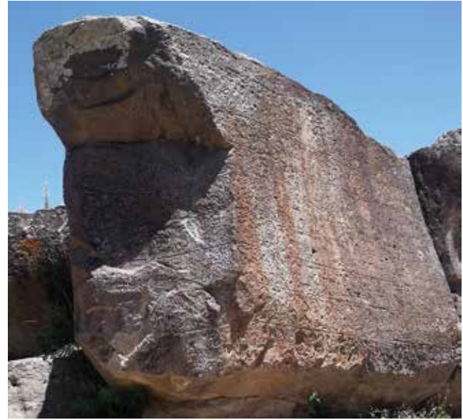
Resim 2: Topada Yazıtı / Topada Inscription

Wasusarma'nın ismi en erken III. Tiglat-Pileser döneminde MÖ 738 yılına tarihlendirilen metinlerde haraç alınan krallar arasında görülmektedir 60 . Kralın Tabal tahtından indirilme sebebi de Asur başarılarına karşı kayıtsız kalarak haracını vermemesidir.