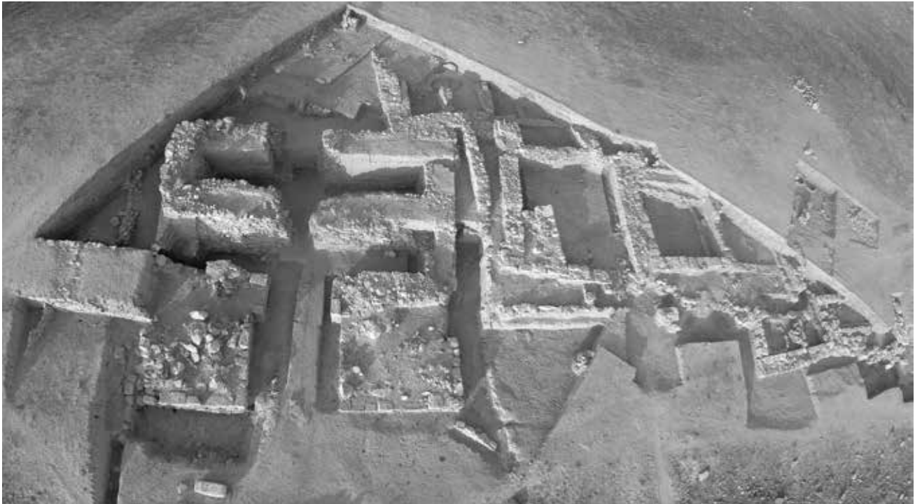
Resim 8: Ovaören Yassıhöyük, Geç Hitit Dönemi Kapısı/ Ovaören-Yassıhöyük, Late Hittite Gate