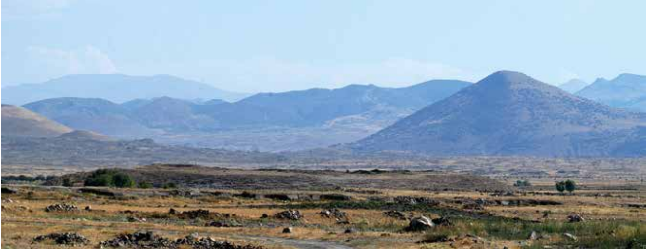
Resim 3: Karahöyük (Ağılı) / Karahöyük (Ağılı)

kabul etmeyerek, Tabal tahtına oturtulmaya çalışılan kişi ve ona destek olan krallar ile mücadele içerisinde girmiş olabileceği düşünülebilir. Büyük kral Wasusarma'nın yanı sıra, Warpalawa'nın (Urballa) da Asur'a ağır vergiler ödemek zorunda kaldığı diğer yazılı kaynaklardan 63 bilinmektedir. Dolayısıyla dost kralların büyük kral Wasusarma'ya olan bağlılıklarının ötesinde, Asur'un politik ve ekonomik baskılarına karşı çıkan bir siyaset ile böyle bir değişime karşı çıktıkları önerilebilir.