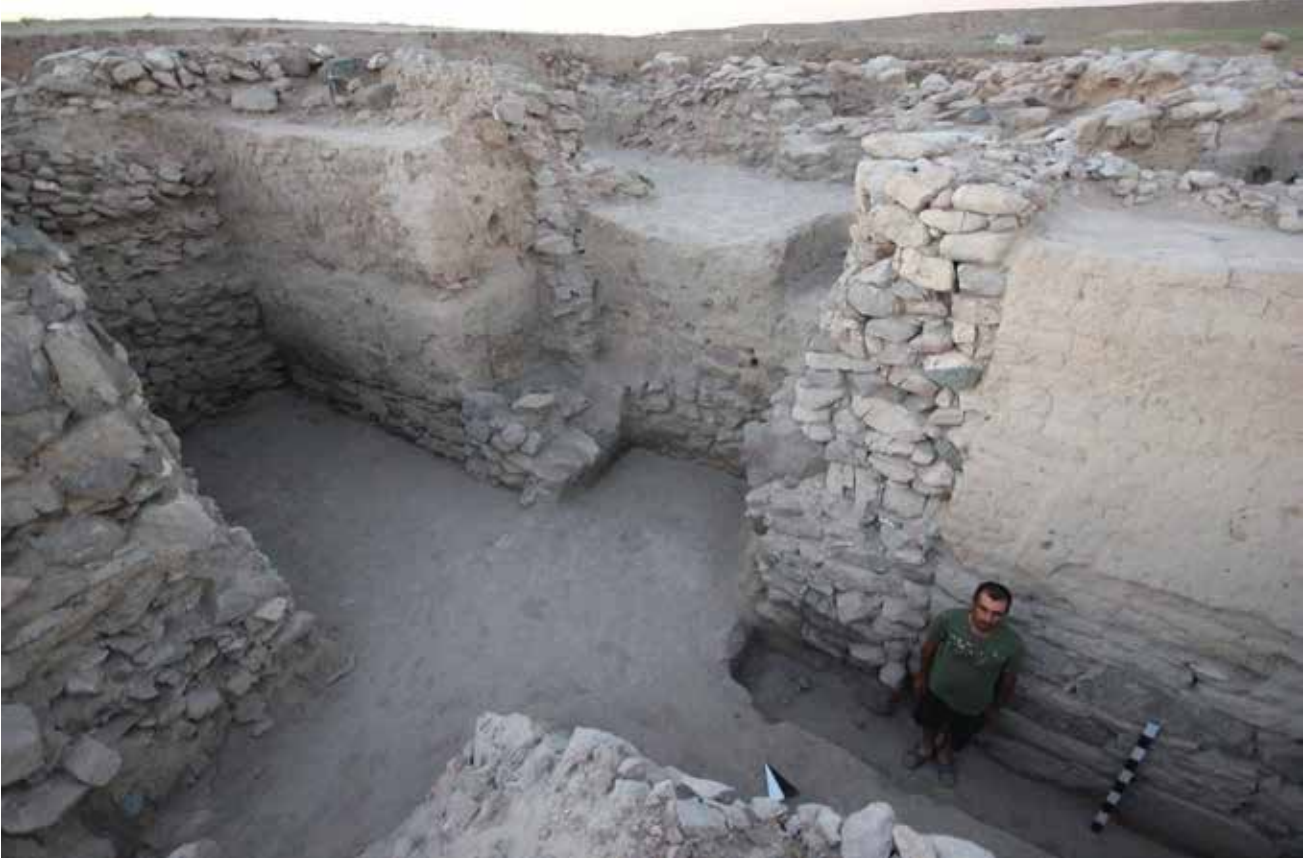
Resim 9: Ovaören-Yassıhöyük, Geç Hitit kapısı son evre / The Last Phase of Late Hittite Gate

karşısında başarısız olduğu, tahta hiç çıkamadığı ve Asur'a kaçmak zorunda kaldığı sonucuna ulaşılabilir. Önerilen bu tarihsel süreç içerisinde TOPADA yazıtının, Wasusarma'nın MÖ 729 yılında sözde tahttan indirilmesi sonrasındaki dönemlerle ilişkili olduğu ve kazanılan zafer sonrasında, MÖ 726/725 yıllarına tarihlenebileceği de önerilmektedir.