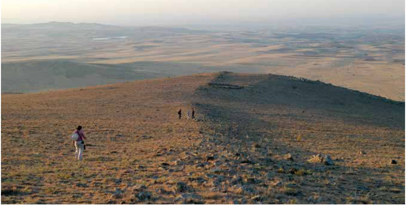
Resim 5: Nevşehir-Karadağ Üzerindeki Sınır Duvarları/ Border Walls on Nevşehir-Karadağ

Göllüdağ'da bulunmuş heykeltıraşlık eserleri yerleşim kronolojisi açısından son derece önemlidir. Bu eserlerin en dikkat çekici özellikleri kabaca işlenmiş olmaları ve birçoğunun detaylarının verilmemiş olmasıdır. Özellikle ortostatların, üzerinde kabartma bulunmaması sebebiyle yarım bırakıldıkları önerilmiştir 104 . Göllüdağ'ın son mimari evresi için en önemli referansları oluşturan kapı aslanları, R. O. Arık tarafından MÖ 9. yüzyıla tarihlendirilmiştir 105 . E. Akurgal 106 ve W. Schirmer 107 ise güçlü Asur etkilerini işaret ederek MÖ 8. yüzyılın sonu ile MÖ 7. yüzyılın başlarını, S. Aro 108 MÖ 700-650 aralığını öne çıkarmıştır. Ancak kapı aslanlarının ikonografik detayları özellikle Sakçagözü kapı aslanı 109 ile son derece benzerdir ve MÖ 8. yüzyılın sonlarına tarihlendirilmesi daha mümkündür 110 . Kazılarda bulunmuş seramikler de MÖ 8. yüzyılın ikinci yarısı ile MÖ 7. yüzyılın başlarına işaret etmektedir 111 .