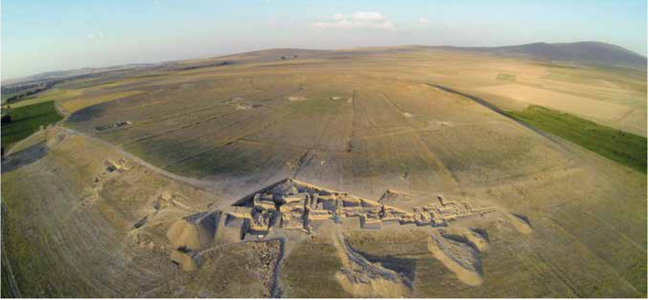
Resim 4: Ovaören-Yassihöyük / Ovaören-Yassihöyük

C. Woudhuizen 79 ise “Parwita” şeklinde okuduğu ülke/şehrin Kızılırmak kavsi içerisinde olması gerektiğini öne sürmüştür. K. Strobel 80 Parzuta’nın Ovaören-Yassihöyük (Res. 4) olabileceğini önermiştir. M. Weeden ise yaptığı yeni okuma önerileri çerçevesinde, Parzuta ve Ta-x ülkeleri/şehirleri için iki farklı senaryo üzerinden bazı önerilerde bulunmuştur. Buna göre Ta-x ile Parzuta ülkelerinin Kızılırmak Nehri yakınlarında, Wasusarma yazıtlarının olduğu bölge içerisinde olabileceği ve Ovaören-Topada-Göllüdağ arasındaki bölgenin (Res. 1, 7) daha fazla öne çıktığını belirtmiştir 81 .