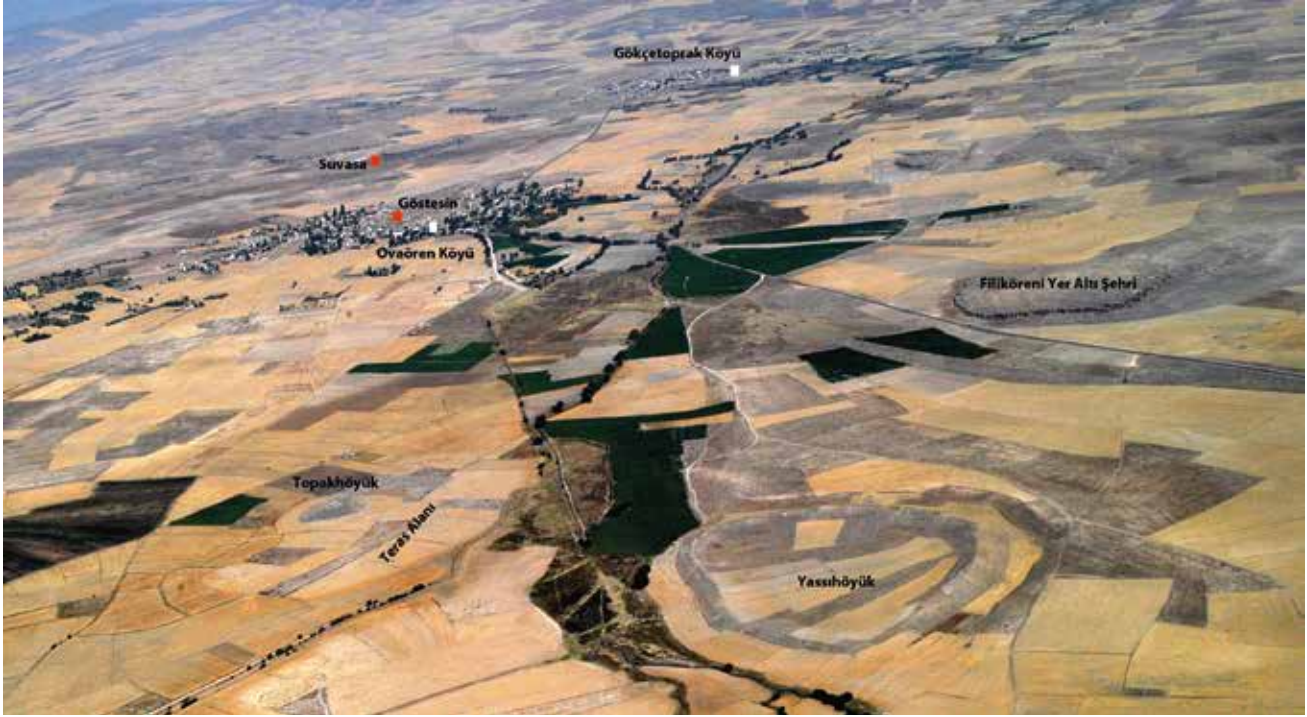
Resim 6: Ovaören ve Yakın Çevresi / Ovaören and its Vicinity

kadar uzanan bölgede, Luwi dilinden daha farklı bir dil kullanan ve arkeolojik buluntuları ile daha farklı bir kültür grubunu oluşturan Frig varlığı görülebilmektedir 135 . Bu iki kültürün sınırı konumundaki Konya ve Karaman Ovası'ndaki seramik geleneklerinde görülen benzerlikler dikkat çekicidir. Özellikle Konya'daki Alaaddintepesi'nde bulunmuş seramiklerin 136 daha çok Frig etkisini yansıtan örnekler olması 137 , bu dönemde bölgedeki kültürel kimliğin Friglere daha yakın olduğunu göstermektedir 138 . Ancak bu sınırların seramik verileri üzerinden kesin hatlar ile çizilmesi mümkün değildir. Zira, Tabal'deki en baskın seramik geleneğini oluşturan Alışar-4 gurubu üretimlerine Frig başkenti Gordion'da 139 da rastlanmaktadır.