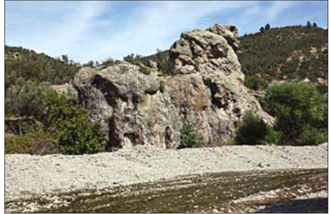
Resim 10: Bahadınlar Köyü Dedekaya Kaya Kült Anıtı / Dedekaya Rock-Cut Monument near Bahadınlar Village

Yukarıda değinilen yivler, çanaklar yekpare kaya kütesinin doğu kısmında, tepede bulunmaktadır. Çanakların çapları 10-20 cm arasında değişmektedir