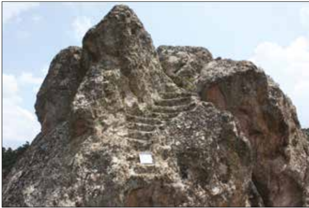
Resim 2: Karalar Köyü, Merdivenli Kayalar Kaya Kült Anıtı / Rock-Cut Monument of Merdivenli Kayalar Near Karalar Village (Aslı Saka)

Değinilen ana platforma yaklaşık 12 basamaklı bir merdiven ile çıkılır. Merdivenin alt basamakları muhtemelen kaçak kazılar sonucunda tahrip edilmiştir. Dolayısıyla, kaya kült alanının ilk yapım evresinde kaç basamaklı olduğunu tespit etmek mümkün değildir. Günümüze kadar sağlam biçimde ulaşmayı başaran