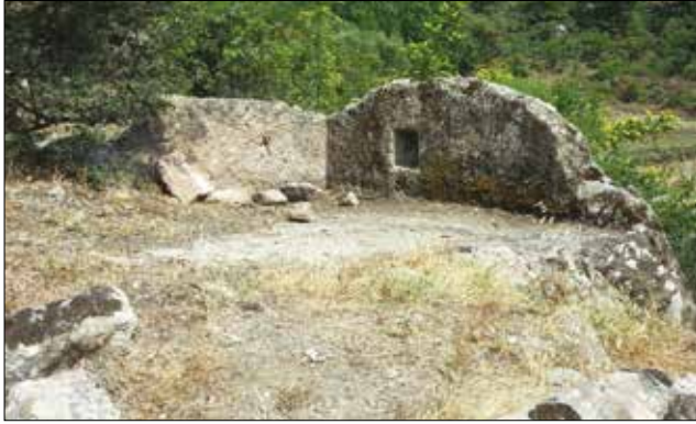
Resim 5: Merdivenli Kayalar Üçüncü Kaya Kült Alanı / Third Ritual Area at Merdivenli Kayalar (Aslı Saka)

İkincil öneme sahip olduğu düşünülen bir diğere açık hava tapınım alanı, Merdivenli Kayalar ana tapınım alanının 500m güney batısında bulunmaktadır (Res. 5). İzole bir biçimde düzenlenen ana mekân, kuzey-güney eksenlidir. Düzleştirilmiş platform kare formunda ve 2x2m ölçülerindedir. Kaya kült alanının güneyini sınırlayan yaklaşık 1m yükseklikteki duvar üzerinde, 30x30 cm kare formlu, korunan derinliği 12 cm bir niş yer alır. Nişin hemen üzerinde çeşitkenar üçgene benzeyen, kazıma tekniği ile yapılmış bir çerçeve