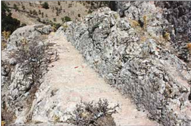
Resim 9: Ulutaş Kaya Kült Alanı Platform / Platform from Ulutaş Rock-Cut Monument (Ashi Saka)

kült alanlarında sıkça görülen niş düzenlemeleri ile vurgulanmıştır. Doğu yüzde tespit edilen altı adet nişin üçü kare formlu, diğer üçü ise ikizkenar yamuk formludur. Nişlerin içerisinde kazıma ya da kabartma herhangi bir betim yer almaz. İkizkenar yamuk formlu nişlerin en yakın örneklerine Balkanlar'da rastlanmaktadır. Bulgaristan'da yer alan Rodop Dağı'nın doğusunda ikizkenar yamuk şeklinde nişlere sahip olan kaya kült