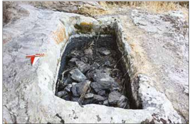
Resim 11: Khamosorion Tipi Mezar Dedekaya Kaya Kült Anıtı / Khamosorion Type of Burial at Dedekaya Rock-Cut Monument (Aslı Saka)

ve korunan derinlikleri ise 13-20 cm arasında farklılık göstermektedir. Yivlerin ve çanakların fonksiyonu her ne kadar net olmasa da, libasyon törenlerinde kullanıldığı düşünülebilir.