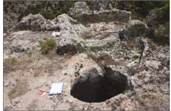
Resim 3: Merdivenli Kayalar Ana Dini Seremoni Alanı ve Kuyu / Merdivenli Kayalar Main Ritual Area and Shaft (Aslı Saka)

Oda düzenlemesinin kuzeyinde 80 cm yüksekliğe, 50 cm genişliğe sahip olan bir idol yer almaktadır (Res. 3). İdol yarım daire formudur. Ana idolün her iki yanında yine yarım daire formu destekler yer almaktadır. İdolün yüzeyi düzdür, kazıma ya da kabartma biçiminde bir bezemeye sahip değildir. Oda düzenlemesinin kuzey sınırını oluşturan idolün doğusu, odaya girişin sağlandığı eşik olmalıdır.