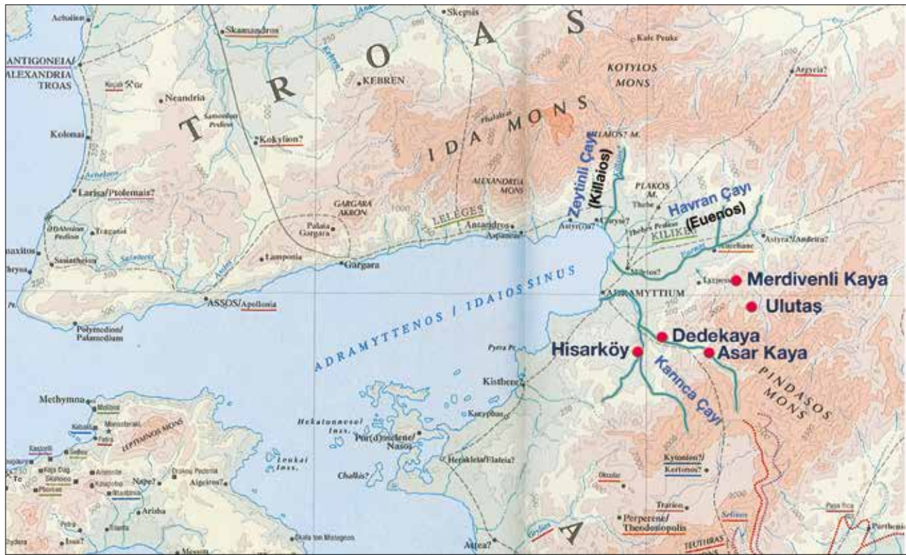
Resim 1: Edremit Körfezi Genel Haritası ve Kaya Kült Alanları Lokasyonu / General Map of Edremit Gulf and Detail Locations of Rock-Cut Monuments.

Anadolu'nun kuzeybatısında yer alan Balıkesir ili, yüz ölçümü büyüklüğü bakımından yaklaşık 14.299 km 2 ile ülkenin 13. sırasında yer alır. İl, kuzeyde Marmara Denizi, güneyde İzmir ve Manisa illeri, batıda Ege Denizi, doğuda ise Bursa ve Kütahya illeri ile komşudur. İlin genelinde Akdeniz iklimi hâkim iken, kuzey kesiminde Karadeniz iklimi etkisini göstermektedir. İklimsel çeşitlilik il sınırları içerisinde yetişen tarım ürünlerinin çeşitliliğini de etkilemektedir. İlin genel geçim kaynakları tarım ve hayvancılıktır. İl sınırları içerisinde alüvyon bakımından zengin dört ova yer alır, bu ovalar sırasıyla Gönen, Balıkesir, Susurluk ve Edremit ovalarıdır.