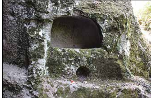
Resim 13: Arcosolium Tipi Mezar Dedekaya Kaya Kült Alanı/ Arcosolium Type of Burial at Dedekaya Rock-Cut Monument (Aslı Saka)

Dedekaya kaya kült alanı yukarıda da değinildiği gibi, kompleks bir kült alanıdır. Bu alanın dışında Karınca Çayı'nın güneyinde dini törenlerin gerçekleştirildiği ana kaya kütesinin yaklaşık 300m güneyinde, çayın karşı kıyısında bir mağara yer alır. Mağaranın girişinde, güneyde yarım daire formulu bir niş bulunmaktadır. Niş 100x60 cm ölçülerine sahiptir ve derinliği 40 cm'dir. Nişin hemen önünde büyükçe bir hazne görülür. Hazne, 60x40 cm ölçülerindedir. Haznenin kenarlarında ahşap bir kapağı tutmak için yapıldığı düşünülen çıkıntılar bulunur (Res. 13). Haznenin en alt kısmında 30 cm çapa sahip, dairesel formulu bir tahliye deliği vardır. Düzenlemenin kullanım amacı net olmamak ile beraber arcosoliumlu tekne mezarlarını andırmaktadır.