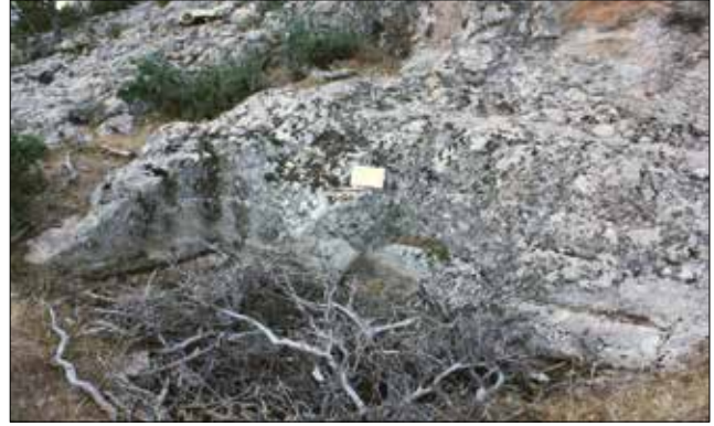
Resim 4: Merdivenli Kayalar İkinci Kaya Kült Alanı / Merdivenli Kayalar Second Ritual Area (Aslı Saka)

Merdivenli Kayalar kaya kült alanının ana tapınım platformundan başka, açık hava tapınım alanının yakınında üç farklı açık hava tapınım alanı daha yer almaktadır (Res. 4). İlki Merdivenli Kayalar kaya kült alanının yaklaşık 100m kuzeyinde, platformun bulunduğu ana kayanın taban seviyesinde yer alır. İkincil derecede öneme sahip olduğu düşünülen açık hava tapınım alanı, dikdörtgen şeklinde, kayaya oyulmuş oda formunda, 240x60 cm boyutlarındadır. Basamağın derinliği 20 cm'dir ve kuzeybatı güneydoğu akslıdır. Kaya kült alanının üç tarafı kapalıdır sadece batıya bakan yüzü açıktır. Kayaya oyularak ortaya çıkarılan yan duvarlar, güney kuzey eksenindedir. Tapınım alanının en yüksek duvarı doğu duvarıdır. Tapınım alanının en yüksek duvarı olan doğu duvarı ve kademeli olarak batıya