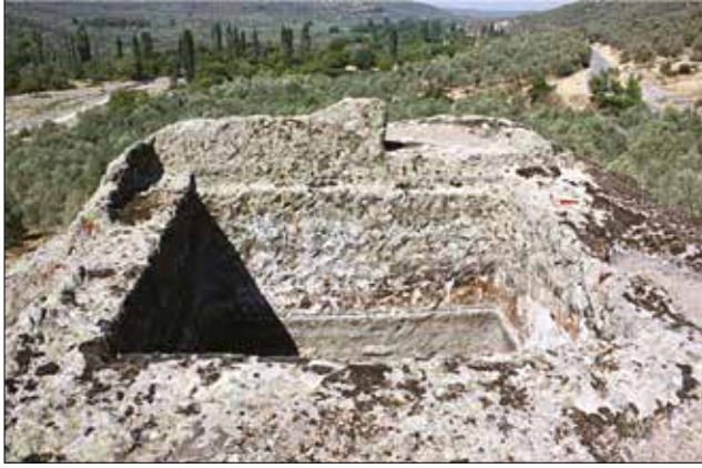
Resim 12: Dedekaya Kaya Kült Alanı Kuyu / Shaft Monument from Dedekaya Rock-Cut Monument (Aslı Saka)

ve kaya kütesinin yan yüzlerinden biri üzerine kazınan niş ile aynı eksende inşa edilmeleridir 46 . Fakat Dedekaya kaya kült anıtında aynı düzenlemeden bahsetmek mümkün değildir. Tıpkı Havran ilçesine bağlı Karalar Köyü'nde tespit edilen Merdivenli Kayalar kaya kült alanı gibi Dedekaya Kaya kült alanı üzerinde de yekpare kaya bloklarının yan yüzlerine kazıma tekniği ile yapılan bir niş düzenlemesine rastlanmaz.