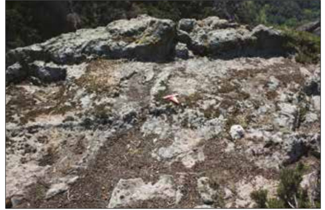
Resim 14: Asarkaya Kaya Kült Alanı Karadere Köyü / Asarkaya Rock-Cut Monument near Karadere Village (Aslı Saka)

düzleştirilmiş platform düzenlemesine çıkış doğu yöndendir. 40x40 cm genişliğe sahip, yedi adet basamakla platforma çıkılır. Basamakların sonunda 5x3m boyutlarında bir platforma ulaşılır. Platform, kaya kült alanında dini törenlerin gerçekleştiği bölümdür. Kuzey-güney eksenli düzenlenen platformun güney yönünde idol düzenlemesi bulunur. Ortada yarım daire formlu idol ve bu idolün her iki tarafında daha küçük boyutlu iki idol yer alır (Res. 14). Eldeki veriler ile platformun ve idollerin fonksiyonunun tanımlanması mümkün değildir. Benzer düzenlemelerin kullanım amacı ile ilgili ilk öneri Tüfekçi Sivas tarafından yapılmıştır, araştırmacının Köhnüş'te tespit ettiği altarlarda da benzer bir düzenleme görülür. Bahsi geçen düzenlemede kavisli bir idolün her iki yanında da arka ayakları üzerine oturduğu düşünülen aslanlar yer alır 57 . Aslan betimlerinin zaman içerisinde