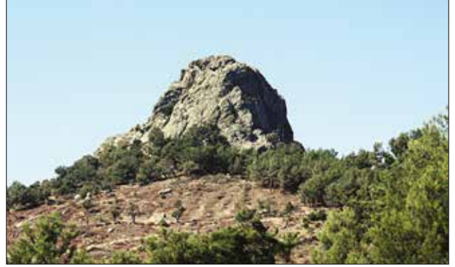
Resim 7: Çakırdere Köyü Ulutaş Kaya Kült Alanı / Çakırdere Village Ulutaş Rock-Cut Monument (Aslı Saka)

Havran ilçe sınırları içerisinde Merdivenli Kayalar gibi başka bir kaya kült alanı daha bulunmaktadır. Ulutaş ya da Sulutaş olarak adlandırılan alan, Havran'ın Çakırdere Köyü sınırları içerisinde kalmaktadır (Res. 7). Kaya kült alanı Çakırdere Köyü merkezinin yaklaşık 2 km. kuzeybatısında yer almaktadır. Merdivenli Kayalar ve Ulutaş kaya kült alanı karşılaştırıldığında Ulutaş'ın daha küçük bir tapınım alanı düzenine sahip olduğu anlaşılır.