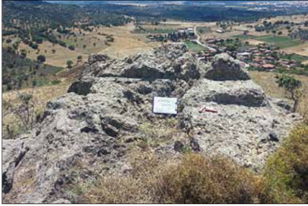
Resim 15: Hisarköy Kaya Kült Alanı Hisarköy Köyü / Hisarköy Rock-Cut Monument near Hisarköy Village

Edremit Ovası bu bağlamda üç farklı düzenlemeye ve ayrı ayrı fonksiyonlara sahip olan kaya kült alanlarını barındırmaktadır diyebiliriz. Bu anıtlardan ilki yerleşim yerleri ve su kaynaklarına yakın alanlarda düzenlenen,