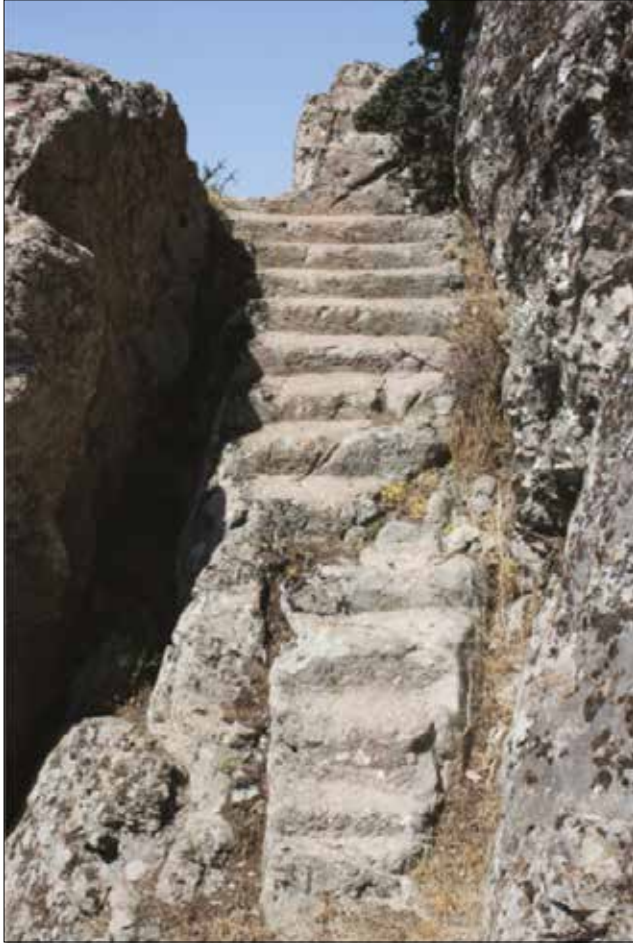
Resim 8: Ulutaş Kaya Kült Alanı Basamakları / Steps from Ulutaş Rock-Cut Monument (Ashi Saka)