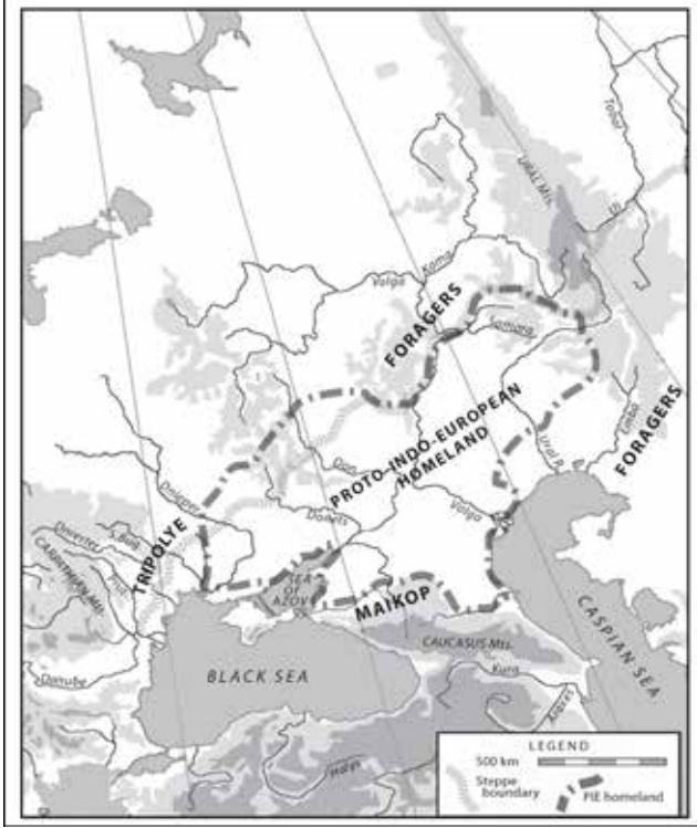
Resim 4: Pha Topluluklarının Son Revizyonlara Göre Tahmin Edilen Köken Bölgesi (Anthony 2007: 84) / The Proto-Indo-European Homeland Between About 3500–3000 BCE According to the Latest Revisions.

görünüşe göre Hint-Avrupalılar için ortaya atılan bu köken bölgesi varsayımını destekler niteliktedir (Resim 4). 59