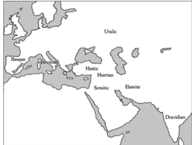
Resim 1: Hint-Avrupa Dillerinin Dağılımı (Mallory/Adams 2006, 9) / Distribution Of The Indo-European Languages .

Güney Rusya’dan başlayarak Altaylar’a kadar uzanan alan içerisinde çok sayıda etnik unsurun yaşamış olduğunu kabul etmek durumundayız. Bunlardan biri olan Hint-Avrupa toplulukları Hindistan, Orta Asya, Avrupa ve Orta Doğu’ya kadar çok geniş bir alanda gerçekleşen göç hareketlerinin en önemli aktörleridir (Res. 1).