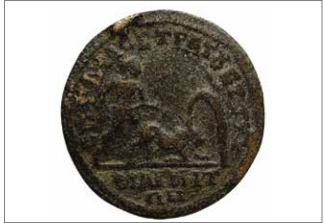
Resim 11: Magnesia Sikkesi, Leukippos ve mağara önünde Hörgüçlü Boğa-Zebu (Arka Yüz) / Coin of Magnesia, Leukippos and Humped Bull - Zebu in front of a cave (Reverse)

Roma Döneminde, Mandrolytos ile Leukippos arasındaki mücadelenin personifikasyon şekliyle anlatıldığı sikke tipleri de yer almaktadır. Bu sikkelerin arka yüzünde yine atlı ve pelerinli bir süvari, ateş sunağı önünde dua eder pozisyonda diz çökmüş olan sakallı bir erkek figürü yer almaktadır. Süvari atını şaha kaldırmış, mızrağı ve köpeği ile saldırı pozisyonda betimlenmiştir (Res. 10) 49 . Kahraman figürleri ile vazgeçilmez olan köpek figürü bu sikkelerde Leukippos'u betimleyecek bir anlatım olmalıdır. Ateş sunağı önünde dua eden pozisyonda olan sakallı figür ise yine Mandrolytos'un alegorik anlatımlarından bir tanesi olarak düşünülmelidir.