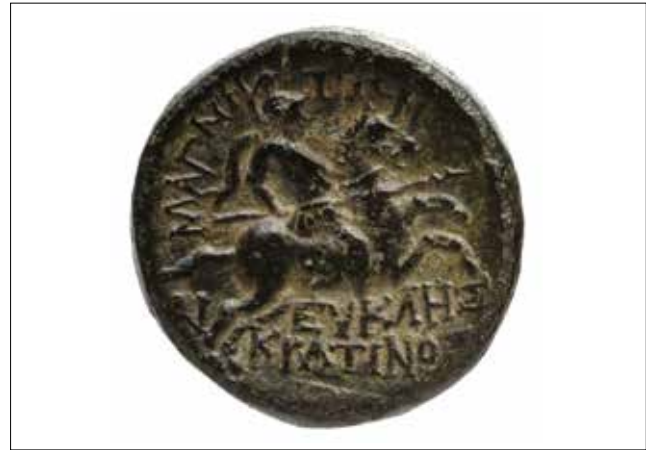
Resim 5: Magnesia Sikkesi, Athena (Ön Yüz) ve Leukippos (Arka Yüz) / Coin of Magnesia, Athena (Obverse) and Leukippos (Reverse)

geçmeyen, ancak kuruluş mitosundaki önemli bir boşluğu dolduracak niteliktedir. Ne yazılarda ne de antik kaynaklarda Athena'nın bu mitostaki rolü ve Leukippos veya Magnetler ile olan ilişkisi ile ilgili hiçbir ipucu yer almamaktadır. İlk kez bu sikkelerden bir örnek yayınlayan Rayet, bu sikkelere de bağlı olarak, Magnesia'da geniş kapsamlı kazılar daha henüz gerçekleştirilmemişken, kentte Athena kültürünün çok önemli bir yer tuttuğunu ve Magnesia'da tanrıçanın bir tapınağı olması gerektiğini ileri sürmüştür 37 . Gerçekten de Rayet'nin yorumunu doğrular şekilde, Magnesia'da Humann Dönemi tiyatro kazılarında bulunmuş bir arşitrav üzerindeki yazıt, Athena'nın "kentlin koruyucusu" veya "zafer getiren" sıfatıyla Magnesia'da tiyatro tepesinde bir "tholos"unun olduğunu ortaya koymuştur 38 . Aynı zamanda tholos dışında, Agora'nın batı stoasında, Athena için düzenlenmiş ve içerisinde iki adet mermer Athena heykelinin de bulunduğu bir kült odası, yine Humann Dönemi kazıları sonucunda ortaya çıkartılmıştır 39 .