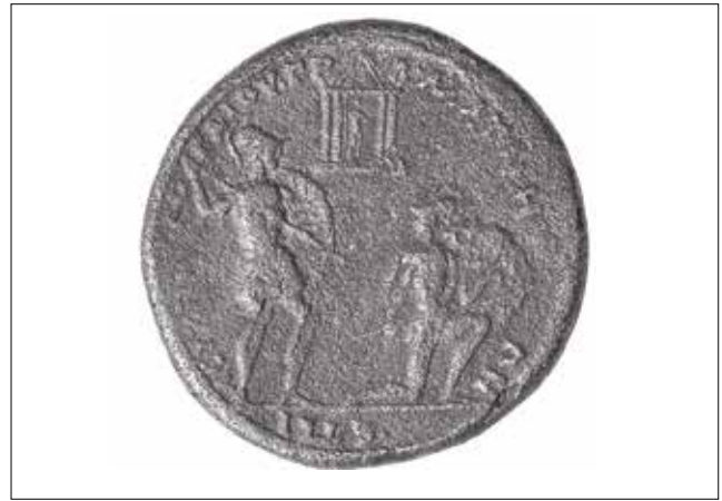
Resim 15: Magnesia Sikkesi, Leukippos ve Mandrolytos, ortada tapınak veya heroon (?) (Arka Yüz) / Coin of Magnesia, Leukippos and Mandrolytos, a temple or a heroon (?) in the middle of the scene (Reverse)

Artemis ile kuruluş mitosunun bütünleştirildiği bir sahne olduğu varsayımı üzerinde durmuştur (Res.15) 55 . Ancak sikkeyi yakından dikkatli bir şekilde incelediğimiz zaman, Bijovsky'in önerdiği gibi bir Artemis Heykeli yerine, sağ elinde mızrağa dayalı çıplak bir erkek heykeli olduğunu söylemek yanlış olmayacaktır. Panhellenik dönemde Roma tarafından onaylandığını ve onurlandırıldığını bildiğimiz Leukippos'un resmîleştirilmesi aslında onun resmi kültürün yaratılmasının bir onayı gibidir. Bu durumda sikke üzerinde, kazandığı zaferin ardından, heroon benzeri bir yapı içerisinde kutsallaştırılmış ve tanrısallaştırılmış Leukippos'un bizzat kendisi, yine alegorik bir anlatımla karşımıza çıkıyor olmalıdır.