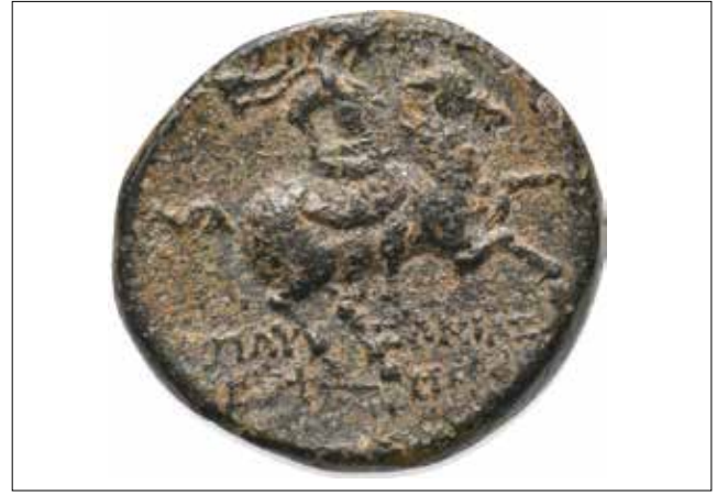
Resim 3: Magnesia Sikkesi, Artemis (Ön Yüz) ve Leukippos (Arka Yüz) / Coin of Magnesia, Artemis (Obverse) and Leukippos (Reverse)

uçayağın ve Artemis portresinin Leukippos'un betimlendiği sikkelerin diğer yüzünde yer alıyor olması kuruluş efsanesinin yazıtta geçen kısmı ile paralellilik göstermektedir.