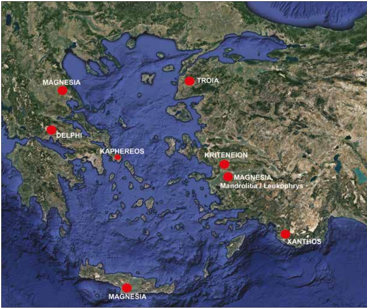
Harita 1: Kuruluş Mitosu ile İlgili Antik Merkezler / The Ancient Cities of the Foundation Myth.

üzerinde, detaylarda bazı farklılıklar olduğu görülmektedir. Kimi sikkelerde sadece mızrak ve petasos giymiş, pelerinli, uzun pantolonlu, “Thessalialı” bir ikonografi içerisinde (Res.1) 31 betimlenen Leukippos, kimi sikkelerde mızrak, kalkan ve miğfer giymiş, uzun sandaletli bir savaşçı ikonografisindedir (Res.2) 32 . Bazı sikkelerde mızrağını gittiği yöne doğru saldırı pozisyonunda tutmuş ve atını şaha kaldırırken (Res.2) ya da mızrağını düz tutarak, atını dörtnala sürerken (Res.1) kimi sikkelerde ise mızrağını yukarı doğru kaldırmış pozisyonda atıyla birlikte rahvan yürüyüşünde betimlenmiştir 33 .