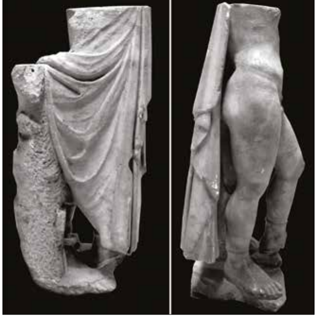
Resim 21-22: Magnesia'da Bulunmuş Çıplak Erkek Heykeli / The Male Nude Statue from Magnesia