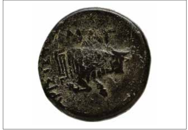
Resim 12: Magnesia Sikkesi, Apollon (Ön Yüz) ve Hörgüçlü Boğa-Zebu Protomu (Arka Yüz) / Coin of Magnesia, Apollo (Obverse) and the protom of the Humped Bull-Zebu (Reverse)