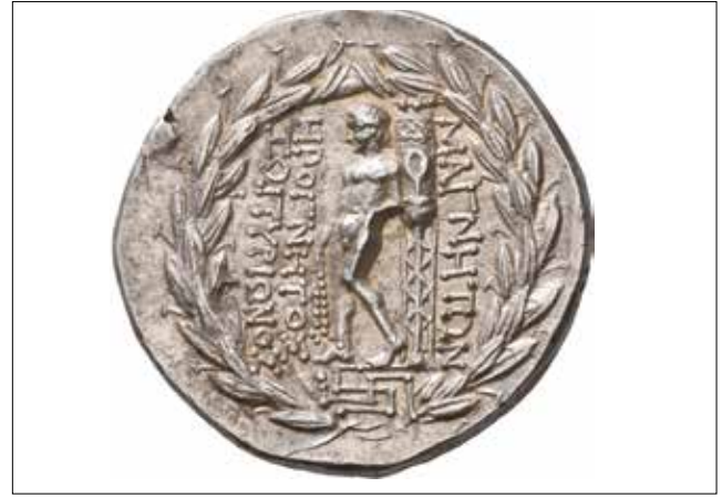
Resim 24: Magnesia Sikkesi, Artemis (Ön yüz) ve Apollon ve (Arka Yüz) / Coin of Magnesia, Artemis (Obverse) and Apollo (Reverse)

ihanet eden Perslerden öcünü alan tanrı Apollon'un da bir zaferi olarak nitelendirmek yanlış olmayacaktır. Bu sikkelerin ön yüzünde de Magnesia'da Leukippos'un aşığı Leukophrye ile özdeşleşmiş Artemis'in olması, Apollon'un ayrıca sol elinde, boncuk dizisi şeklinde iki adet "infula"nın yer alması oldukça önemlidir. Infulae antik dönemde özellikle kurbanların süsleme ögesi 79 olarak kullanılmıştır. Ayrıca mimari dekorasyonlar içerisinde de hayvan başları (bukranion) ve girland dekorasyonu ile bütünleşerek işlenmiştir. Belki de Leukippos'un boğa ile olan arasındaki mücadelesinin ve boğayı Apollon'a sunuşunun, bu sikkeler üzerindeki sembolik anlatımının karşılığı Apollon'un elindeki bu infulaedir.