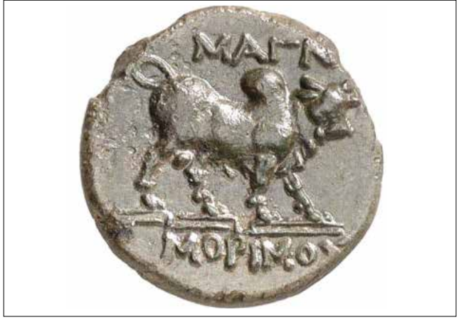
Resim 8: Magnesia Sikkesi, Leukippos (Ön Yüz) ve Hörgüçlü Boğa-Zebu (Arka Yüz) / Coin of Magnesia, Leukippos (Obverse) and Humped Bull - Zebu (Reverse)