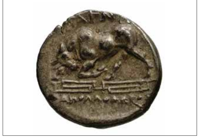
Resim 1: Magnesia Sikkesi, Leukippos (Ön Yüz) ve Hörgüçlü Boğa-Zebu (Arka Yüz) / Coin of Magnesia, Leukippos (Obverse) and Humped Bull - Zebu (Reverse)