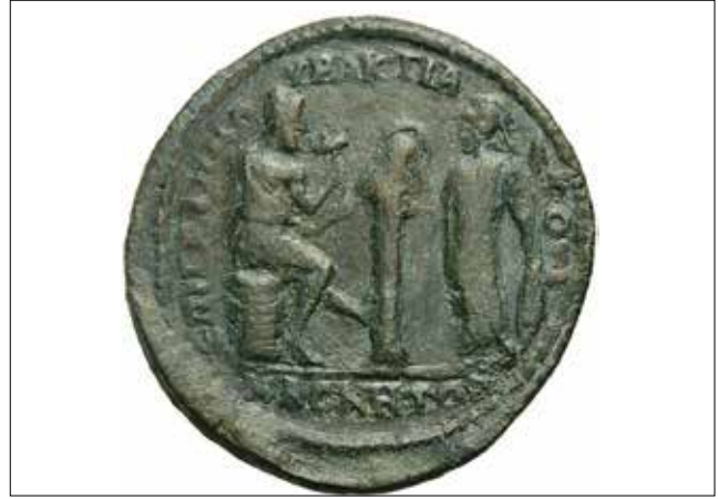
Resim 6: Magnesia Sikkesi, Hephaistos ve Athena (Arka Yüz) / Coin of Magnesia, Hephaistos and Athena (Reverse)