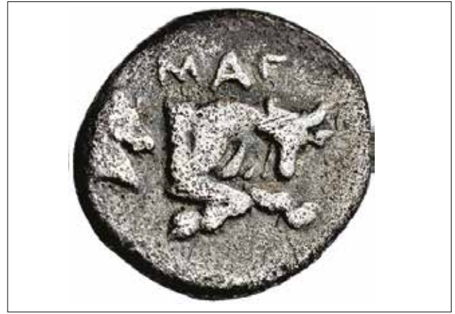
Resim 13: Magnesia Sikkesi, Apollon (Ön Yüz) ve Hörgüçlü Boğa-Zebu ve At Protomları (Arka Yüz) / Coin of Magnesia, Apollo (Obverse) and the protoms of the Humped Bull-Zebu and the horse (Reverse)

Bu görüşümüzü destekler nitelikte bir diğer sikke gurubu ise yine Magnesia'nın Hellenistik Dönem darplarında karşımıza çıkmaktadır. Ön yüzde Apollon portresi, arka yüzde ise ön ayakları hem Hellenistik Dönem'de süvarinin saldırdığı hem de Roma Dönemi'nde mağara önünde bağlı olan boğa ile benzer pozisyonda, ancak protom olarak betimlenmiş yine meander bezekli hörgüçlü boğa figüründe de görülmektedir (Res.12) 52 . Roma Dönemi'nde ve Hellenistik Dönem'de karşımıza çıkan bu iki sikke tipi de Leukippos ile Mandrolytos arasındaki mücadelenin tanrı Apollon ile ilişkisini vurgulamaktadır. Ünik bir sikke üzerinde ise, arka yüzde yer alan boğa protomu arkasındaki at başı, tüm bu yorumlarımızı doğrular niteliktedir (Res.13) 53 .