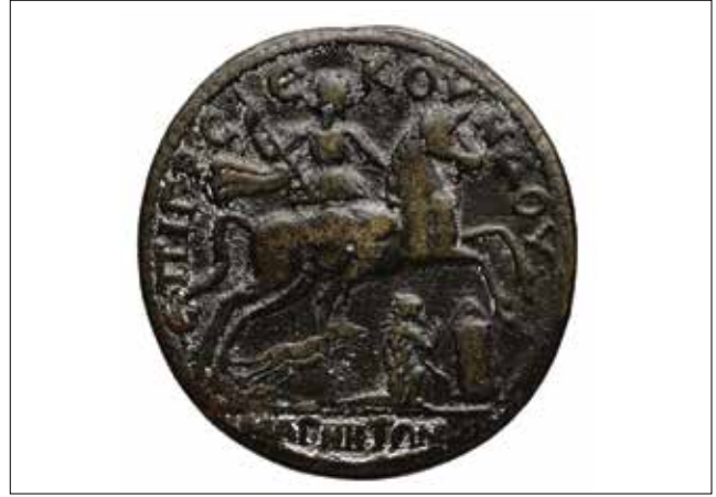
Resim 10: Magnesia Sikkesi, Leukippos ve Sunak önünde Mandrolytos (Arka Yüz) / Coin of Magnesia, Leukippos and Mandrolytos in front of the altar (Reverse)