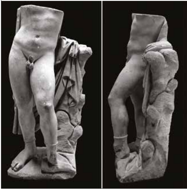
Resim 19-20: Magnesia'da Bulunmuş Çıplak Erkek Heykeli / The Male Nude Statue from Magnesia