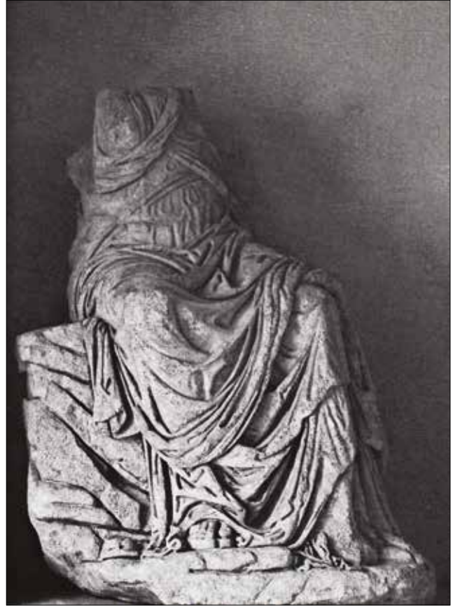
Resim 18: Magnesia’da Bulunmuş Kahraman Grup Heykellerine Ait Erkek Heykeli / The Female Statue of the Group from Magnesia

Mermerden genç bir erkek tasvir edilmiştir. Torso, kollar ve baş kısmı ayrı bir parçadan yapılmış heykelin alt bölümü kaideye kadar korunmuştur. Korunan kısmın üst yüzünde herhangi bir yuva açılmamış olması vücudun diğer bölümlerini taşıyan parçanın korunan parçaya zıvanasız olarak birleştirdiğini göstermektedir. Genç bir erkek anatomisine sahip olan heykel muhtemelen eksik bölümde yer alması gereken boyun kısmına bağlı bir pelerin giymektedir. Bu pelerin sırtını tamamen kapatmakta, heykelin sol arka bacağı arkasındaki destek üzerinde toplanarak topuk arkasına doğru üçgen bir form oluşturacak ve sol tarafta düz yivler oluşturacak şekilde aşağıya uzanmaktadır. Pelerinin arka yüz kıvrım detayları desteğe doğru kıvrılan kısımda ince detaylarla, aşağıya uzanan kısımda ise derin hatlarla belirtilmiştir. Heykelin sol ayağı öne doğru uzatılmış, sağ bacağı ise destek oluşturacak şekilde düz bir hareket içerisinde. Parmak uçları açık, bilek üzerine kadar uzayan bir bot giymiştir. Sol bacağının arkasında bulunan desteğin ön yüzünde, kıvrılarak ilerleyen ince bir yiv hattı mevcuttur. Desteğin arka yüzü ise genel formu dışında detaysız verilmiş, yüzeyi kaba murçlu olarak bırakılmıştır. Heykel ince bir kaide üzerinde oturmaktadır. Heykelin sol ayağı bilek üzerinden, kaide bölümünün ise sağ ayağının yanından dışa uzanan kısmı kırıktır. Bu heykelin kimliği ile ilgili bilgi verecek belki de en önemli detay sol