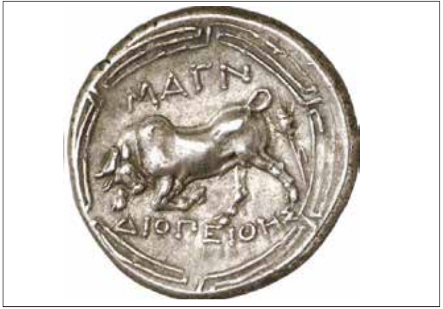
Resim 9: Magnesia Sikkesi, Leukippos (Ön Yüz) ve Hörgüçlü Boğa-Zebu (Arka Yüz) / Coin of Magnesia, Leukippos (Obverse) and Humped Bull - Zebu (Reverse)

şekilde, “bol kıvrım yapan” nehri, yani Menderes Nehri’ni simgelediğini söylemek yanlış olmayacaktır. Bu iki öğeyi birlikte düşündüğümüz zaman, Leukippos’un karşısında, Apollon’un hedeflediği, yeni kentlerini kuracakları bereketli topraklar bulunmaktadır. Anlaşıldığı üzere, bu toprakların sahibi ise antik kaynaklarda ve yazıtlarda geçen Mandrolytos’un alegorik bir şekilde gösterimi “hörgüçlü boğa” olmalıdır. Bu detaylardan yola çıkarak ön yüzde Magnetlerin önderi Glaukos soyundan gelen Leukippos, arka yüzde ise Magnetlerin kentlerini kuracağı toprakların sahibi Mandrolytos’un üzerine doğru saldırıya geçmiştir. Bu guruba giren sikkeler arasında bir diğer tipte ise, süvari elindeki mızrağı saldırı pozisyonunun aksine dik bir şekilde tutmaktadır. Bu gruptaki sikkelerin arka yüzlerini incelediğimiz zaman ise diğer tüm örneklerden farklı olarak boğanın sola süvariye arkasını dönük şekilde dört ayağı üzerinde durduğu görülmektedir (Res.8) 46 . Bu sahne ise mücadelenin henüz başlamasından önceki bir durumu betimlemek adına görselleştirilmiş olmalıdır. Diğer sikkelerde ise mücadele başlamış hatta sonuçlanmış,