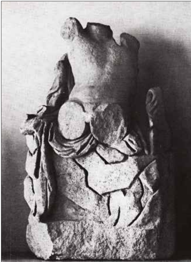
Resim 17: Magnesia'da Bulunmuş Kahraman Grup Heykellerine Ait Erkek Heykeli / The Male Statue of the Group from Magnesia