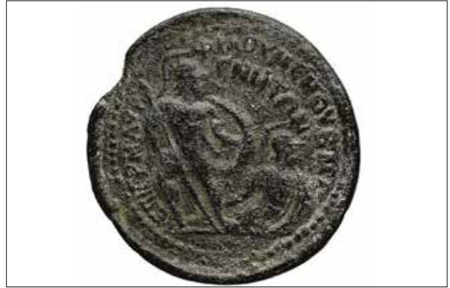
Resim 14: Magnesia Sikkesi, Leukippos ve Mandrolytos (Arka Yüz) / Coin of Magnesia, Leukippos and Mandrolytos (Reverse)