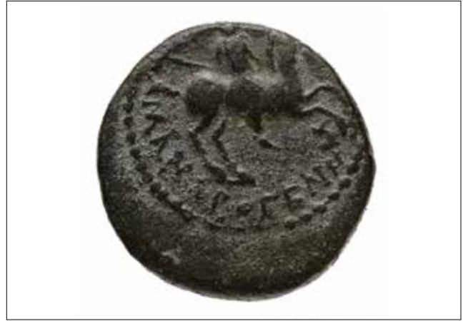
Resim 7: Magnesia Sikkesi, Denizatı (Ön Yüz) ve Leukippos (Arka Yüz) / Coin of Magnesia, Capricorn (Obverse) and Leukippos (Reverse)

de olduğu gibi Athena'nın koruyuculuğu ile bu şekilde perçinleştirilmek istenmiştir. Yukarıda adına bir arşitrav üzerinde rastladığımızı belirttiğimiz tanrıçanın Magnesia'da "koruyucu/zafer getiren" sıfatı ile anılmış ve adına tholos planlı bir tapınak yaptırılmış olması da kuruluş mitosundaki rolü ile uygun düşmektedir.