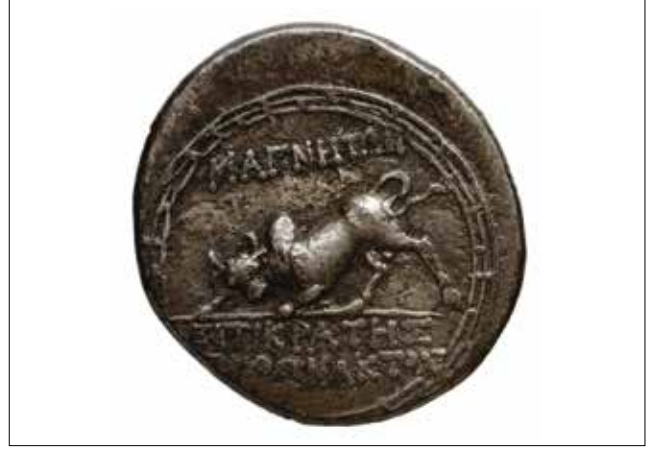
Resim 2: Magnesia Sikkesi, Leukippos (Ön Yüz) ve Hörgüçlü Boğa-Zebu (Arka Yüz) / Coin of Magnesia, Leukippos (Obverse) and Humped Bull - Zebu (Reverse)