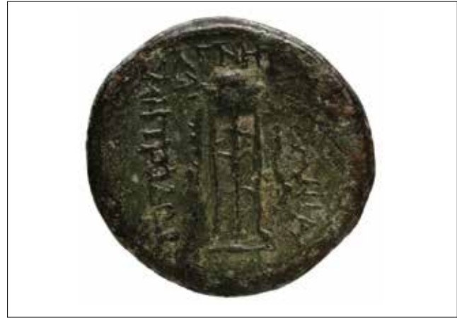
Resim 4: Magnesia Sikkesi, Leukippos (Ön Yüz) ve Apollon-Üçayak (Arka Yüz) / Coin of Magnesia, Leukippos (Obverse) and Apollo-Tripod (Reverse)