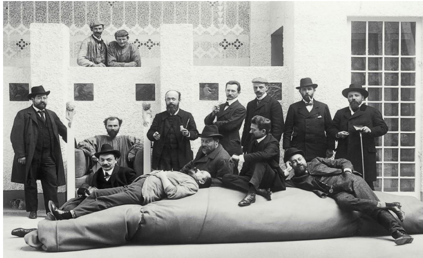
Görsel 1: Viyana Secession Üyeleri, 1902, Beethoven'e Atfedilen Sergi' de Çekilen Grup Fotoğrafı.

Dönemin sanat görüşlerinin yazılı basında yer alması, kabul görürlüğü ve popüleritesi açısından önemliydi. Secession akımı da bu amaçla Ver Sacrum dergisini çıkararak, ilgili çevrelere sanatsal gündemini iletme kararı aldı.