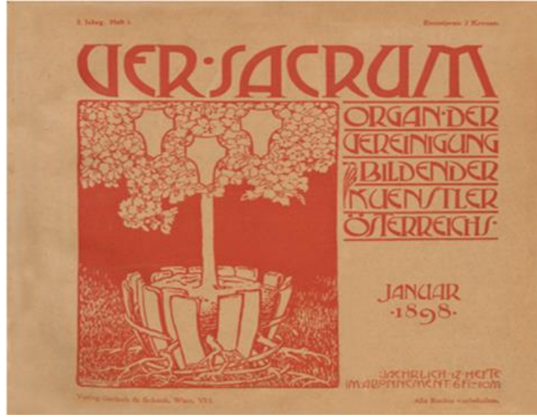
Görsel 3: Ver Sacrum, Alfred Roller, 1.sayı, 1898

( https://www.theviennasecession.com/the-best-of/ver-sacrum-4/ 22.06.2020)