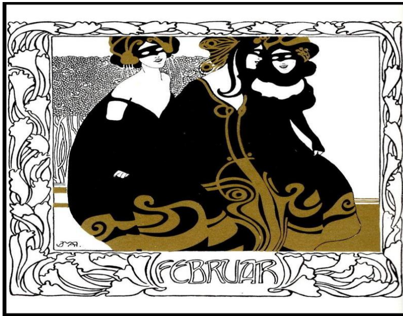
Görsel 5: Ver Sacrum, 1900.

Dönemin popüler Japon Style akımının ötesine geçmek isteyen Secessionistler 1900'de yayınlanan derginin altıncı sayısını, Japon sanatının ruhuna ithaf ettiler (Schmutzler, 1962, s. 75). Özellikle Japon kültürü, Secession akımının başlamasında etkili olduğu bir gerçektir. Bu dönemde Uzakdoğu kültürüne ilgi artmış ve Uzakdoğu sanatının biçimlerindeki ustalık, malzeme zenginliği ve otantik betimleme çeşitliliği ilgiyi arttırmıştır. Yeni yüzyılda sanata yeni bir ruh katmak isteyen Secession sanatçıları doğrudan doğadan esinlenen Japon sanatını Ver Sacrum da belgelendirmişlerdir (Görsel 5).