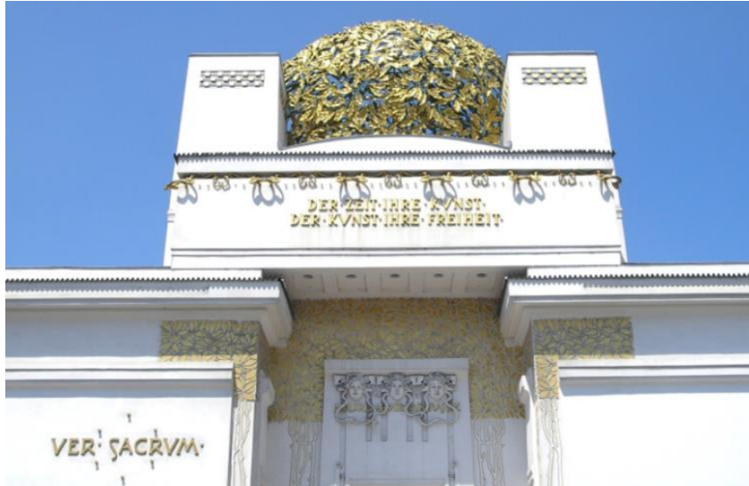
Görsel 2: Secession Binası, Joseph Maria Olbrich, 1897-1899

Özgürleşmek, yenilikler peşinde koşmak adına yaşanan bu ayrılış, Secession ile ilan edilip, Joseph Maria Olbrich tarafından 1898'de yapılan, cephesinde “ Der Zeit ihre Kunst Der Kunst ihre Freiheit ” yani “ Çağın sanatı yapılmalı, Sanatın özgürlüğü olmalıdır ” yazılı Secession Binası ile topluluğu kurumsallaştırdı (Görsel 2). Secession binası, akımın modern fikirlerinin yansıması ve tipik Yunan sadeliğinde dönemin tarihsel Viyana mimarisine karşı bir protestoydu.