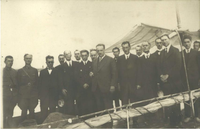
Adliye Vekili Mahmut Esat Bozkurt'un Van Gölü Seyahati