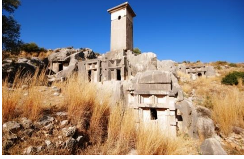
Şekil 3. Xanthos-Letoon