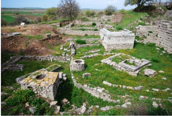
Şekil 5. Troya Antik Kenti

Yönetim planlarına sahip alanlarda, hazırlanacak proje ve planların (Ziyaretçi yönetimi, alanın tanıtımı, alana ulaşım, sosyal ve ekonomik yapı, yerel halkın koruma sürecine dâhil edilmesi vb.) sistematik bir düzenle, her beş yılda bir değerlendirilmesi yapılarak sürdürülebilir bir yaklaşımla uygulanması sağlanmaktadır. Diğer taraftan, miras alanına yönelik kısa-orta-uzun vadede gerçekleştirilmesi öngörülen hedef ve eylemleri belirlemek, işlemleri daha da verimli hale getirmektedir. En önemlisi ise, DM alanlarının korunmuşluk durumlarının bu sayede sistematik olarak izlenip değerlendirilmesidir. Ancak, yönetim planına sahip olmayan DM alanları için aynı durum söz konusu değildir. Dünya genelinde DM listesi incelendiğinde, yönetim planına sahip olmayan DM alanlarının maruz kaldığı bir takım problemlerin var olduğu anlaşılmaktadır. Bu problemler, Dünya Miras Merkezi'nin yayınladığı periyodik raporlarda detaylıca belirtilmiştir (UNESCO,2007; UNESCO,2015).