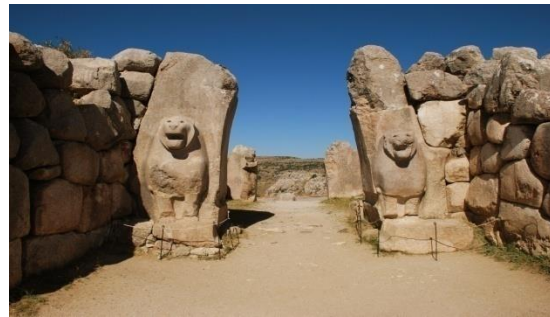
Şekil 2. Hattuşa- Hitit Başkenti