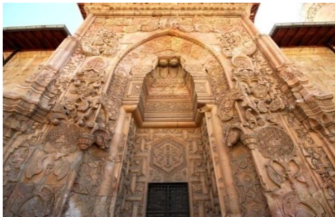
Şekil 1. Divriği Ulu Camii

Geçici listemizde bugün itibarıyla yukarıda da bahsedildiği üzere 85 miras alanı kayıtlıdır. Bakanlık, DM listesine aday olarak sunulması öngörülen Geçici liste alanlarının alan yönetimi çalışmalarına öncelik vermekle birlikte (Tablo 3), mevzuat gereği sit alanları için de yönetim planları bulunmaktadır (Tablo 4).