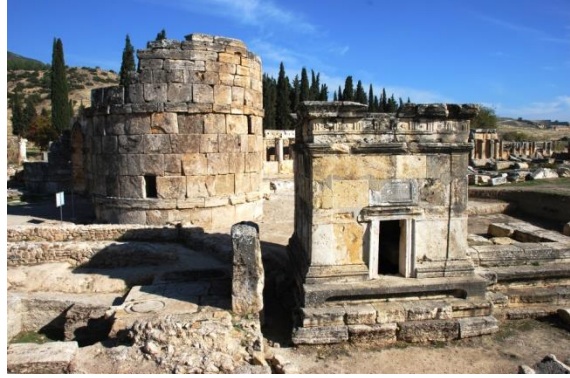
Şekil 7. Pamukkale- Hierapolis