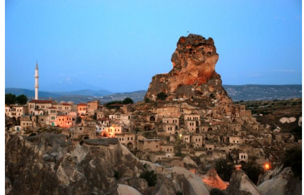
Şekil 6. Göreme Milli Parkı ve Kapadokya