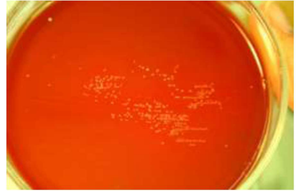
Şekil 2. Referans H. pullorum suşunun %7 kanlı Brucella agarda koloni morfolojisi (Başaran Kahraman, 2010).

Helicobacter türü gibi H. pullorum ' un da karbonhidratları fermente etmediği, identifikasyonda kullanılan birçok biyokimyasal aktivite testinin sonuca katkı sağlamadığı bildirilmiştir (Atabay ve ark., 1998; Melito ve ark., 2000; Stanley ve ark., 1994; Steinbrueckner ve ark., 1997; Zanoni ve ark., 2007).