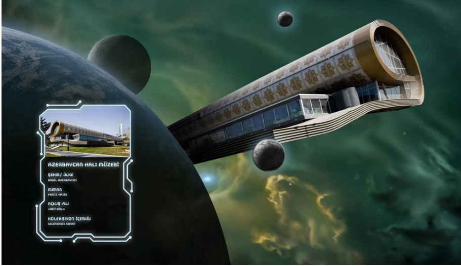
Bakü Halı Müzesi, Azerbaycan. (Dijital Kolaj – Ceren Karadeniz & Ayşem Yanar, 2020)

İnsanın anlam ve ölümsüzlük arayışı içinde önemli bir yol taşı ve anıt olarak kabul edilen müzeler insan elinden çıksın ya da çıkmasın evreni temsil eden her şeyi kapsayan bir evrensellik ülküsüyle hareket etmeye başlamışlardır. Bu hareket müzelerin erişilebilir olma isteğini artırmış, eşitlik, çeşitlilik ev katılım stratejileri geliştirmelerini de zorunlu hale getirmiştir. Anlam ve ölümsüzlük arayışı içinde daha önce de olduğu gibi çeşitli zorluklar yaşamakta ve bu gelişmeler müzecilik yaklaşımlarını yakından etkilemektedir.