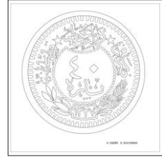
Çizim: 9-b Arka Yüz