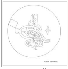
Çizim: 1-a Ön Yüz