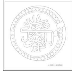
Çizim: 1-b Arka Yüz