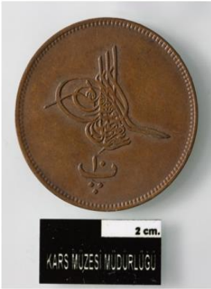
Foto: 6a- Ön Yüz

Anlamı : Allah'ın aziz yardımıyla Hicri 1277 yılında Kostantiniye'de darp edildi.