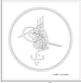
Çizim: 6-a Ön Yüz