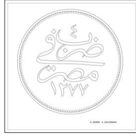
Çizim: 6-b Arka Yüz