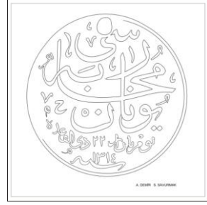
Çizim: 8-b Arka Yüz