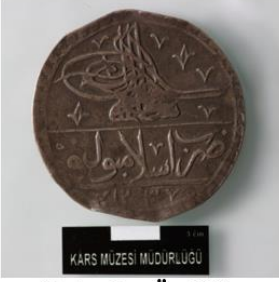
Foto: 2a- Ön Yüz محمود خان بن عبد الحميد المظفر دائم ضرب في اسلامبول ١٢٣٧