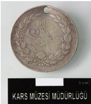
Foto: 8a- Ön Yüz

Anlamı : 10 Para, Allah'ın aziz yardımıyla Hicri 1277 yılında Kostantiniye'de darp edildi.