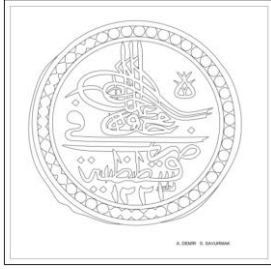
Çizim: 3-a Ön Yüz