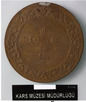
Foto: 10a- Ön Yüz

Anlamı : 40 Para, Osmanlı Devleti'nde, Kostantiniye'de Hicri 1327 yılında darp edildi.