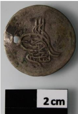
Foto: 1a- Ön Yüz