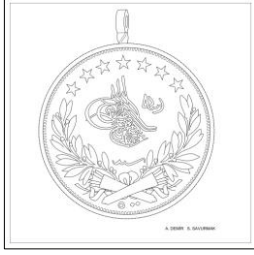
Çizim: 5-a Ön Yüz