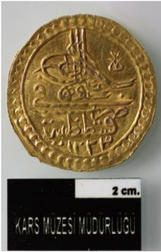
Foto: 3a- Ön Yüz

Anlamı : İki karanın Sultanı, iki denizin Hakanı, Sultanođlu Sultan.