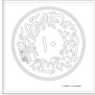
Çizim: 7-b Arka Yüz