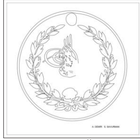
Çizim: 8-a Ön Yüz