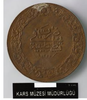
Foto: 10b-Arka Yüz

محمد خان بن عبد المجيد المظفر دائم رشاد سنة ٥