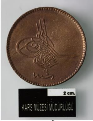
Foto: 7a- Ön Yüz

Anlamı : Sene 4 (Padişahın cülus yılını gösteren rakam.), Hicri 1277'de Mısır'da darp edildi.