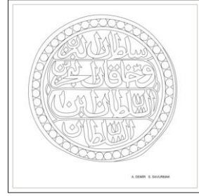
Çizim: 3-b Arka Yüz