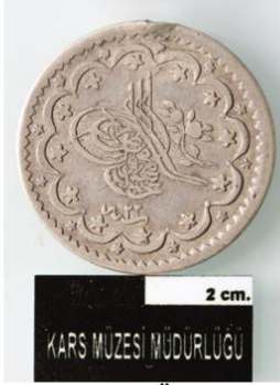
Foto: 4a- Ön Yüz

Anlamı : İki karanın Sultanı, iki denizin Hakanı, Sultanođlu Sultan.