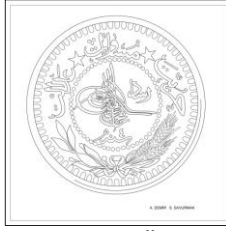
Çizim: 9-a Ön Yüz