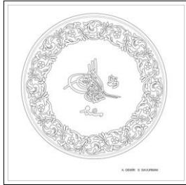
Çizim: 10-a Ön Yüz