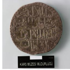
Foto: 2b-Arka Yüz السلطان المبرين وخاقان البحر ين السلطان ابن السلطان