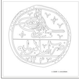
Çizim: 2-a Ön Yüz