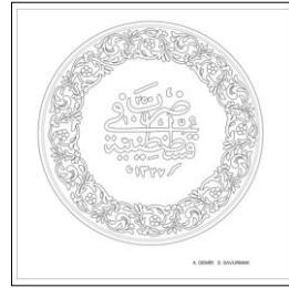
Çizim: 10-b Arka Yüz