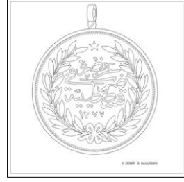
Çizim: 5-b Arka Yüz