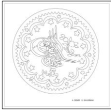
Çizim: 4-a Ön Yüz