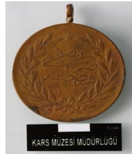
Foto: 5b-Arka Yüz