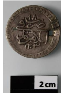
Foto: 1b-Arka Yüz