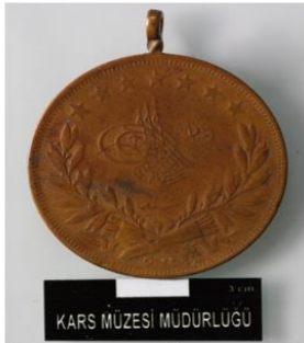
Foto: 5a- Ön Yüz

Anlamı : Allah'ın aziz yardımıyla, Hicri 1255 yılında Konsantiniye'de darp edilmiştir.