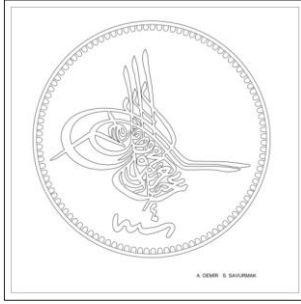
Çizim: 7-a Ön Yüz