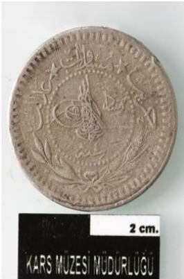
Foto: 9a- Ön Yüz

Anlamı: Yunan Savařı (Dömeke Meydan Muharebesi), Hicri 1314, 23 Zilkade Pazar Günü (Miladi 25 Nisan 1897 Pazar.) Bu sikke Osmanlının son meydan Muharebesi adına basılması nedeniyle önemlidir.