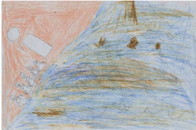
Resim 1. İlker'in “Deniz kirliliğinden etkilenen balık” empatisini kurarken çizdiği resim

Tablo 1'den de görüleceği üzere öğrenciler, kendilerine sunulan altı farklı empati rolü içerisinde “Belediye otobüsü şoförü” “Çocukların kötü davrandığı kedi”, “Deniz kirliliğinden etkilenen balık” ile “Sulanmayan, güneş görmeyen çiçek” adlı konuları çok büyük oranda (öğrencilerin yaklaşık % 91'i) seçmişlerdir. “Pet şişe ve atık kağıt toplayan kişi” adlı konuyu 6 öğrenci, “Sanayi Sitesi'nde çalışan çocuk” adlı konuyu ise sadece 1 öğrenci seçmiştir. Görüldüğü gibi öğrenciler önemli bir oranda hayvan ve bitki ile gündelik yaşam içerisinde sık sık karşılaşlarına çıkan “Belediye otobüsü şoförü”nü kendi deneyim dünyalarına daha yakın görmüşlerdir. Diğer konular ise, öğrencilerin daha az tercih ettikleri konular olmuştur. Bu çerçevede görüşme yapılan bazı öğrencilerin çizdikleri resimler ile görüşme metinlerine aşağıda yer verilmiştir. Aşağıda örnekleme yer alan dört öğrencinin çizmiş olduğu resimler ve görüşmeler sırasında ifade ettikleri düşünceleri metin olarak sunulmuştur. İlk olarak “Deniz kirliliğinden etkilenen balık” rolünü seçen İlker'in çizdiği resim ile görüşmede ifade ettikleri sunulacaktır.