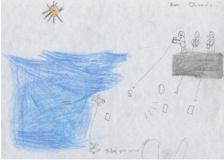
Resim 2. Burç'un "Deniz kirliliğinden etkilenen balık" empatisini kurarken çizdiği resim