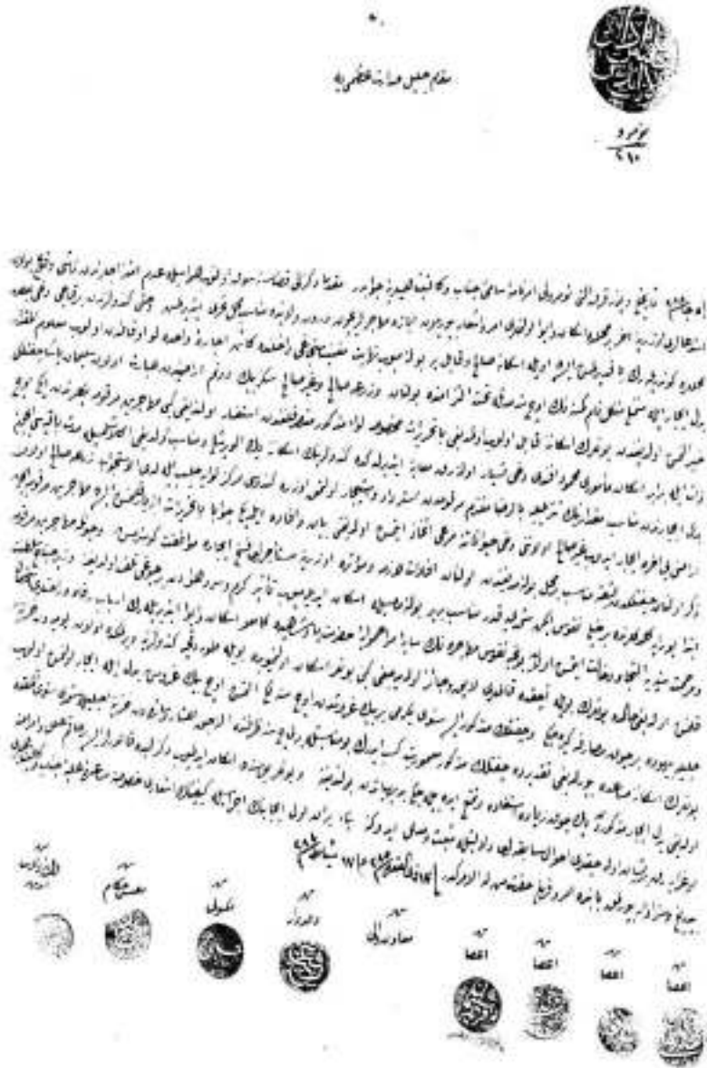
Ek-5: Başbakanlık Osmanlı Arşivi, İ.DH, 596/41530.