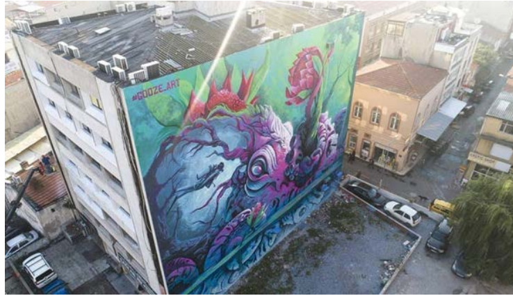
Şekil 8. Konak ilçesinde uygulana "Derin" adlı mural çalışması (URL-2, 2021).

Ülkemizin üçüncü büyük kenti ve ikinci büyük limanı olan İzmir, tarihin her döneminde farklı kültür, din ve dilden insanların buluşma noktası olmuştur. Bu çok kültürlü karma yapı İzmir'in sosyokültürel ve demografik yapısına da yansımış, kentin sokakları sanatla bütünleşmiştir. İzmir Büyükşehir Belediyesi ilk olarak 2018 yılında 150. kuruluş yıldönümü etkinlikleri için Uluslararası İzmir Duvar Resimleri Çalıştayı düzenlemiş, 23 ülkeden 92 sanatçı arasından çalıştay jürisinin belirlediği 8 sanatçının eserleri, Konak ve Alsancak'taki 8 duvara uygulanmıştır. 2019 yılında ikincisi düzenlenen Uluslararası İzmir Duvar Resimleri Çalıştayı'nda yer alan iki mural dünyanın en büyük sokak sanatı topluluğu olan Street Art Cities'in 2019 Aralık ayı seçkinde yer almıştır. Street Art Cities'de yer alan murallardan Konak Kemeraltı'ndaki Gooze-Art tarafından uygulana "Derin" adlı çalışma birinci (Şekil 8), Alsancak Çavuşoğlu Apartmanı'nda Qbic tarafından uygulanan "Yeni Dünya" adlı çalışma ise üçüncü (Şekil 9) sırada değerlendirilmiştir. 2020 yılında çalıştayın üçüncüsü düzenlenirken, çalıştay dışında da mural yarışmaları düzenlenmekte ve bu sayede kentte mural sayısı giderek artmaktadır (URL-2, 2021).