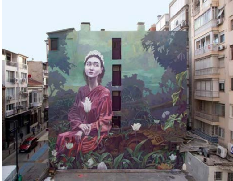
Şekil 9. Alsancak'ta uygulanan "Yeni Dünya" adlı mural çalışması (URL-2, 2021).

2020 yılında yaşanan pandemi sürecinde ise İzmir Büyükşehir Belediyesi Korona Kahramanları Mural Yarışması'nı düzenlemiştir. Bu kapsamda araştırma kamusal sanat olarak muralların farkındalığı arttırıcı ve umudu yenileyici rolünü yeniden gündeme getiren Korona Kahramanları Mural çalışmasından yola çıkarak, kentsel çevre bağlamında muralların rolünü irdelemekte ve uygulanan çalışma sonrası yapılacak olan karşılaştırmalı çalışmalar için kaynak oluşturmayı hedeflemektedir. Araştırma kentsel çevrede kamusal sanatın çok boyutlu etkileri olduğunu ortaya koymakta ve kamusal sanat olarak duvar resimlerinin şehrin yaşanabilirliğini ve sürdürülebilirliğini sağlamadaki önemini göstermeyi amaçlamaktadır.