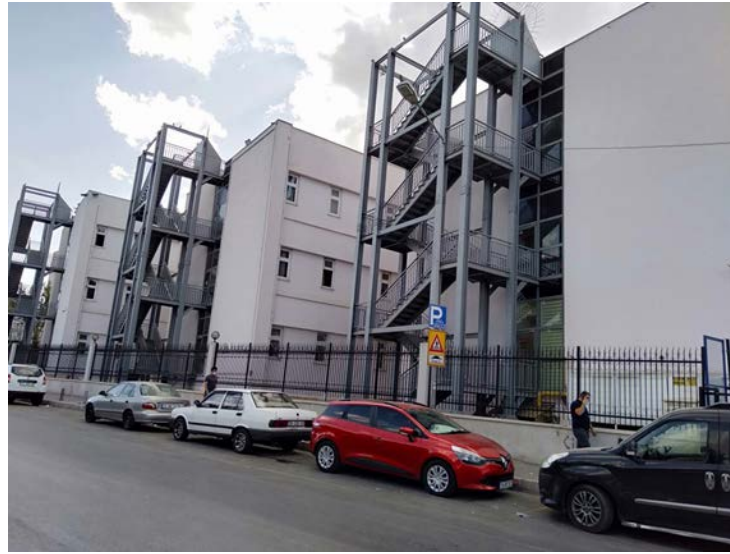
Şekil 11. İzmir Eşrefpaşa Hastanesi'nde muralın uygulanacağı duvarlar. (Duvar ölçüleri 14x6,45 m) (URL-3, 2020).