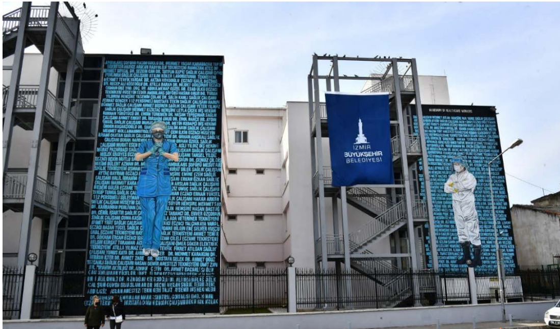
Şekil 12. Yarışma sonucu tamamlanan uygulama (URL-4, 2021).