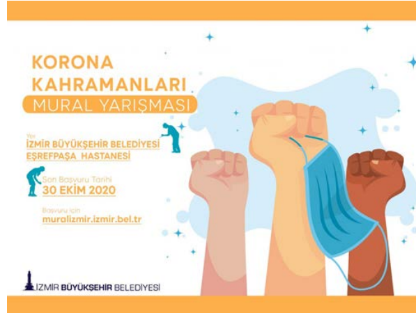
Şekil 10. Korona Kahramanları Mural Yarışması afişi (URL-3, 2020).