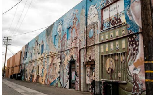
Şekil 7. Mural Village, Fresno (CA) (URL-1, 2021).