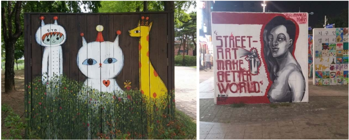
Şekil 4 ve 5. Güney Kore’de duvar resmi örnekleri.

Zebracki (2012), kamusal sanatın amacını dört ana başlıkta toplamaktadır.