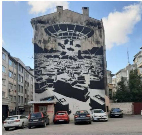
Şekil 6. Kadıköy'de otopark olarak kullanılan bölgede sağır duvara uygulanan mural çalışması.

Duvar resimleri ülkemizde de giderek yaygınlaşmakta, İstanbul ve İzmir gibi büyük şehirlerde mural yarışmaları düzenlenmektedir. Tüm dünyadan sanatçıların çizdiği murallar şehrin duvarlarını süslemekte ve kayıp alanları kente kazandırmaya yardımcı olmaktadır (Şekil 6). Dünyada da murallar giderek yaygınlaşmaktadır öyle ki mural kenti (mural district) ya da mural köyü (mural village) kavramları ortaya çıkmakta, bu kavramlar duvar resimlerinin oldukça fazla bulunduğu yerleşim bölgeleri için kullanılmaktadır. Bu alanlar birçok farklı duvar resimleri ile birçok ziyaretçiyi alana çekmektedir. Örneğin Güney Kore'de Ihwa ve Jaman Mural Köyleri, Vietnamda Tam Thanh Mural Köyü ve Amerika'da Mural Kenti (Mural District, CA, Fresno) (Şekil 7).