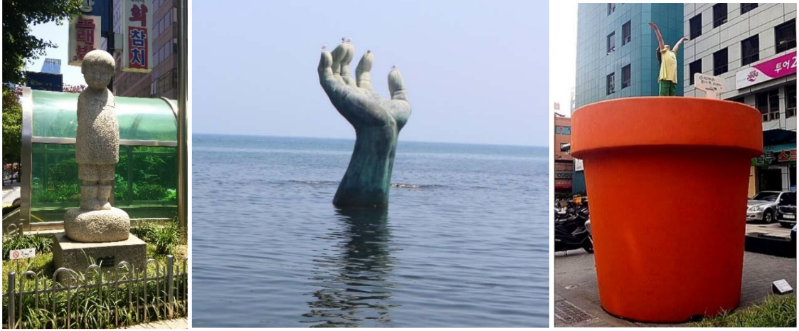
Şekil 1, 2 ve 3. Güney Kore’de heykel örnekleri.