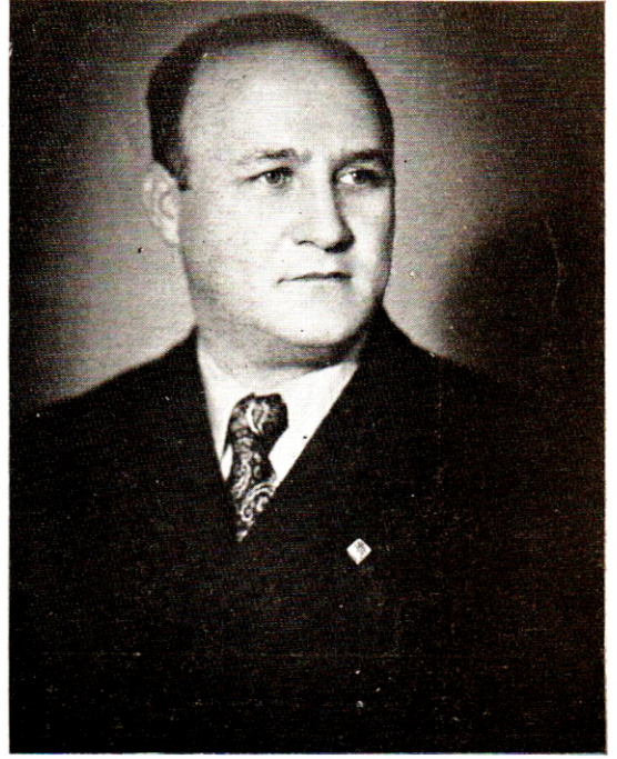
1939 da İstanbulda