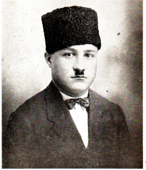
1925 de Antalyada