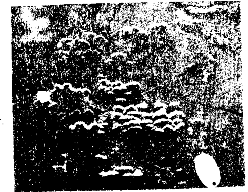
Abb. 4. Schizophyllum commune Fr.

Die dritte Pilzart, welche auf dem Pappelholzlagerplatz häufig gefunden wurde, ist Schizophyllum commune Fr., Gemeiner Spaltblättling, (Abb. 4). Die kleinen, graugefärbten Fruchtkörper sind halbiert hutförmig und sitzen dem Substrat exzentrisch auf. Der Pilz besitzt eine trockene und lederige Konsistenz; er kann sich beim Trocknen eindrehen