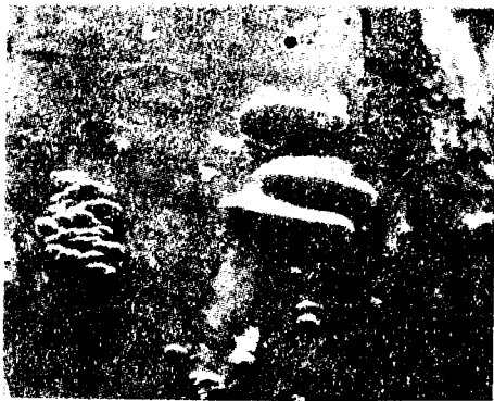
Abb. 3. Polystictus hirsutus (Wulf.) Fr. (im Bilde rechts) und Schizophyllum commune Fr. (im Bilde links).

Neben Stereum purpureum war auch Polystictus hirsutus (Wulf.) Fr., Striegeliger Porling, zu finden (Abb. 3).