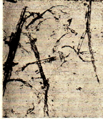
ŞEKİL 1. Lâdinden elde edilen mekanik odun hamuruna ait lifler

3 numaralı şekilde, yarı kimyevi metodla istihsal edilmiş bulunan selüloz lifleri görülmektedir. Burada mevcut liflerin fazla bir dağılıma maruz kalmadan iyi bir şekilde yekdiğerinden ayrılmış oldukları müşahede edilmektedir. Bu bakımdan liflerin birbirine iyi bir şekilde bağlanmaları dolayısıyla mukavemet vasfı da tatmin edici bir durumda bulunmaktadır. Yarı kimyevi selüloz istihsalı metodunun hususiyet icabı, odundaki lignin maddesinin bir kısmı bertaraf edilmekte ve geride kalan kısım ise muhtemelen selüloz liflerini yekdiğerine bağlamak suretile mukavemeti arttırıcı bir tesir yapmaktadır.