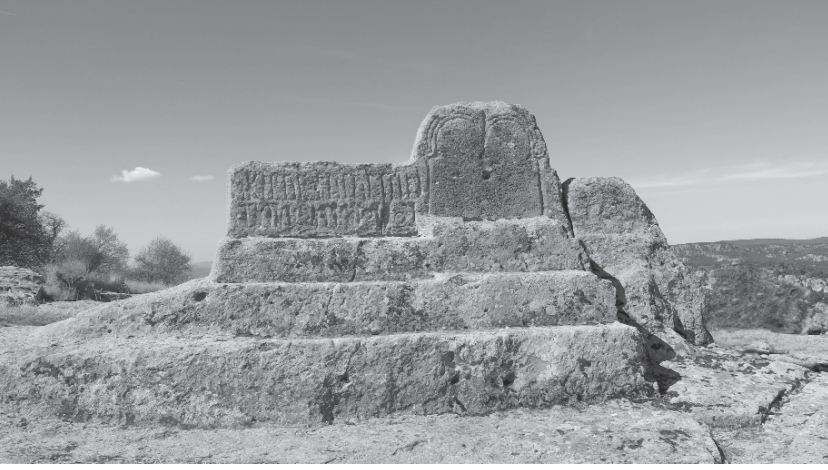
G. 3: Eskişehir ili, Yazılıkaya Köyü, Midas Kale Büyük Altar