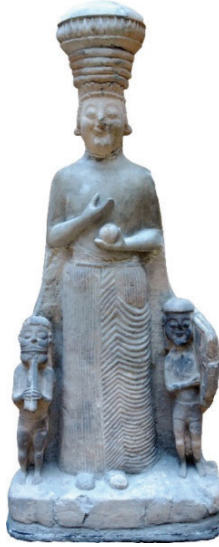
G. 9: Çorum ili, Hattuşa / Boğazköy Heykel Grubu (Anadolu Medeniyetleri Müzesi, R. Tamsü Polat, 2016)

Köhnüş Vadisi'ndeki kaya kütlesi üzerinde bulunan üçlü idol örneğinde ise, ortadaki idol büyük olarak yapılmıştır. Büyük idolün her iki yanında ancak bu idolle aynı hizada bulunmayan, daha alta yapılmış idoller vardır. Bu üçlü idollerde olasılıkla merkezi konumdaki idol Ana Tanrıça, yanında ona eşlik eden idoller ise tanrıçaya eşlik eden tanrılara bir işaret olabilir. Merkezde biraz daha büyük bir idol ve iki yanında daha aşağıda ve daha küçük iki idol şeması, Boğazköy heykel grubunda görülen, merkezi konumda bulunan Matar ve ona eşlik eden daha küçük boyutlu iki erkek figürünün şematize edilmiş betimini akla getirmektedir. Boğazköy grubunda, tanrıçanın yanındaki figürler, tanrıçadan oldukça küçük yapılmışlardır (G. 9).