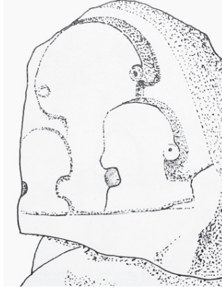
G. 6: Afyonkarahisar ili Köhnüş Vadisindeki üçlü idol (S. Berndt Ersöz, Phrygian Rock-Cut Shrines. Structure, Function, and Cult Practise , 362, fig. 66).

Büyük bir kısmı tekli olarak yapılmış olan idollerin yanı sıra, kayalık alanlardakiler ile bir grup basamaklı altarin basamaklarının gerisinde yapılmış olanlar ile steller üzerindeki ikili (çift), Köhnüş Vadisi'nde, Midas Kale'de kaya üzerinde ve Nakoleia (Seyitgazi) sınırlarında yeni bulunmuş olan bir stelde ise üçlü idollere rastlanmıştır (G. 6, G. 7, G. 8).