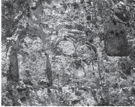
G. 7: Eskişehir ili, Yazılılkaya Köyü, Midas Kale'deki üçlü idol fotoğrafı.