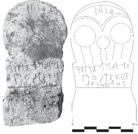
G. 8: Eskişehir ili, Seyitgazi ilçesi, Gümüşbel Köyü sınırlarında yer alan Eski Cami Höyük'ten bulunan idol şeklindeki stel (R. Tamsü Polat, Y. Polat, A. Lubotsky, “An Idol-shaped Stele with an Old Phrygian Inscription in the Territory of Nakoleia”, 66-67, fig. 4-5).

Tek olarak yapılmış idollerin, Eski Frigçe yazıtlarda adı geçen Tanrıça Matar'ın “soyut tasvirleri” olduğu fikri bir grup araştırmacı tarafından kabul görmektedir 27 . Birden fazla başın yan yana yapıldığı örneklerde başlardan birinin Tanrıça Matar'a ait olduğu kabul edilirse, diğer baş ya da başların kimi ya da kimleri betimlediği önemli bir sorudur 28 . Birden fazla başın yapıldığı idoller ile ilgili olarak, başların her ikisinin de tanrıçaya ait olduğu, yani tanrıçanın iki kere betimlenmiş olabileceği öne sürülmektedir 29 . Ayrıca çift idollerin yapılması ile tanrıçanın evrenin hâkimi, doğuran, koruyan ve kollayan Ana olarak farklı ilahi güçlerine işaret edildiğine de değinilmektedir 30 . Yunan ve Roma Dönemi'nde Kybele'nin çift naiskoslarında Kybele'nin iki kere betimlendiği ve tanrıçanın doğasına özgü farklı objeler tuttuğu görülmektedir 31 . Fakat tanrıçanın Frig ikonografisindeki insan görünümündeki tasvirlerinde yan yana betimlenmiş bir örneği bilinmemektedir. Bununla birlikte çift olarak yapılmış idoller, birbirinden farklı olmamakla birlikte, aynı büyüklüktedir. Ayrıca çift idollerde cinsiyete ait işaret bulunmamaktadır.