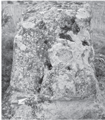
G. 2: Eskişehir ili, Karaalan Köyü, Keskaya yerleşimi. (R. Tamsü Polat, 2004)