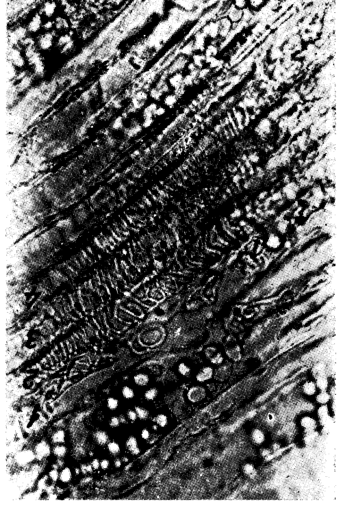
Resim : 2 b

Resim : 2 a — Dondurucu mikrotomla ibrenin Merkezi silindirinden alınmış bir teğetsel boyuna kesit ( 200\times ).