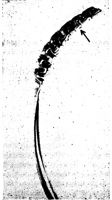
Resim: 1 a