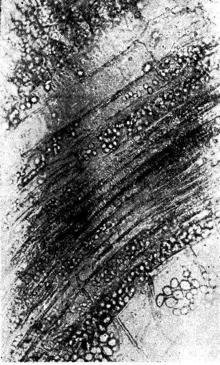
Resim : 2 a