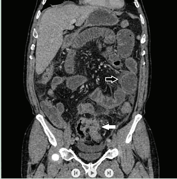
Resim 1. Sigmoid kolonda tümöre ait düzensiz duvar kalınlaşması (içi dolu ok) ve proksimal barsak segmentlerinde dilatasyon (içi boş ok).

Sürekli değişkenler ortalama olarak ifade edildi. Standart sapma (SD), kategorik değişkenler ise mutlak değerler ve yüzdeler olarak sunulmuştur. Sürekli değişkenler arasın-